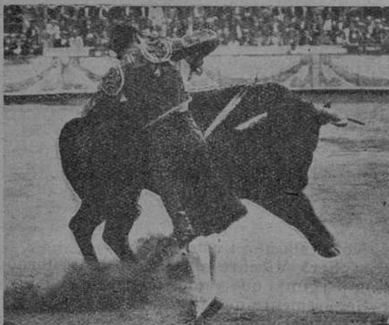
Pasando de muleta en Valencia 1929

¡Y nosotros, que soñábamos con una descripción llena de interesantes detalles!