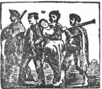
25 Van todos en caravana hacia una venta cercana.