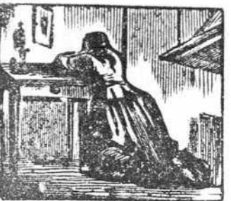
13 Lo llega á saber su amada y llena desconsolada.