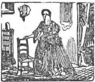
17 Margarita su orfandad llora sola en la ciudad.