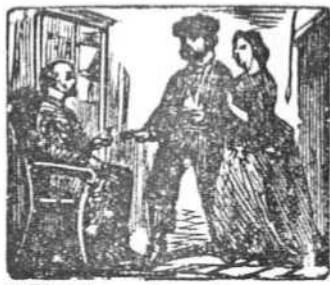
3 El padre, viejo achacoso, aprueba su amor gustoso.