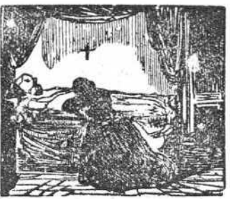
16 El sentimiento es tan fuerte que le ocasiona la muerte.