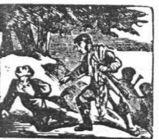
37 Pedro al marqués en el pecho ve herido muy satisfecho.