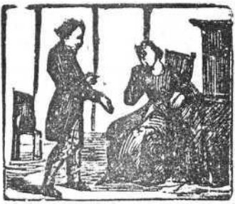
21 A Margarita, el marqués pide su mano otra vez.