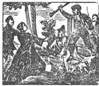
23 Los bandidos de Becerra los detienen en la sierra.