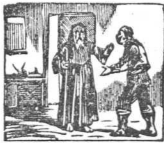
38 Un ermitaño en la venta entra huyendo de la tormenta.