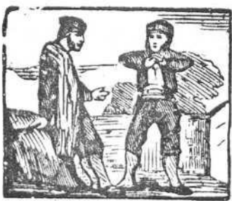
33 Humilde el marqués implora que le dejen la señora.