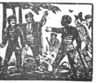
45 Llega de Pedro la gente y lo arrebató valiente.