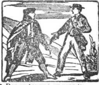
9 Por sostener á su amada, roba al fin con mano armada.