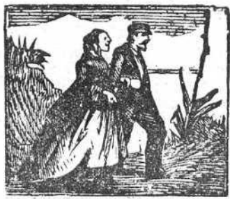
22 A una quinta presurosos van á casarse gozosos.