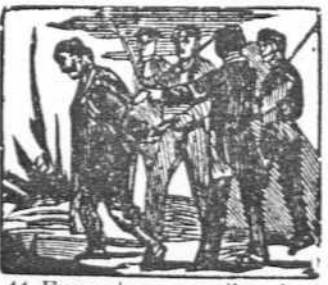
44 Fuera de casa es llevado para morir fusilado.