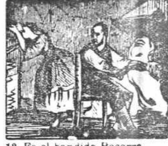
12 Es el bandido Becerra el terror de aquella tierra.