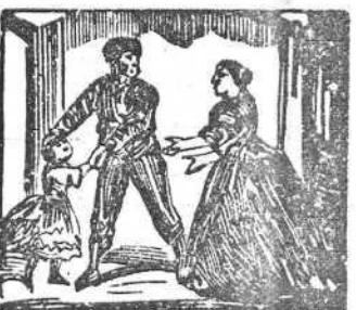
30 Ella su conducta en cara le echa, y se presenta Clara.