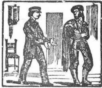
27 Busca á Pedro, y la noticia le revela tan propicia.