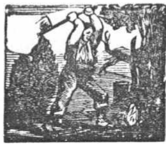
5 Para sostener la casa trabaja el hombre sin tasa.