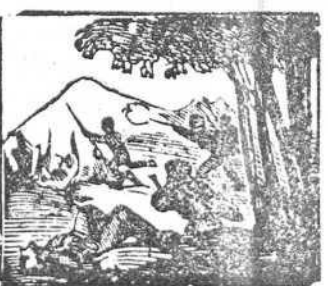
36 Derrotados y vencidos son éstos por los bandidos.