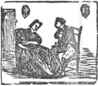
18 Un noble marqués ufano la pide su blanca mano.