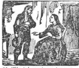
11 Ella tal conducta ignora y sin recelo le adora.