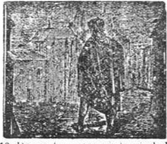
10 De noche entra en la ciudad por verla con ansiedad.