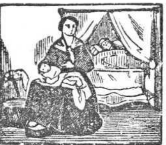
14 El fruto de su pasión da á luz en triste aflicción.