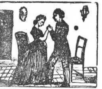
19 Ella acepta aquel partido por librarse del bandido.