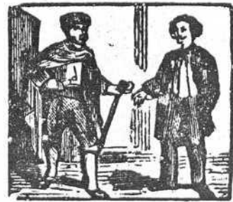
28 El marqués suma crecida les ofrece por su vida.