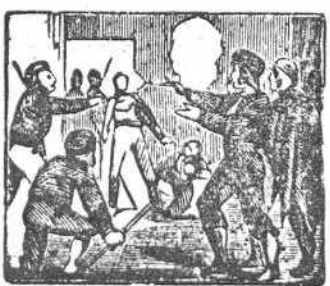
35 Son una noche atacados del marqués por los criados.