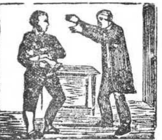
15 Al verlo el padre, se enoja, va, y en la Inclusa le arroja.