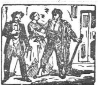
47 Al marqués vida concede, porque su novia intercede.