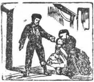
31 Abrazan con etusio al fruto de su pasión.