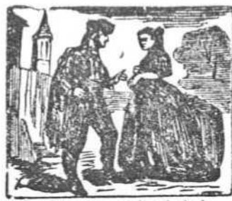
2 De Córdoba en la ciudad enamora á una beldad.