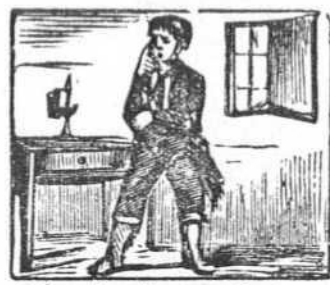
4 Se aflige Becerra al ver que no tiene qué comer.