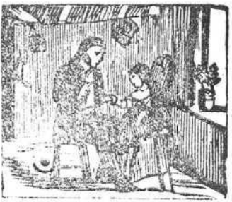
20 Pedro su hija sacó de la Inclusa y la educó.