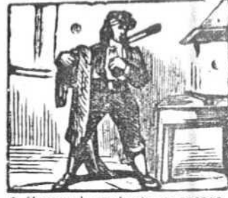
6 Como el producto es escaso intenta dar un mal paso.