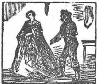
29 Con expresión dolorosa habla Becerra á la hermosa.