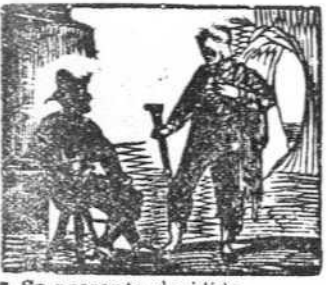
7 Se presenta decidido en la cueva de un bandido.