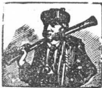
1 Nació el bandido Becerra en la Andalucía tierra.