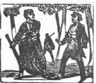
46 Ve el marqués enfurecido que es por Becerra vencido.