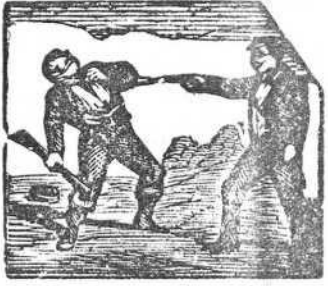
24 El marqués enfurecido dispara y mata á un bandido.