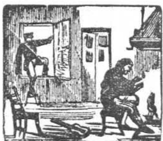
40 Restablecido el marqués, la venta asalta otra vez.