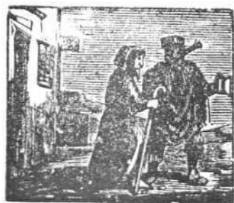
39 Sale Pedro á acompañarlo, en su ermita hasta dejarlo.