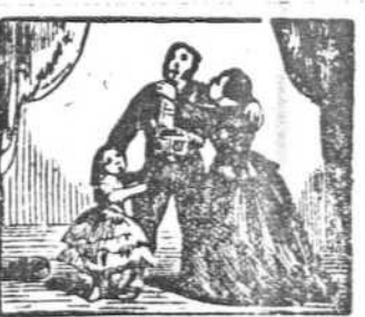
48 Margarita á Pedro abraza y alegre con él se enlaza.