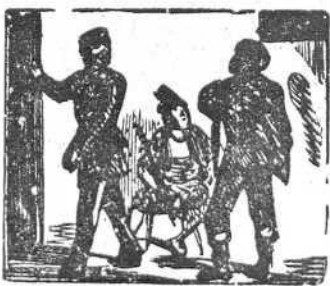
34 Se lo niegan, y furioso se retira presuroso.