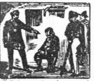
43 Del marqués en la presencia, de muerte oye la sentencia.