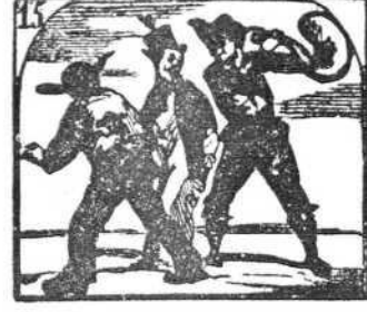
15. A un inocente gallego le pegan con un talego.