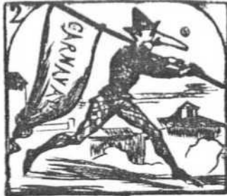
2. Nace en los bailes, y á poco se lanza en la calle loco.