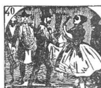
40. En los bailes, la alegría causa gran algazaría.