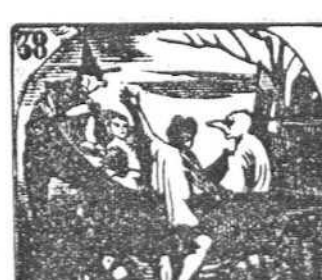
38. Un coche muy adornado con máscaras cruza el Prado.