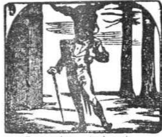
9. Con cabeza de borrico se pasea don Perico.