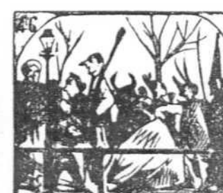
46. En lunes máscaras mil hacen del Prado un pensil.