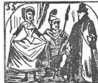
35. En tiempo de Carnaval no hay nada que siente mal.