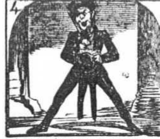
4. Los cuellos de mi camisa hacen reventar de risa.