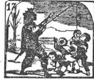
17. Un higo que hace saltar hace á los chicos rabiar.