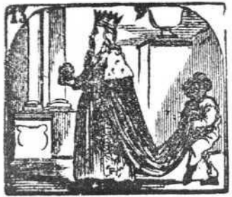
13. Todo el que rey quiere ser puede serlo sin poder.