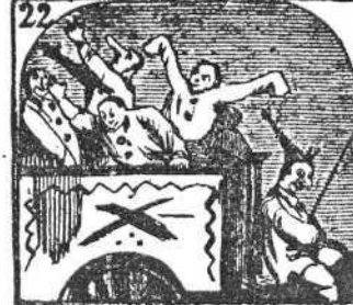
22. Este carro de payasos no son en bromear escasos.