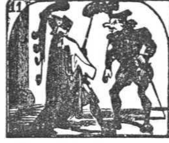
11. Con penachos de colores se ven antiguos señores.