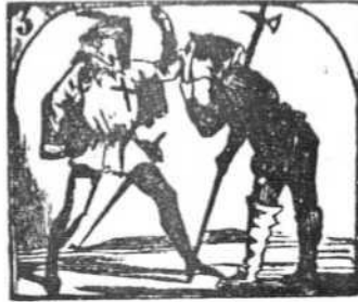
3. Como se cubren la cara, todo es bulla y algazara.