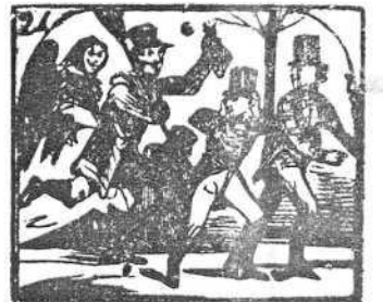
24. Cien máscaras dando gritos aturden á unos pollitos.