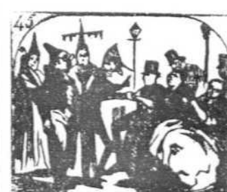
45. En el Prado á los sentados marcan los disfrazados.