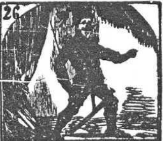
26. Porque jamás cuerdo ha sido va Juan de loco vestido.