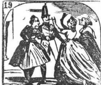
19. Las chicas de buen humor se divierten con furor.