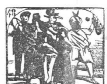
48. A enterrar el Carnaval van en tropel al Canal.