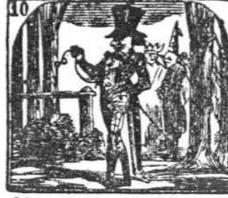
10. Lleva uno grande chistera y frac que barre la acera.