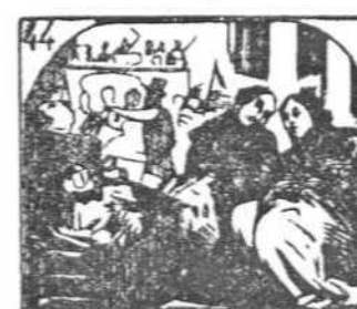
44. De la música al compás duermen todas las mamás.