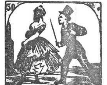
30. A una tapada enamora un pollo, y su amor impropio.