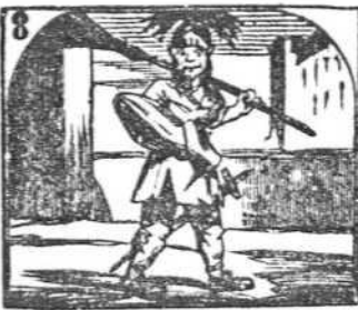
8. El mozo de una tancóna se disfraza de amazona.