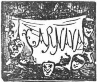
1. Época de bacanal es sin duda el Carnaval.