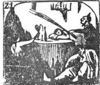
21. Las botellas de licor abundan que es un primor.