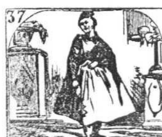
37. Esta griega peregrina con su mirada fascina.