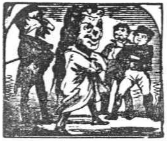
7. Mirad á esos dos enanos cómo pasean ufanos.