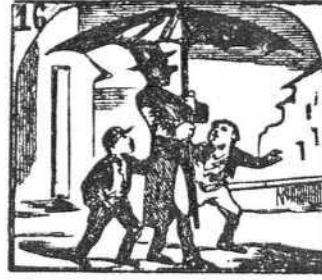
16. Lleva un paraguas Simón de colosal dimensión.