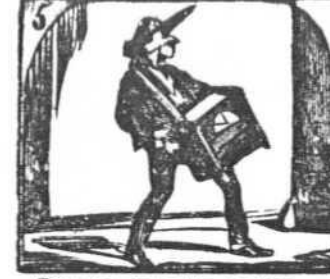
5. Con un organillo Andrés, se disfraza de francés.