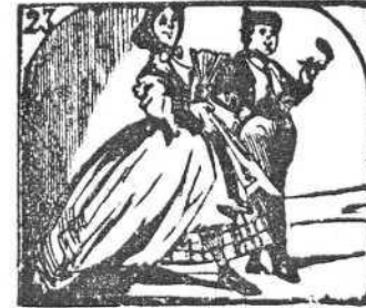
23. Se conoce por la altura la masculina hermosura.