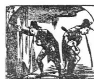
43. Miembros de una estudiantina vomitan en una esquina.