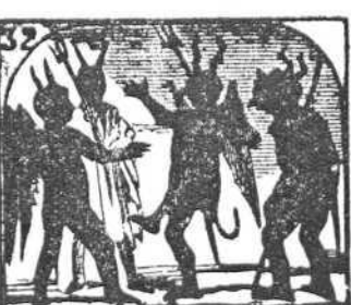
32. Formaron varios chiquillos gran comparsa de diablillos.