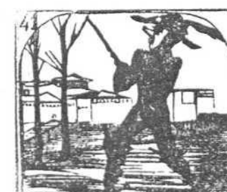
41. Un quidam corre al Canal vestido de general.