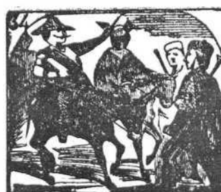
34. Disfrazados muchos chicos van montados en borricos.