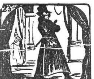
25. De mi gabán los faldones se arrastran por los salones.