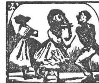
29. Ved á esa niña elegante con cabeza de elefante.