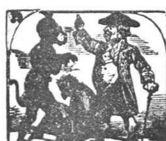
39. Un mono y un cortesano hablando están mano á mano.