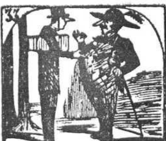
33. Más delgado que un fideo y más obeso que un neo.