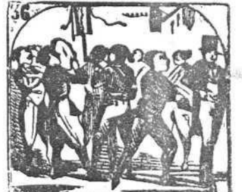
36. Estudiantinas lujosas cantan coplas amorosas.