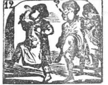
12. Ven treinta niños horros como saltan juguetones.