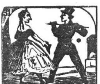
31. Se descubre la hermosura y es una caricatura.