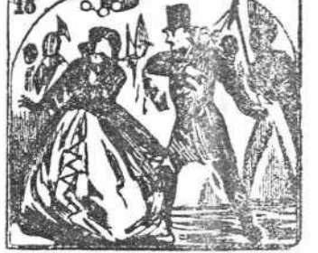
18. Por una broma pesada se pega una bofetada.