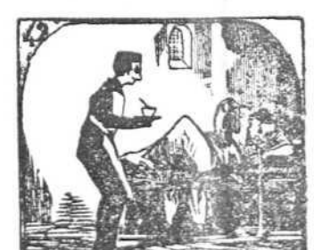
42. Casi siempre en Carnaval hay quien pruebe el hospital.