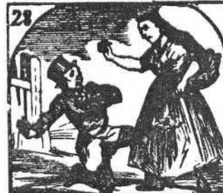
28. Se descubre, y, suerte hiera, es su misma cocinera.