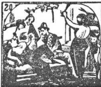
20. Entre el vino y el amor se pasa el tiempo mejor.