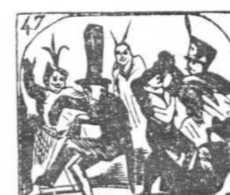
47. El martes ya la alegría raya en demencia, á fe mía.