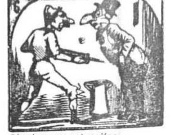
6. Narices en estos días hay más grandes que sandías.