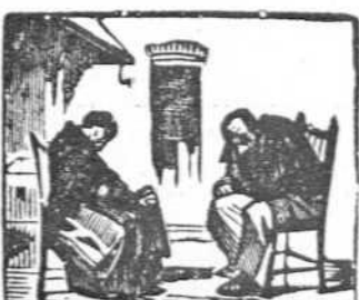
44 Padre y madre mientras tanto riegan la casa con llanto.