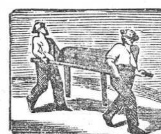
17 Porque no tiene caudal lo llevan al hospital.