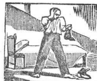
15 Contempla don Juan sus botas y gime al mirarlas rotas.