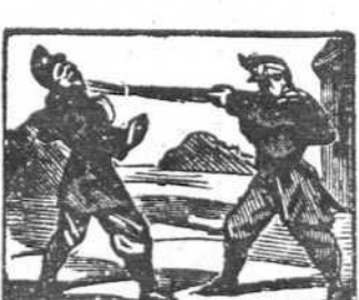
40 Le insulta el cabo Ramiro y airado le pega un tiro.