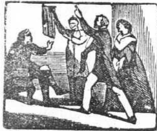
13 Persigen los acreedores á don Gumersindo Flores.