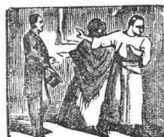
16 Aquel que pide prestado es de todos despreciado.