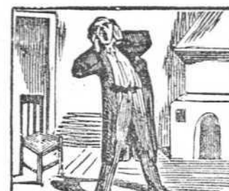
11 Es siempre el hambre severa del cesante compañera.