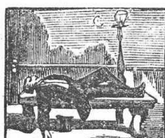
29 Duerme en el Prado al sereno el pretendiente Moreno.