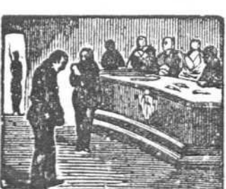
41 El Consejo ha sentenciado que perezca fusilado.