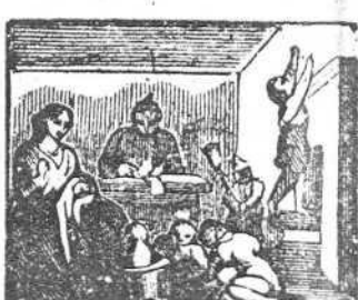
36 Al que no tiene doblones, da Dios hijos á montones.