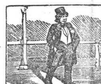
18 Sin un cuarto en el bolsito se pasea Periquillo.