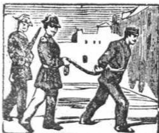
37 Aunque inocente es Severo, le llevan al Saladero.