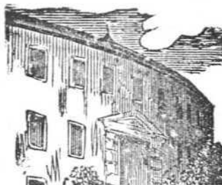
9 Son ventanas elevadas de los pobres las moradas.