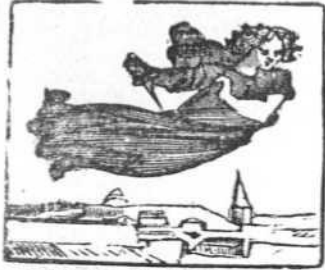
1 De la vida los dolores oíd, amados lectores.