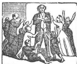
26 Diez hijos y sin tener pan que darles á comer.