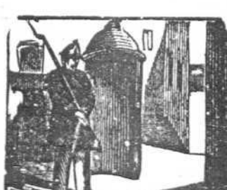
39 A poco tiempo salió y en un regimiento entró.