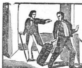
10 Porque no tengo dinero me echa de casa el casero.