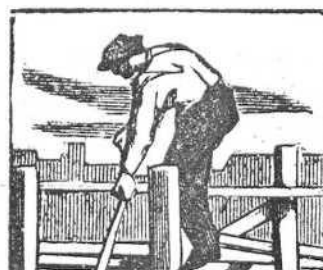
27 Trabaja y suda Pascual por un mezquino jornal.