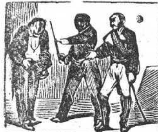
25 De los altos personajes recibe el misero ultrajes.