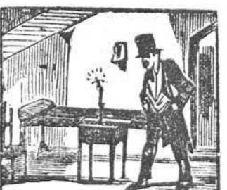
32 Penetra en su palomar y se acuesta sin cenar.