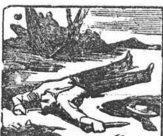
28 De tan desastrosa vida cansado ya, se suicida.