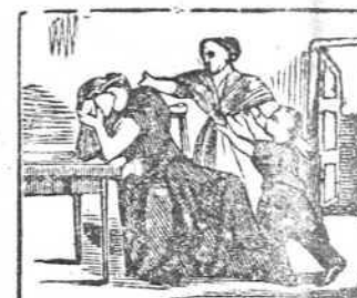
12 Los hijos con triste afán piden á una madre pa.