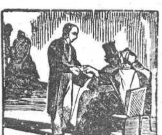
35 Sin vista y desempleado, pide limosna en el Prado.