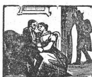
22 Se casó el pobre Miguel y su mujer le es infiel.