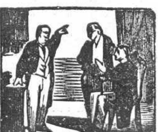
34 Como el pobre no trabaja, le da el ministro de baja.