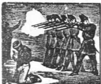
43 De guardias en la pradera quiso su suerte que muera.