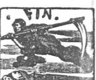
48 La muerte al fin fementida les arrebató la vida.