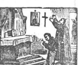
42 Al entrar en la capilla muy contrito se arrodilla.