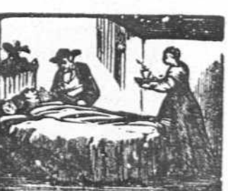
46 Dos vecinos generosos asisten á los esposos.