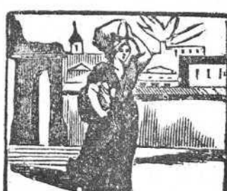
21 Mientras va al río Tomasa se quema toda la casa.