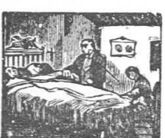
47 La fiebre que los devora acerca la última hora.