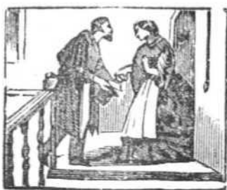
3 Come, sin casa ni abrigo, el triste pan del mendigo.