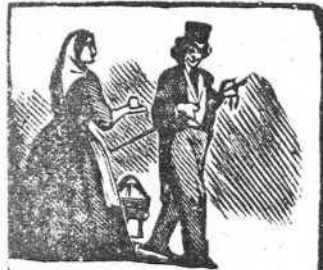
19 Rabia de sed en el Prado, pero sufre resignado.