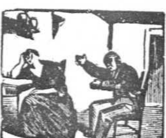
45 Tal suceso en realidad les cuesta una enfermedad.