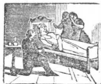
5 La muerte de un ser amado lamenta este desgraciado.