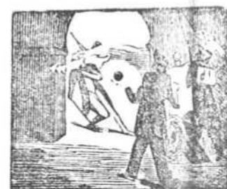
6 De un furioso cañonazo perdió una pierna y un brazo.