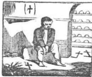
2 Aun de su infancia en la aurora huérfano se mira y llora.