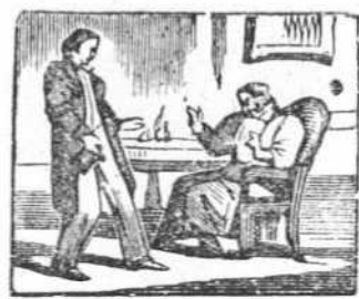
4 El que á pretender se lanza vive sólo de esperanza.