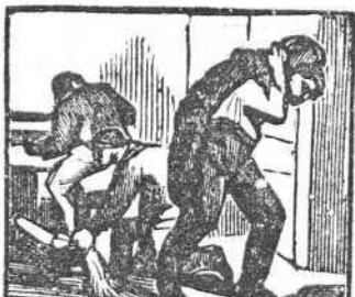
20 A un infeliz los ladrones roban dinero y colchones.