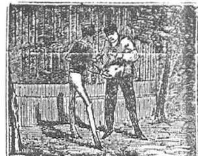
25 Jacobo, que en furia ardia, vengar el ultraje anhela, y en busca de Pedro vuela y le insulta y desafia.