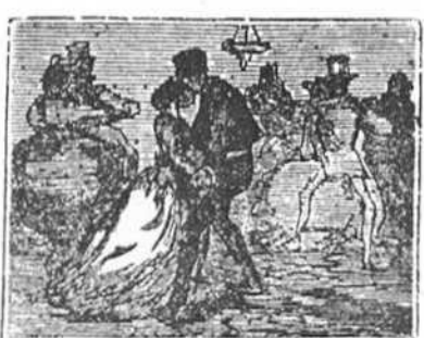
12 Con ardorosos afanes Jacobo y Luisa se amaron y eterna fez se juraron una noche en Capellanes.