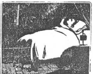
22 De sus penas el rigor la tiene su adversa suerte á las puertas de la muerte en el lecho del dolor.