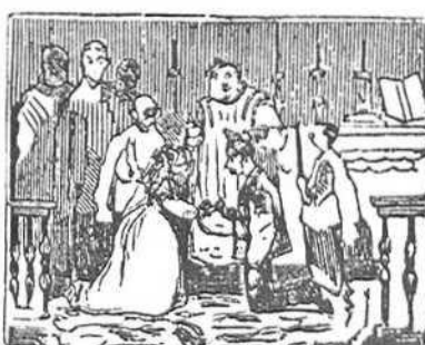
29 Jacobo se corrigió por milagro de Maria y á Luisa con alegría la mano de esposo dió.