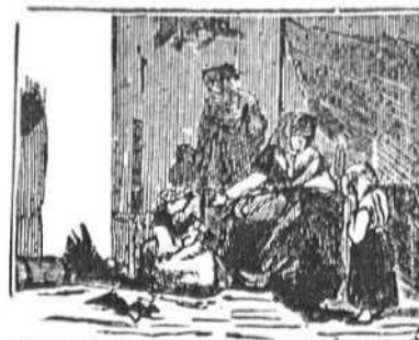
4 Todos deben aspirar en esta misera vida á la paz con que convida de la familia el hogar.