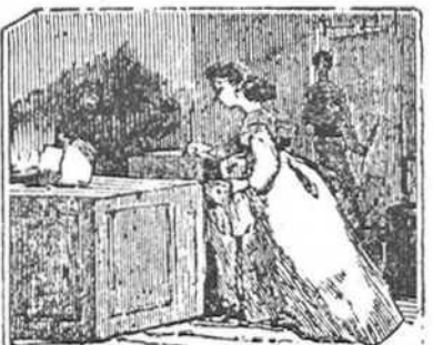
17 A Luisa logra llevar la vecina, mujer lista, á casa de un prestamista, en donde roba un collar.