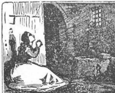
19 En la cárcel solitaria con la fe de su conciencia, pide probar su inocencia, en una santa plegaria.