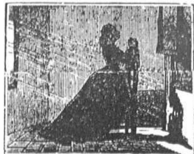
2 Pura y celestial Maria, fuente de consolación, reciba tu bendición la candorosa hija mia.