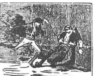
26 Venga el rapto de su amada y venga el supuesto robo dándole á Pedro, Jacobo, una horrible puñalada.