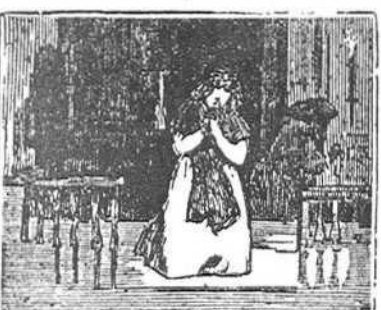
28 Luisa en su afán angustioso ruega á la Virgen del cielo que Jacobo de su duelo vuelva ileso y victorioso.