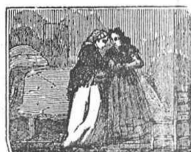
15 A Luisa franca y leal una vecina malvada por Pedro Ruiz sobornada le tiende un lazo infernal