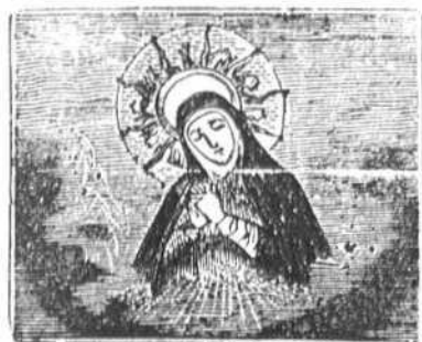
1 Rosa de fragante aroma y estrella de la alborada, por siempre seas venerada, ¡oh Virgen de la Paloma!