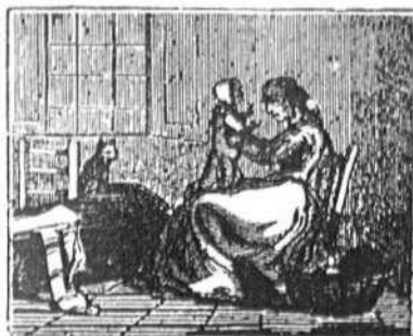
3 La madre con embeleso pone á Luisa en sus rodillas y en sus rosadas mejillas estampa amoroso beso.