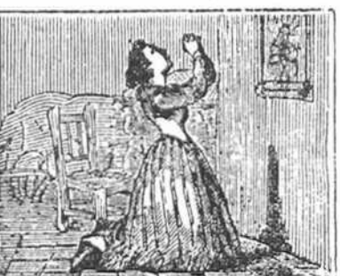
16 El verse pobre le aqueja, y con el llanto en los ojos, pide postrada de hinojos que la Virge la proteja.