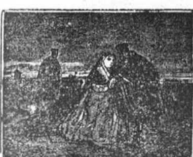
13 Pedro Ruiz en sus desvelos á los amantes seguia, y vengarse prometia, arrastrado por los celos.