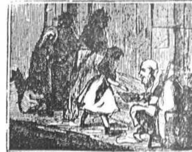
5 Luisita en su corta edad socorre con noble mano á un pobre y desnudo anciano que implora su caridad.