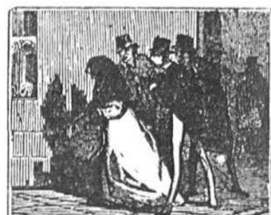
7 De todos sus pretendientes fué por su mal preferido un mancebo pervertido, llamado Jacobo Fuentes.