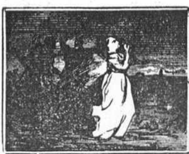
14 Supo Luisa con horror de su amante la locura, y pide á la Virgen pura la consuele en su dolor.