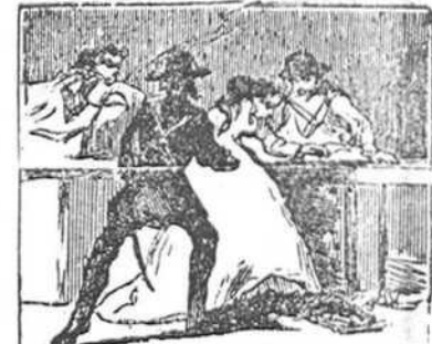
20 Se sintió tan afectada por el gozo y la ansiedad, que al ponerla en libertad cayó al suelo desmayada.