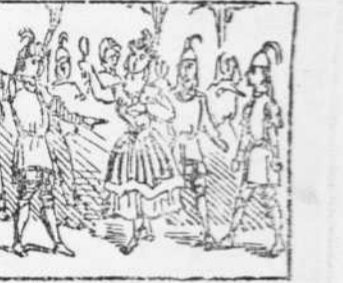
30 En tan que son á casa Surtan la reina y 'ls indios Y 'n Quim se posa á cantá.