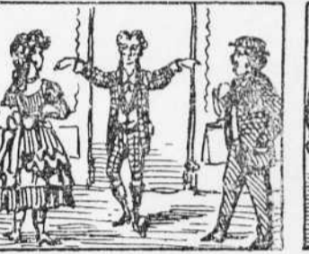
17 Surt altre cop en Matias Y á n' ell y á la Pona els diu Robinson mil picardias.