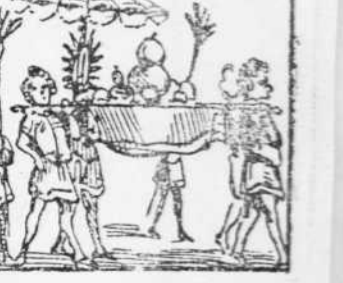
42 Perque no troban escassa La beugada en el lliberi Portan un gran es bossa.