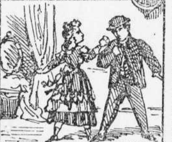
10 Per fer veura que es capás De abarallar-a ab un homa Tracta de achafari el nas.