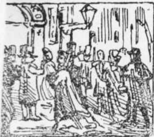
1 Tots els que de broma son Cada nit s' en van al Circo Aplaudí a n' an Robinson.