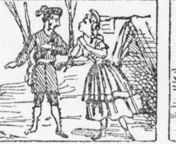
35 Ella á n' ell li fa l' amor Y parlantli de guisados Li fa venir mal de cor.