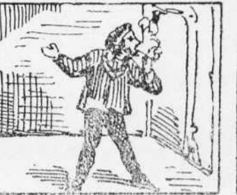
5 Aquet que és un gabatxot Que es ordinari de Vich Y fá de gran sacerdot.