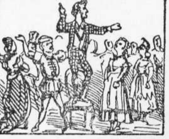
21 En Robinson que ab tot mira, Els fá ua discurs brillantissim Enfilat á la cadira.