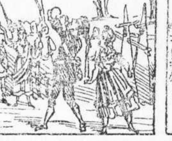
45 Mentres están xaricaut. La Pona ls interrompeix Y tots se quedan mirant.