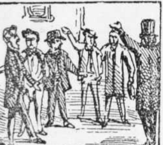
7 Els acceedors cantan Els mobles de Robinson Els volen vend a al enson.