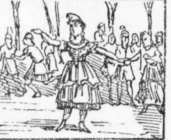
26 Surt la reina dels secalls Ab el seu séquit de indios Fent saltirons y badalls.