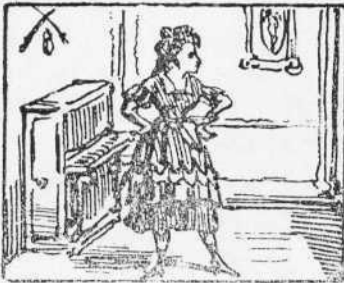
3 Aqueixa tremenda fiera Es la reina dels melingros Que avans era marmanera.