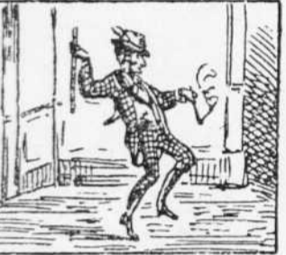
13 Cantan Ay, ay... que es ditxós, Surt en Robinson Petit Tot remenant y fen l' os.