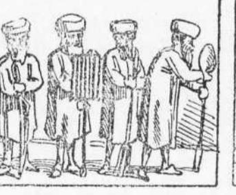
40 Surtan unas talx is veillas. Ab culleras y forquillas Un as de fuste y grac'las.