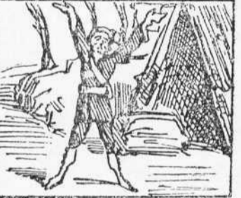
27 Creyon que ha sentit soroll En Robinson es desperta Estirant brassos y coll.