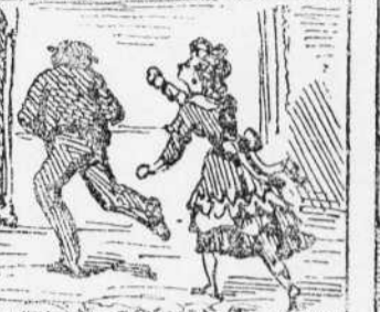
11 Arma Matias masega Perque an Robinson no paga A la Pona que li pega.