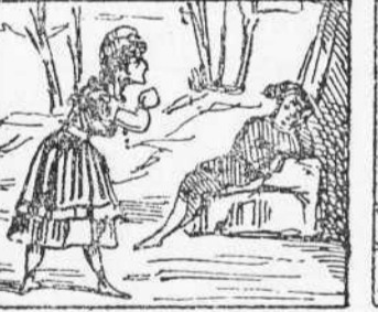
34 La reina del nas que anyora Manjá carn de cristá Den Robinson s' enamora.