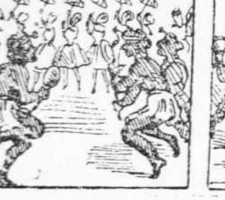
43 Perque li entri més gana De casarse ls ballarins Ballen una americana.