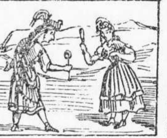
32 As fan móltas reverencias Las dos reinas, y despues Es diuen mil indecencias.