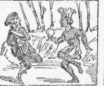
28 Vestit molt de rango ringo Ab un pot de sangueras Surt allí el negre Domingo.