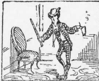
2 Aquet jove de marit Que vesteix un eurrutacó És en Robinson petit.