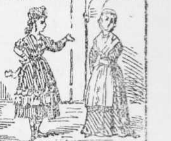
12 La Pona á la Francisqueta Li pregunta per la casa Y ella li á la di treta.