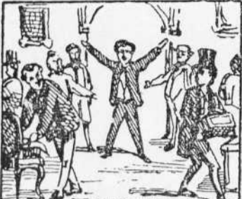
8 Estan en regira ocupats, Surt en Matias y els diu Que aquells mobles son llogats.