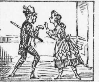
16 An allí cantant tots dos As diuan mil disbarats Y acaban com gat y gos.