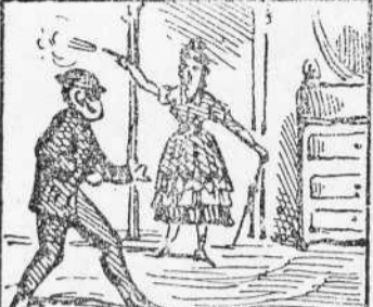
9 Surt la Pona lent tavola Y á na Matias saluda Disparant una pistola.