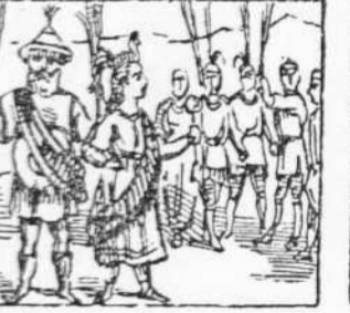
31 Surt la Pona molt formal De reina ab lo seu ministre Y t'can la marxa real.