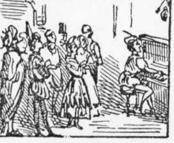
20 Surtan de tota manera Homes y donas cantant La niña que á mí me quera.