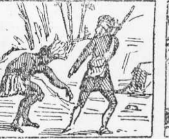
29 Vegeat pitxadas á terra Creyon que son de la fiera Li van á declarar guerra.