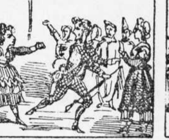
23 Al veura que entra la Pona En Robinson vol fugi Y el detenen fent rodona.