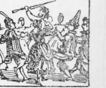
24 Despues de eixa sacagata Tots cantan per despedida El brindis de la Traviata.