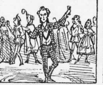
22 Despues que ya habent parlat Cantán el gotim charel-lo Mostra molta habilitat.