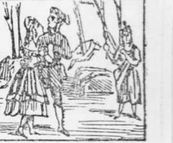
36 La seva dona que entra Com enra nan 'ls dos Per esbravarse delira.