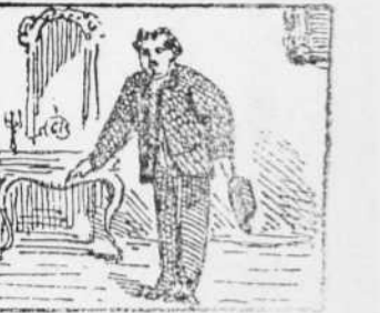
6 Es en Matias Guiveras Un acceedor pasífich Mòlt amich de la ferteras.