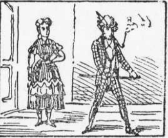
15 Pensa't ab la seva peti En Robinson n' repara Que la Pona está prop de ell.