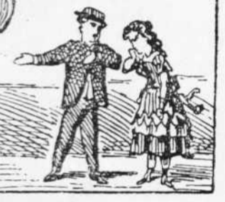
19 An Matias ab prou feyna Desideix á na la Pona Que siga de una isla reina.