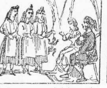
38 Per quant mori 'l desgraciat La seva figura portan En un mico disecat.