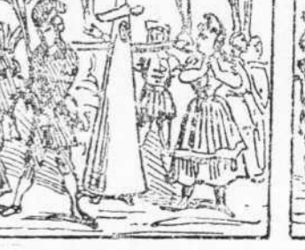
44 Robinson ya 's veu 'l clot El veura que ya 's prepara A casarlo 'l sacerdot.