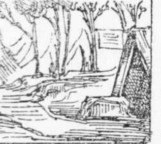
25 Entremix de un bosch de pins A format una barraca En Robinson per sos fíos.