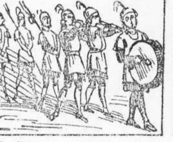
39 Baxen, de mbo y corneti. Un cabo y quatre so dats. Es la escolla que y ya a'li.