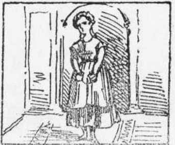
4 Eixa es la reina del nas O la reina dels secalls Puig de noms no an fasin cas.