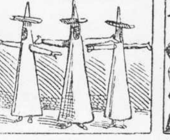
41 Capetios ab paperinas Surtan, patxes ab plomeros Y unas evantas ball'inas.