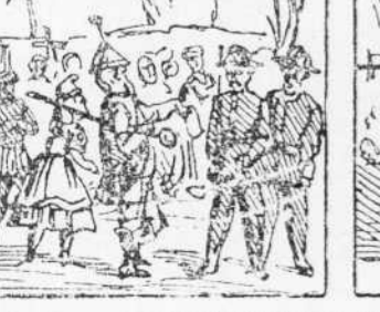
47 Surtan uns crutis fest 'l homa, Y ls volen agafar tots Y els diuen que es una broma.