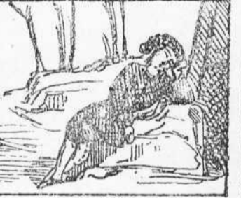
33 Surt 'n Robinson petit Cansat per matá una rata, Se senta y queda adormit.