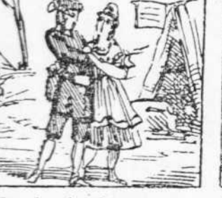
37 Com la reina del nas sent Per Robin on gran amor Es vol casar incontinent.