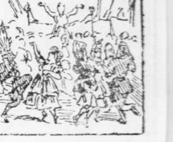
48 Perque no siga un misteri Diuen qui sou, y despues Ballant s' acaba 'l lliberi.