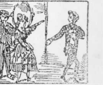
18 La Pona que se enrabia, A nan Robinson petit A pista desafia.