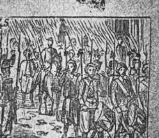
De Francia en la capital hace su entrada triunfal.