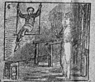
Es en la gimnasia diestro tanto como su maestro.