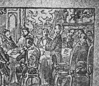
La paz se hace a su deseo en un Congreso europeo.