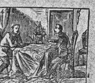
Hace una paz firme y franca con el Austria en Villafranca.