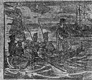
Va, de Francia desterrado, para América embarcado.