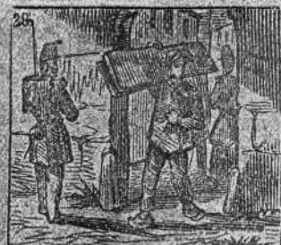
De sus guardias a la faz escapa con un diaz.