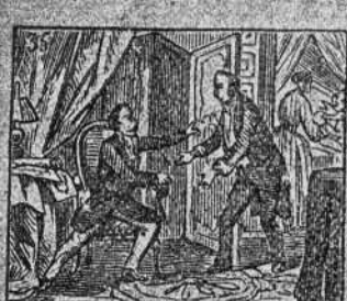
Nace el principe imperial, con aplauso general.