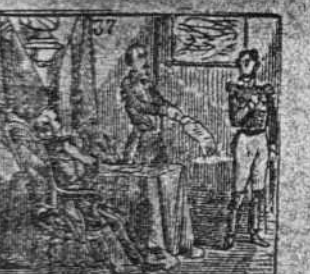
Unido con Inglaterra declara a Rusia la guerra.