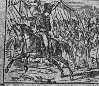
En Suiza empieza a dar pruebas de gran militar.