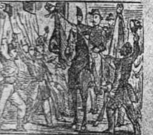
Entra en Bolonia aclamado por el pueblo entusiasmado.