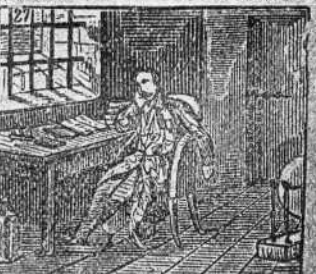
Seguro encierro le dan en el castillo de Ham.