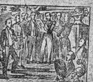
Promulga y da a su nacion la nueva Constitucion.