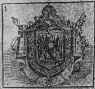
De hombres grandes la memoria de las naciones gloria.