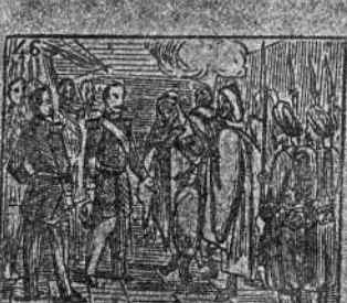
A la Argelia va despues y muy respetado es.