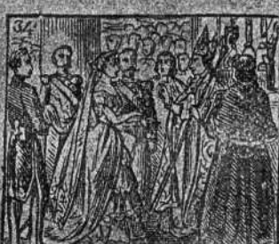
Con Eugenia se casa, de ilustre española casa.