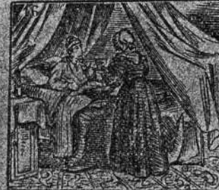
Le asiste, enfermo en Ancona, su misma madre en persona.