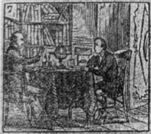
Con facil inteligencia va progresando en la ciencia.