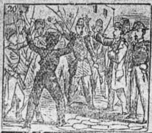
De Estrasburgo alza la gente y de ella se pone al frente.