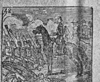
Venciendo, fija el destino del austriaco en Solferino.