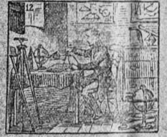
Para ingeniero estudiando va su ciencia completando.