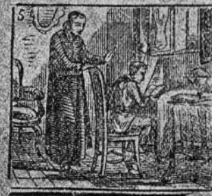
Con juca y aplicacion recibe su educacion.