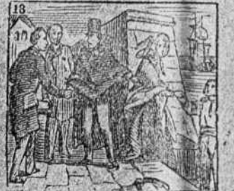
El Gobierno los destierra y salen para Inglaterra.