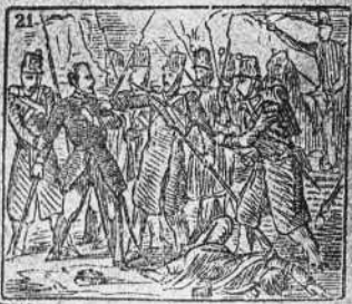
Es con su séquito entero derrotado y prisionero.