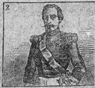
Contarte la historia quiero de Napoleón tercero.