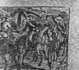
Con su contrario se ayunta en amistosa entrevista.