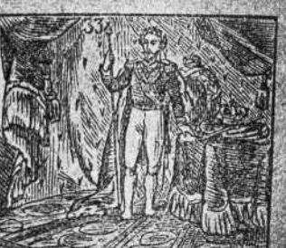
Es, por un golpe de Estado, emperador proclamado.