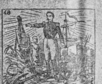
El Imperio floreció, pero su ambición le hundió.