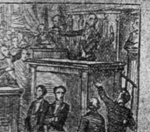
La republica a su frente le pone de presidente.