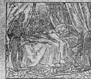
A su madre asiste atento en el último momento.