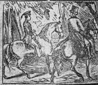
Animoso y buen jinete ser buen militar promete.