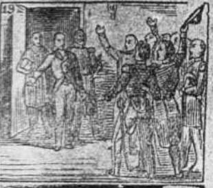
Entra con la guarnicion de Estrasburgo en coalicion.