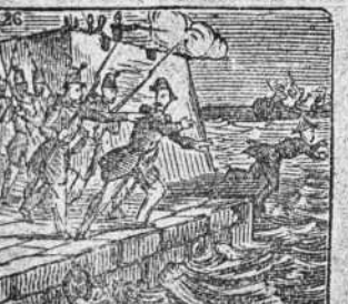
Fracasando la intentona, de nuevo el rey le aprisiona.