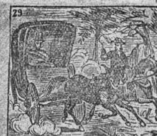
Hecha la revolucion, va a Paris sin dilacion.