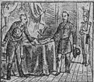
Vuelve a Francia estando ausente y entrar no se le consiente.