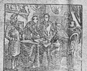
Trata en Londres con constancia nueva invasion a Francia.