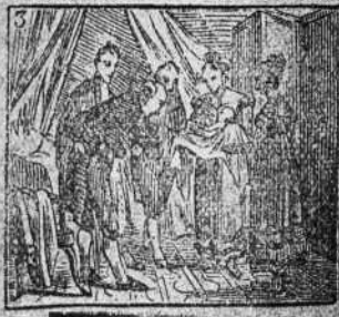
Debe a la Francia sus dias naciendo en las Tullerias.