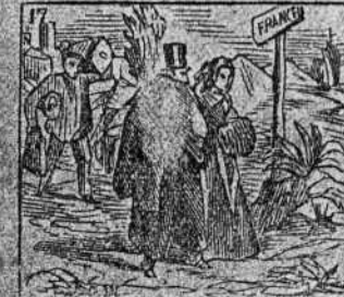
Hijo y madre disfrazados logran verse en Francia entrados.