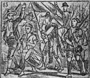
Subleva los aldeanos de los estados romanos.