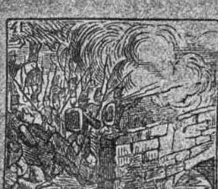
Triunfa en batalla sangrienta en el puente de Magenta.