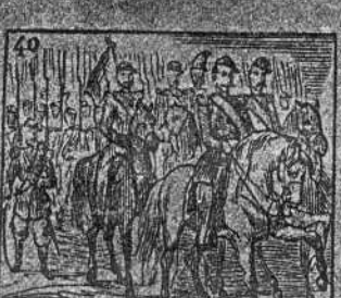
De la Italia protector marcha contra el opresor.