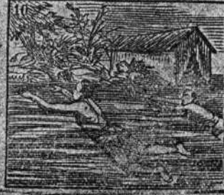
No encuentra competidor siendo diestro nadador.