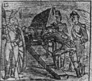
Siendo artillero entendido, es militar distinguido.