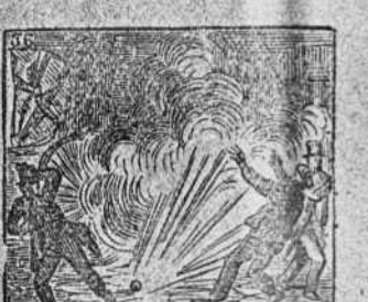
Un atrevido homicida atenta contra su vida.