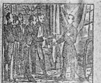
Voto de los influyentes tiene en las Constituyentes.