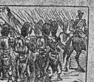
A que el ruso hundido sea va su ejército a Crimea.