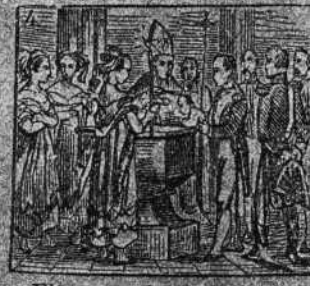
El emperador, padrino es de su ilustre sobrino.