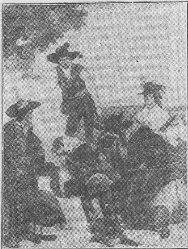
ROMERIA DE SONSOLES ((AVILA)