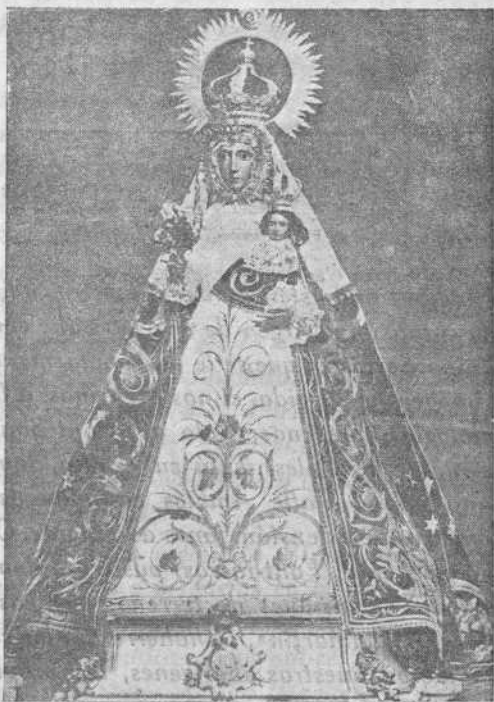
Coronación de la imagen de Nuestra Señora de Consóles