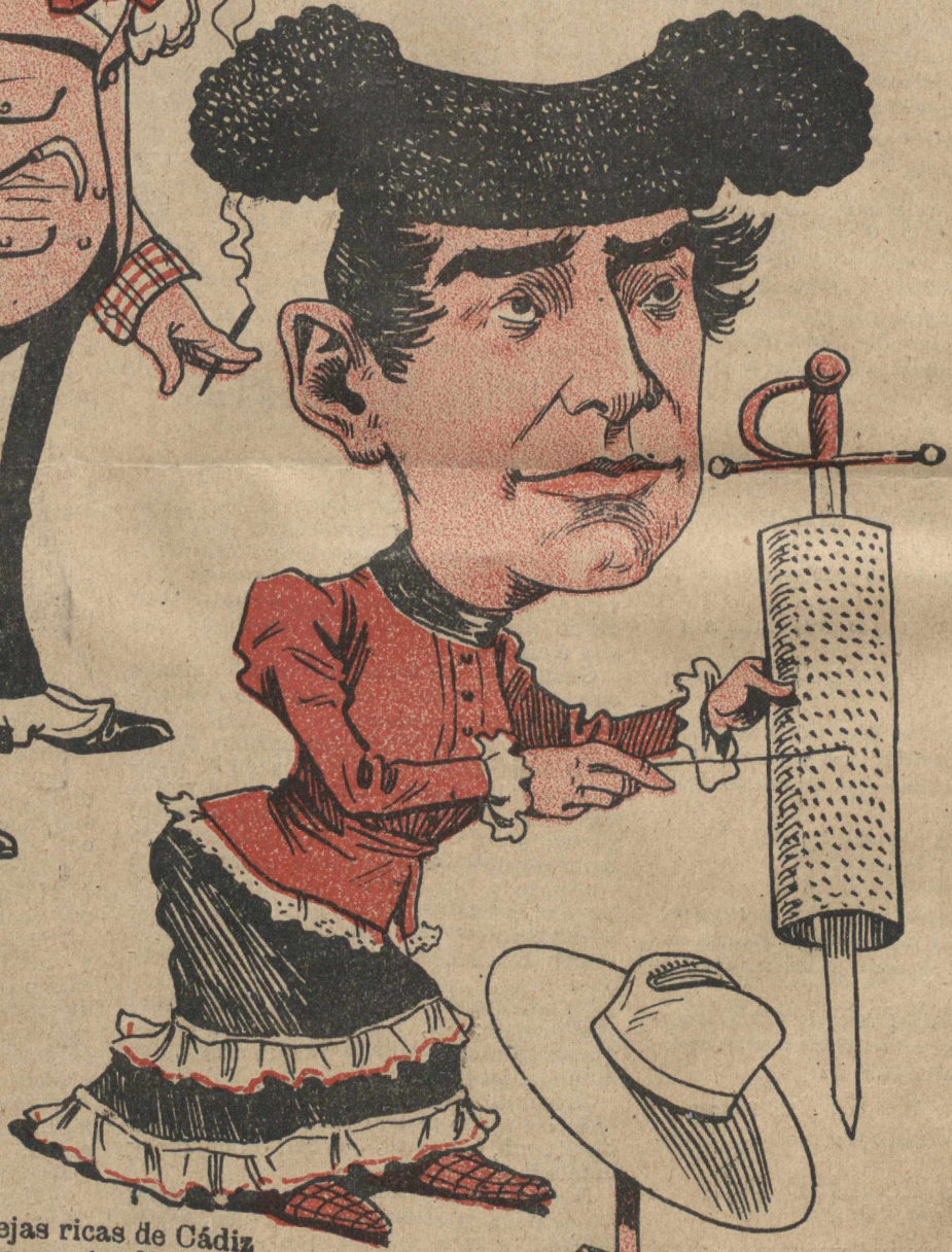
Las viejas ricas de Cádiz tien gracia por tonelás y yo tengo una asaura que pesa más de un quintal.