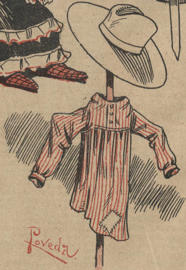
Siendo el Chico de la blusa fui una notabilidad, y ahora, miren lo que soy: ni Chico , ni... limoná.