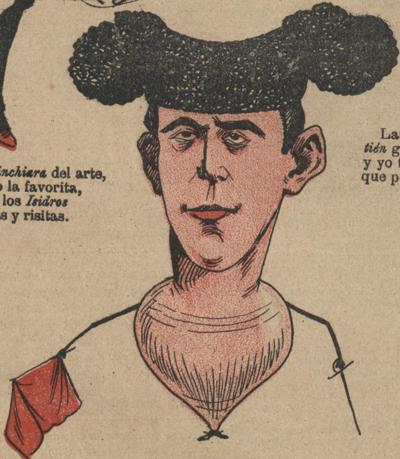
Si este peón actor fuera siempre representaría En el seno de la muerte y El loco de la guardilla .