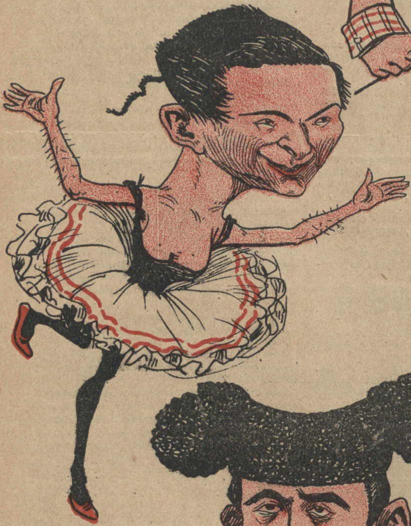
Soy la Pinchiara del arte, de Niembro la favorita, y camelo á los Isidros con piruetas y risitas.