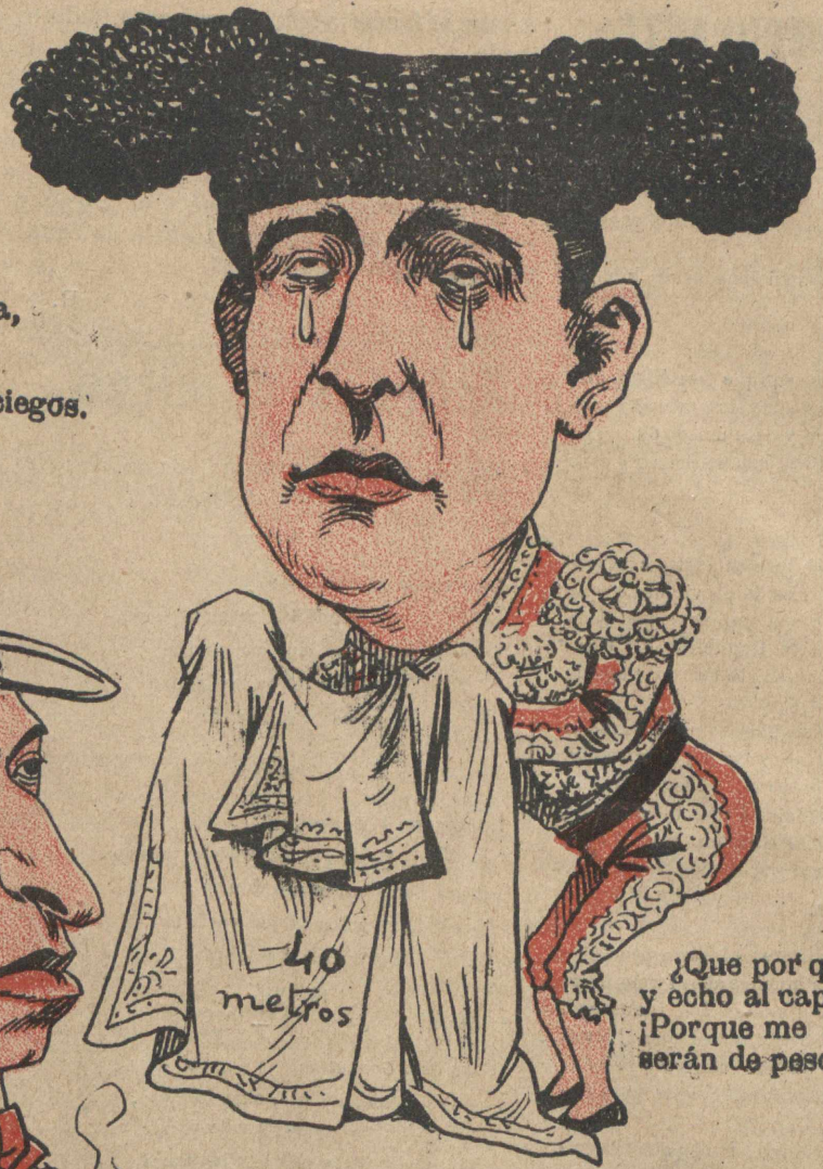
¿Que por qué arrecia mi llanto y echo al capote más tela? ¡Porque me han dicho que este año serán de peso y con leña!