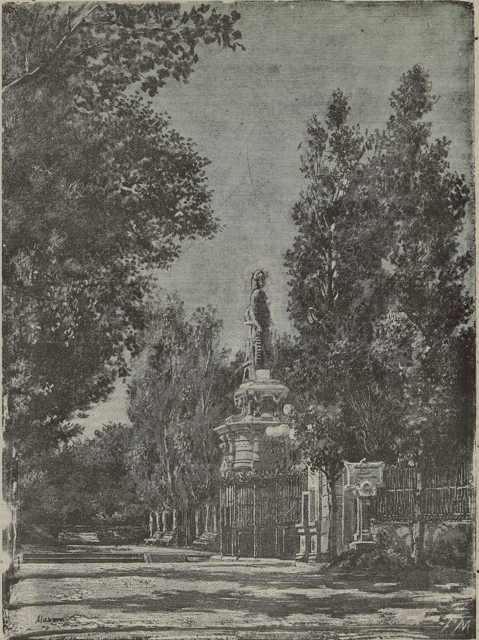
VISTA INTERIOR DE LA ENTRADA DEL PARQUE CORRESPONDIENTE AL SALON DE SAN JUAN