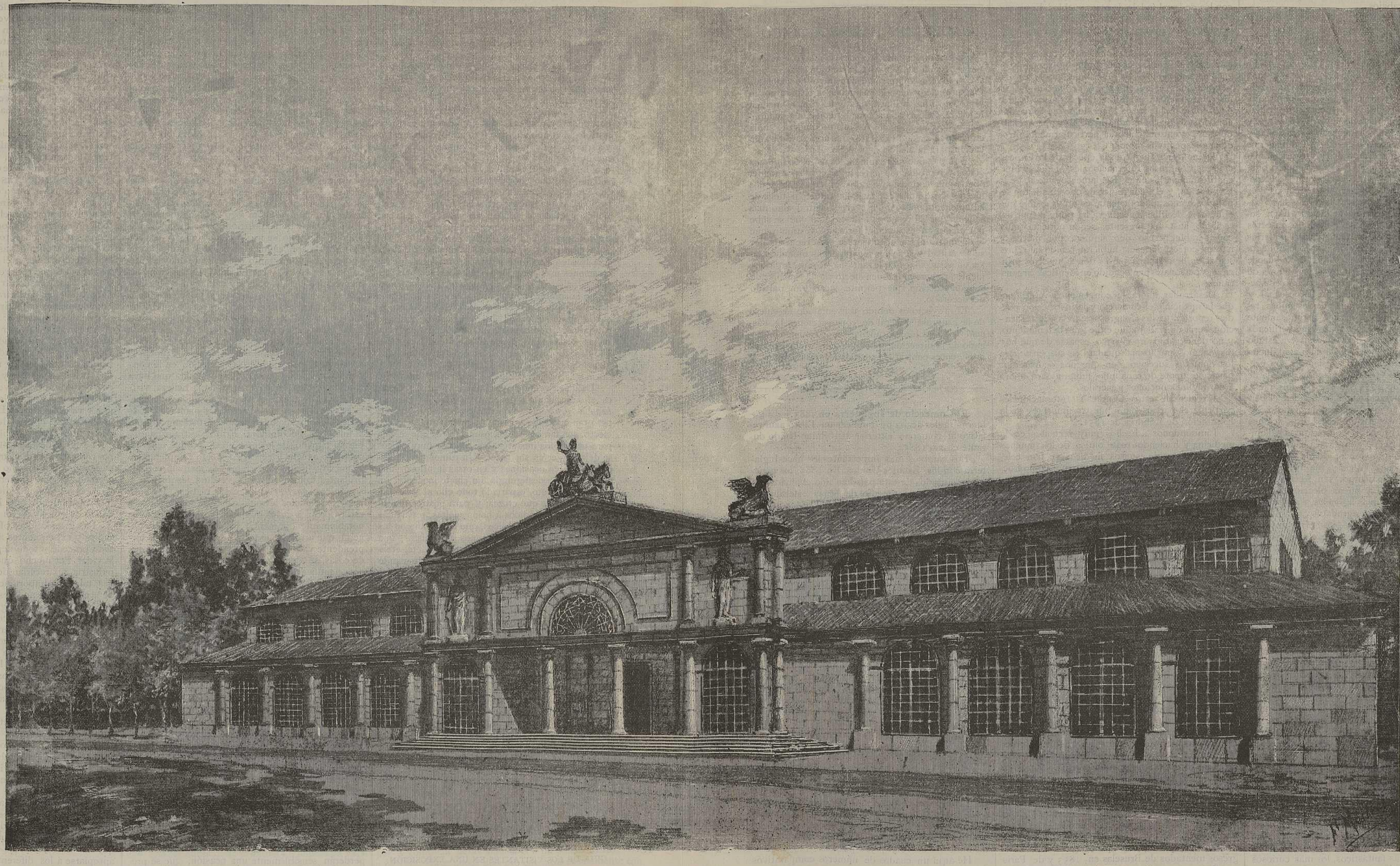
VISTA EXTERIOR DEL « PABELLON BALNEOLOGICO » DESTINADO A PRODUCTOS QUÍMICOS Y FARMACÉUTICOS