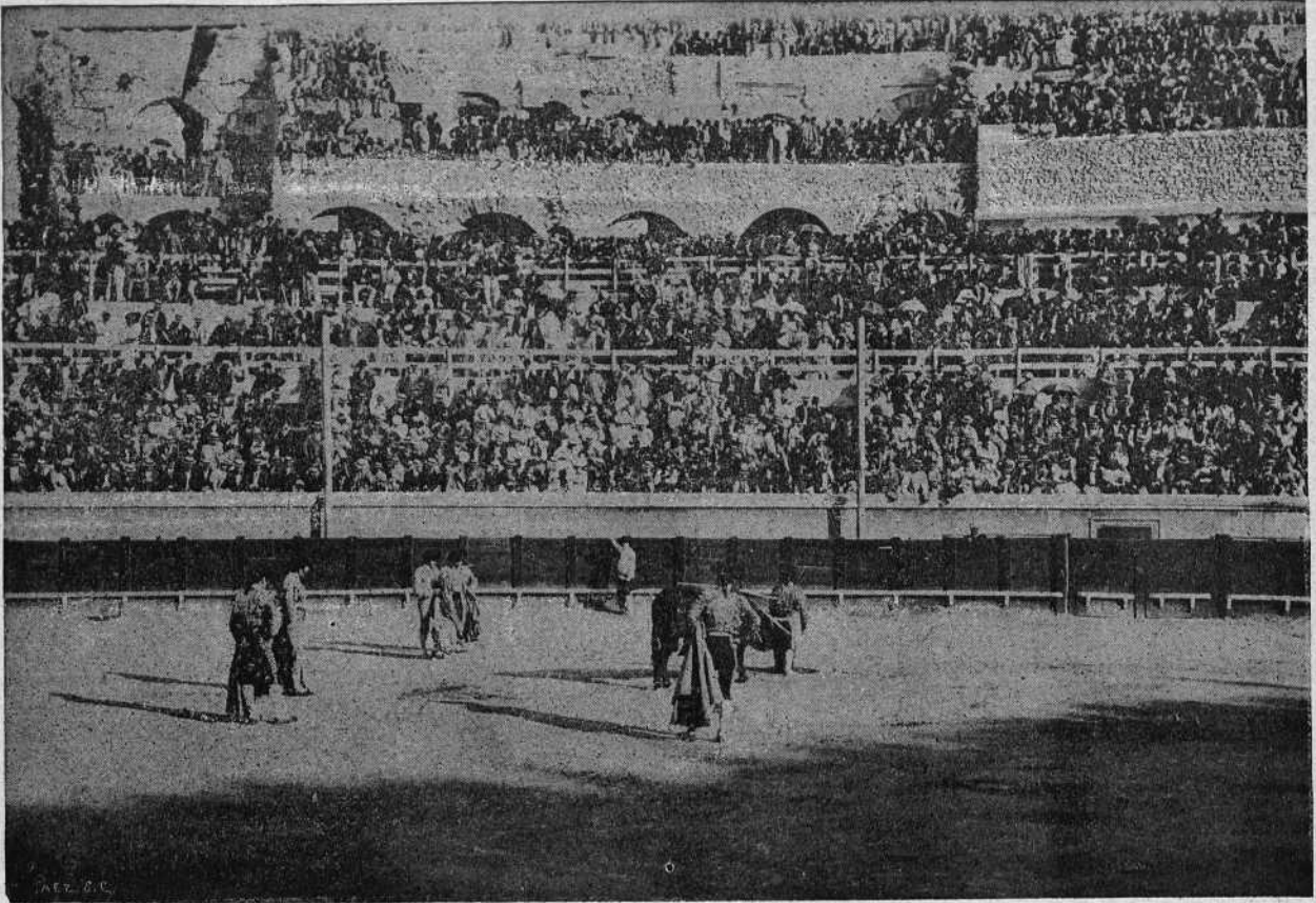
Minuto de espaldas á un toro del Duque después de una buena estocada.