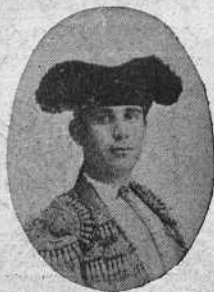
Rafael Guerra (Guerrita) 27 Septiembre 1887 Capucinos, 10, Córdoba.