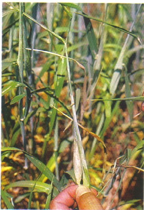
Larva y daños en la espiga.

Los daños que pueden observarse son la aparición de "espigas blancas" completamente vacías debido a la interrupción de la subida de la savia, espigas con granos destruidos por las larvas, espigas mal nutridas con granos atrofiados, y malformaciones en la espiga, al soldarse las espigas con la vaina y dificultar la salida de ésta.