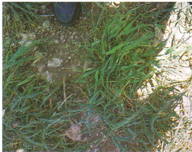
Cultivo atacado por la plaga.

La plaga pasa el invierno en estado de larva, refugiada en la corteza de los árboles. A comienzos de la primavera, las larvas salen de los capullos dejándose caer por un hilo sedoso, y son arrastradas por el viento cayendo en los cultivos de cereales próximos. Las larvas