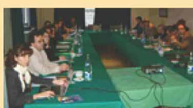
Reunión de los grupos de trabajo de profesionales.