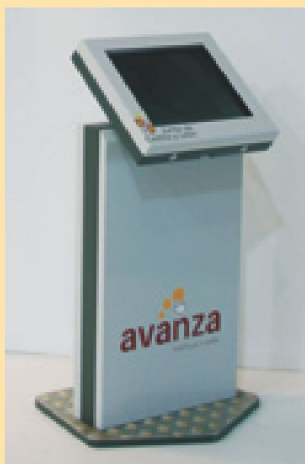
Prototipo de terminal

Con motivo de la celebración de la 71 Feria Internacional de Muestras de Valladolid, la Dirección General de Atención al Ciudadano y Modernización Administrativa ha presentado los terminales de información y gestión electrónica para su futura instalación en las Oficinas de Información y Atención al Ciudadano y en otras dependencias públicas.