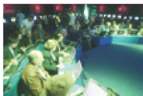
Curso de formación de mayores en la Carpa Inici@te en Zamora