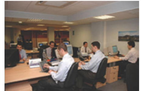
Grupo de Trabajo del Centro de Innovación en Tecnología Sanitaria (CINNTEs)

métodos de intercambio de información entre las redes asistenciales de Portugal y las de Castilla y León. Los retos a abordar se plantean a nivel de tecnologías de comunicación y de formatos y estándares de la información.