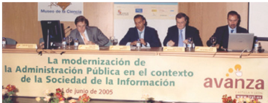
Ponentes de la segunda mesa redonda

Primera jornada del foro avanza con casi doscientos participantes