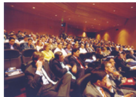
Vista del público asistente

El objetivo fundamental del foro avanza es crear en nuestra Administración un espacio para el debate e intercambio de experiencias sobre los principales avances de los procesos modernizadores de las Administraciones Públicas.