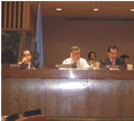
El acto de entrega del Premio se desarrolló en la sede de la ONU

El Programa de Modernización del ECYL obtiene el galardón al Mejoramiento del Servicio Público