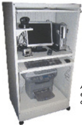
Armario con la estación de trabajo de Telemedicina.

El objetivo básico de estos proyectos es proporcionar ámbitos de Telemedicina en nuestra Comunidad y con las regiones Norte y Centro de Portugal, respectivamente. A través de la Telemedicina se pretende dar soporte sanitario a las personas que por distintas circunstancias hayan cruzado la frontera y precisen de asistencia médica en los ámbitos del proyecto.