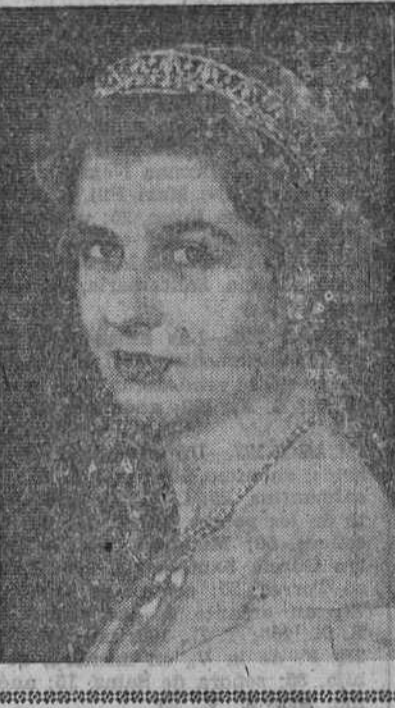
DE MI BALCON DE PARIS

TARJETAS DE VISITA, CARTAS TIMBRADAS, SALUDAS, INVITACIONES, etc. Haga sus encargos en Talleres Gráficos "DIARIO DE BURGOS"