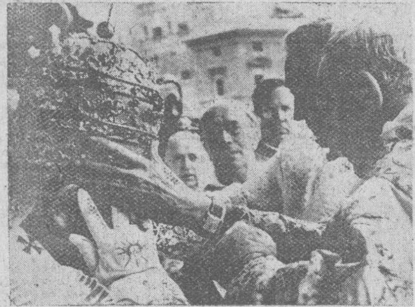
El Cardenal Canali, ayudado por Monseñor Dante colocando en la cabeza de S. S. Juan XXIII la tiara pontificia adornada con triple corona de oro, en la ceremonia celebrada hace un año en el balcón de las bendiciones de la Basílica de San Pedro.

en las flotas del mar, que paradójicamente la batalla naval, al uso clásico, resulta curiosamente descartada, de momento. Pero es que el submarino no es sólo —con ser ello tanto— el arma contra el tráfico. Es, también, el arma del ataque al continente, tanto como a los barcos. Los submarinos, en efecto, están viendo vaciar sus entrañas de baterías de tubos de lanzar, para instalar, en su lugar,