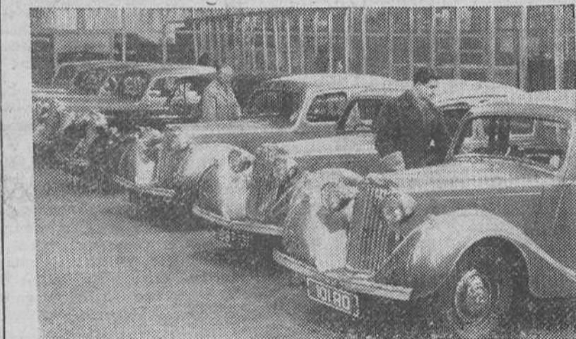
Una colección de siete coches "Sulbeam-Talbot" procedentes de los talleres de la "Rootes", dispuestos para ser enviados al mercado.