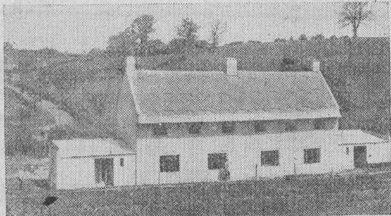
He aquí una de las casas para obreros ingleses edificadas en Bath, condado de Wiltshire.