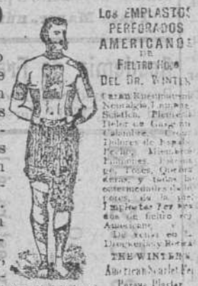
Los EEMPLASTOS PERFORADOS AMERICANOS DEL FIELTRO ROJO DEL DR. WINTER

Los EEMPLASTOS perforados americanos de fieltro rojo del Dr. WINTER, infunden una saludable corriente eléctrica por todo el sistema, é instantáneamente mitigan los dolores, tranquilizan los nervios, fortalecen los órganos digestivos debilitados y devuelven á los enfermos la salud sin ninguna fé y á menudo á pesar de los temores y las preocupaciones. Estos Emplastos son especialmente útiles para fortalecer los delicados músculos dorsales de las señoras en sus períodos mensuales. Todas las escuelas de Medicina los recomiendan y usan para las curas de las afecciones neurálgicas, reumatismos, debilidades causadas por indiscreciones anticipadas, esfuerzos indebidos ó enfermedades de los riñones, pleuresias, calambres, punzadas en la espalda, dolores en el pecho que se extienden á los homoplatos y finalmente para todas las enfermedades que resultan de interrupciones en la circulación.