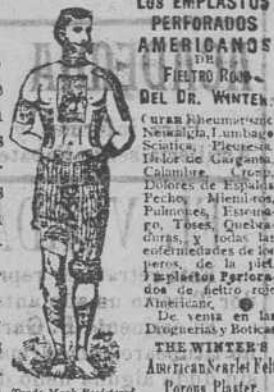
Los EEMPLASTOS PERFORADOS AMERICANOS DEL FIELTRO ROJO DEL DR. WINTER. Curan Rheumatismo, Neuralgia, Lumbago, Sciática, Migraña, Dolores de Cabeza, Colicuras, etc. Fechos: Alemania, Prusia, Francia, España, etc. De venta en las Droguerías y Boticas Americanas de España. Poros Plaster, 17 Boulevard, N.Y. U.S.A.

Los EEMPLASTOS perforados americanos de fieltro rojo del Dr. WINTER, infunden una saludable corriente eléctrica por todo el sistema, é instantáneamente mitigan los dolores, tranquilizan los nervios, fortalecen los órganos digestivos debilitados y devuelven á los enfermos la salud sin ninguna fé y á menudo á pesar de los temores y las preocupaciones. Estos Emplastos son especialmente útiles para fortalecer los delicados músculos dorsales de las señoras en sus periodos mensuales. Todas las escuelas de Medicina los recomiendan y usan para las curas de las afecciones neurálgicas, reumatismos, debilidades causadas por indiscreciones anticipadas esfuerzos indebidos ó enfermedades de los riñones, pleurías, calambres, punzadas en la espalda, dolores en el pecho que se extienden á los homoplátos y finalmente para todas las enfermedades que resultan de interrupciones en la circulación.