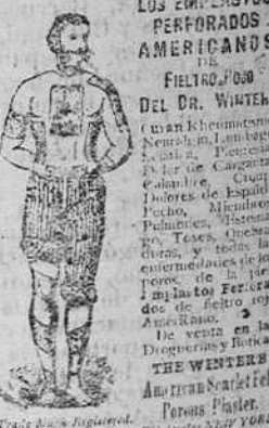
Los Emplastos Perforados Americanos de FielTRO ROJO del Dr. Winter.

En Burgos, en las principales farmacias y droguerías.