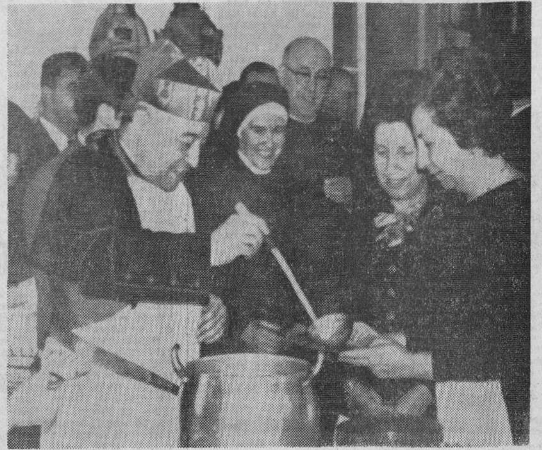
Sevilla. — El Cardenal Bueno Monreal, con un delantal blanco, distribuye la comida que señoras sevillanas sirvieron a los ancianos del Asilo de San José, de la Fundación Carrere