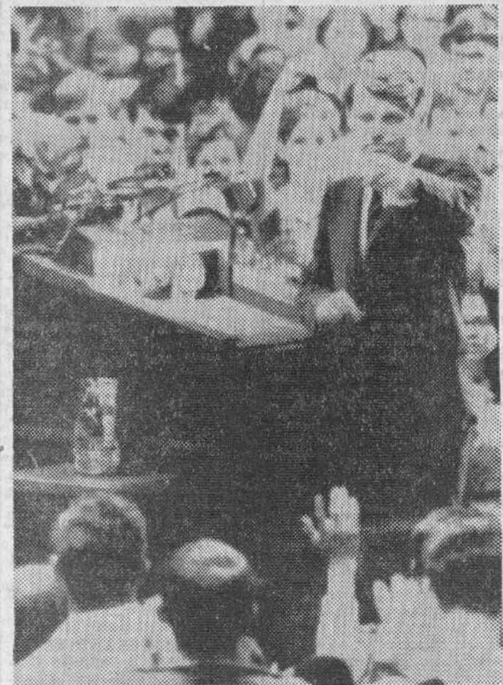
Laurence (Kansas). — El senador Robert Kennedy puntualiza un tema a un estudiante durante el coloquio que siguió a un discurso de Kennedy en la Universidad.