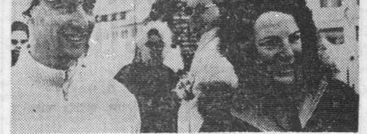
La familia real holandesa está pasando unas vacaciones invernales en Lech (Austria). En esta fotografía vemos al Príncipe Carlos Hugo de Borbón y a su esposa la Princesa Irene