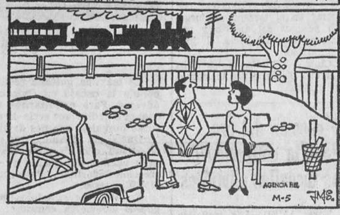
Estos dos dibujos son aparentemente iguales. Siete diferencias los separan. Si es usted buen observador debe descubrirlos antes de cinco minutos.