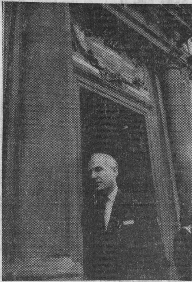
Mr. John Beith, subsecretario del Foreign Office, abandona el Ministerio de Asuntos Exteriores de España tras mantener conversaciones con funcionarios del mismo.

"Los civiles de la Colonia han adquirido la certeza de que el viento de la prosperidad económica y comercial sopla ya desde el otro lado de la frontera".