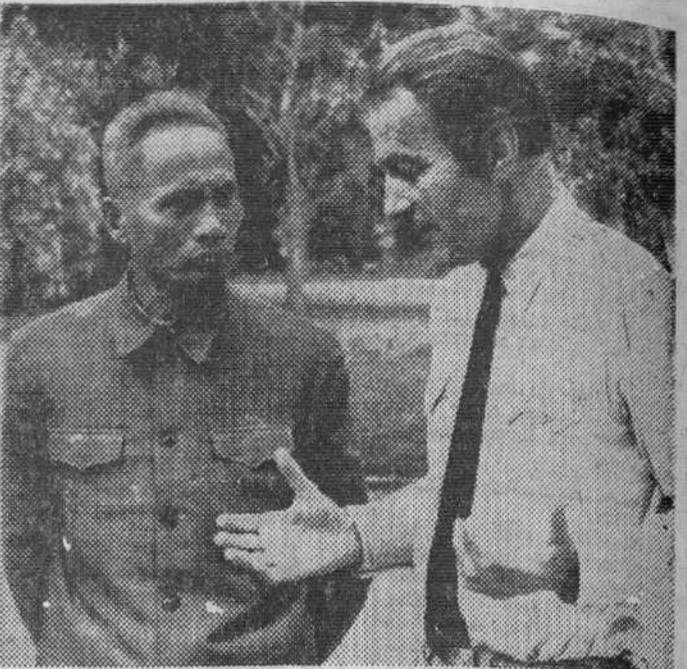
El autor de este reportaje, François Chalais, durante su entrevista con Pham Van Dong, primer ministro del Vietnam del Norte.