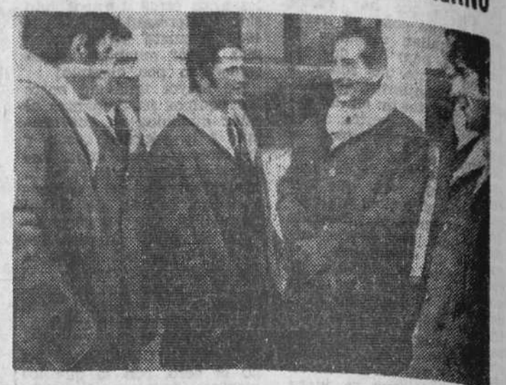
Grenoble. — Componentes del equipo español que participa en los Juegos Olímpicos de Invierno con el presidente de la Federación Española de Esquí, señor Baranda, fusionados con una participación en la prueba de descenso.