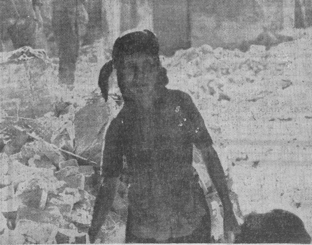
«Abandonó Hanoi y la guerra se aleja. El drama queda allí. Las bombas continúan cayendo, destruyendo, matando». Esta vieja mujer sobre los escombros de lo que fue su casa en Hanoi resume en una sola imagen la tragedia de un pueblo.

La dispersión, por el contrario, corresponde a un plan estudiado para el porvenir. Los vietnamitas piensan que, una vez que vuelva la paz, será preciso luchar contra los problemas por los cuales sucumben, generalmente, los países dichosos: la infancia delincuente, el infierno de los universos obreros, la dislocación y la disgregación de las familias, provocada por la superpoblación. Este es el motivo de que, desde ahora, hayan decidido que ninguna de sus ciudades podrá contar con más de trescientos mil habitantes, a excepción de Hanoi, que podrá tener el medio millón.