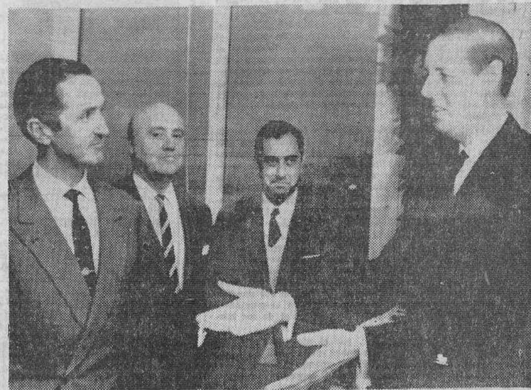
Bruselas. — El ministro español de Industria, don Gregorio López Bravo, que se encuentra en viaje para la extensión de conversaciones comerciales, es recibido por el ministro belga de Turismo, Jean Piers. Al fondo, a la izquierda, el embajador español, don Jaime Alba. — (Telefoto UPI-CIFRA)