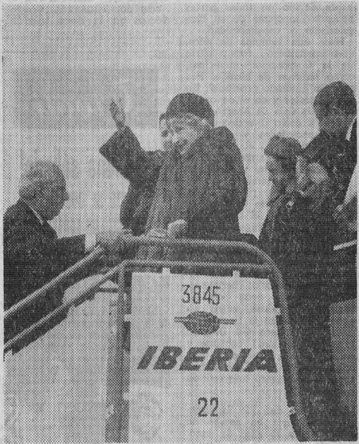
Madrid. — Ha llegado al aeropuerto de Barajas, procedente de Niza la Reina Victoria Eugenia para asistir al bautizo de su biznieto, el Príncipe Felipe. En la foto, la Reina saluda desde la escalera del avión, respondiendo a las aclamaciones de la multitud que acudió a recibirla.

Una nota simpática y humana (Pasa a quinta página)