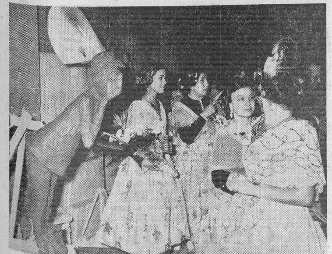
Valencia. — Un grupo de periodistas españoles y extranjeros han visitado los talleres falleros donde se realizan los famosos grupos de la «plantá». Estuvieron acompañados por la fallera mayor y las primeras autoridades provinciales y locales.