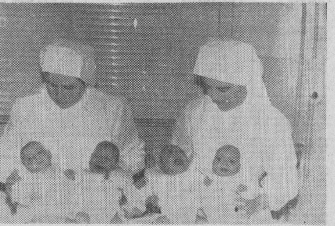
En el hogar infantil en que ahora se hallan, las cuatrillizas toledanas, con su lenguaje de urgencia a base de lloriqueos y monerías, reclaman unas atenciones que, por otra parte, cuantos les rodean están siempre dispuestos a dispensarles de muy buena gana.

¿Qué tal van de peso? —Immejorable! De un kilo trescientos gramos que dieron al nacer, en tres meses se han colocado en tres kilos ochocientos gramos. Hay que tener en cuenta que se trata de niñas prematuras.