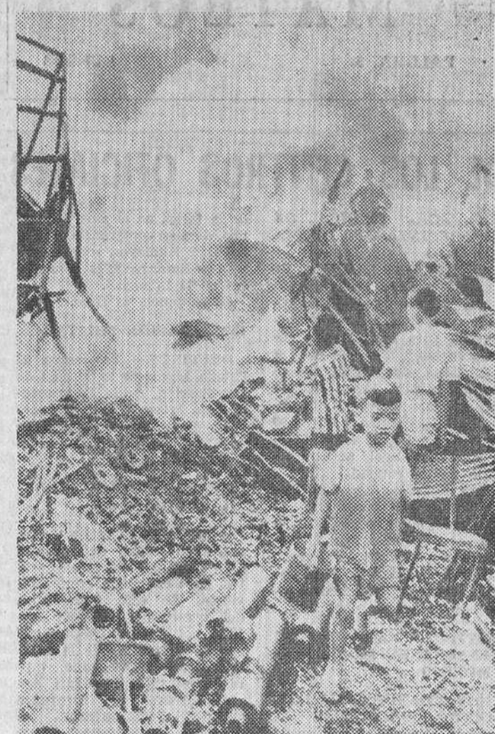
Saigón. — Estos niños colaboran en los trabajos para extinguir el incendio producido en el comercio de su padre en el sector de Chalon, a causa de los violentos combates entablados entre las guerrillas comunistas y las tropas vietnamitas y norteamericanas. Cuatro grandes bloques de viviendas de Chinatown quedaron envueltos en llamas durante dichos combates

Los comunistas han batido esta mañana la base próxima de Khe Sanh con un récord de 550 descargas de mortero y cohetes, dijo el portavoz, lo que es reflejo de la creciente presión ejercida contra los defensores de la posición. El mando aliado teme que sea esto la preparación de una gran ofensiva roja en caminata a la captura de las provincias septentrionales survietnamitas. Khe Sanh domina