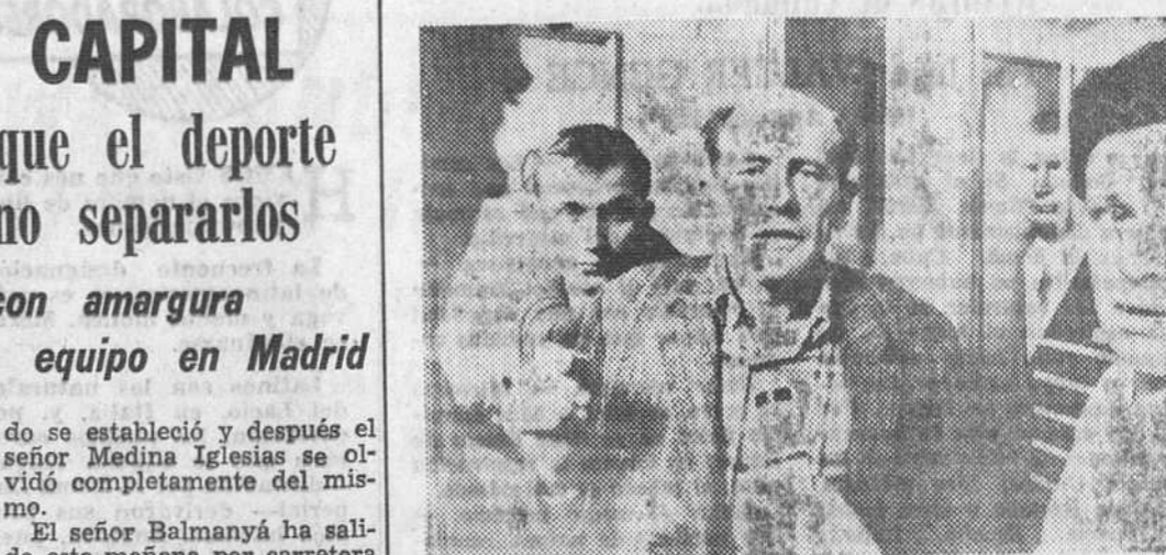
Praga. — El que fue fabuloso campeón olímpico y recordman mundial de fondo atlético, Emil Zatopek, es entrevistado por los corresponsales extranjeros sobre sus «aventuras» durante la ocupación soviética en Praga. — (Telefoto UPI Cifra)