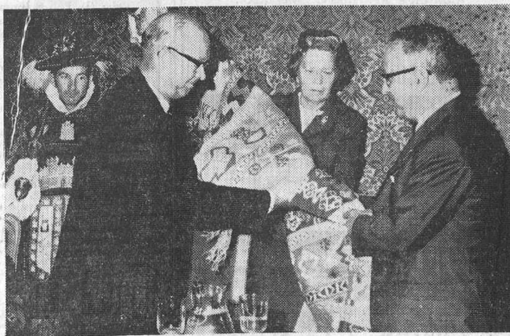
La Diputación ofreció a mediodía de ayer una solemne recepción a la misión noruega llegada a Burgos en la noche del miércoles. — Al finalizar el acto, de que damos cuenta en sexta página, el alcalde de Tonsberg ofreció al presidente de la Corporación provincial un precioso tapiz, como testimonio de hermandad entre ambos pueblos, momento que recoge la precedente placa de «Fede».