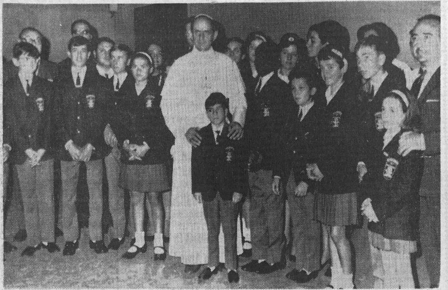
Roma. — He aquí el grupo de dieciséis niños de distintos puntos de Europa, participantes de la «Operación Plus Ultra» de este año, con el Papa Pablo VI, en su residencia de verano. — (Telefoto UPI CIFRA)