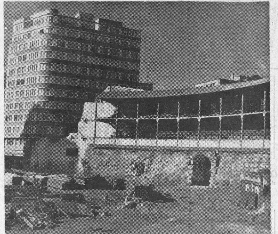
Está concluyéndose actualmente el derribo total de la plaza de toros de La Coruña, situada en el centro de la ciudad. Al parecer se pretende edificar en su lugar y construir un gran aparcamiento de coches. Con ello los numerosos aficionados a la fiesta brava de esta región se quedan sin la posibilidad de presenciar corridas. Para sustituirla se ha levantado un coso minúsculo con elementos prefabricados en las afueras de la urbe, pero de una capacidad muy reducida y con unas condiciones inadecuadas.