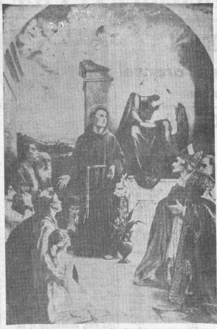
San Antonio de Padua realizando uno de sus milagros.

Los fieles de todos los países, condiciones y edades; las mujeres, sobre todo, llegan hasta allí y, apoyando sus manos en la piedra funeral, elevan sus oraciones al bienaventurado en la seguridad de que sus súplicas, acompañadas de semejantes