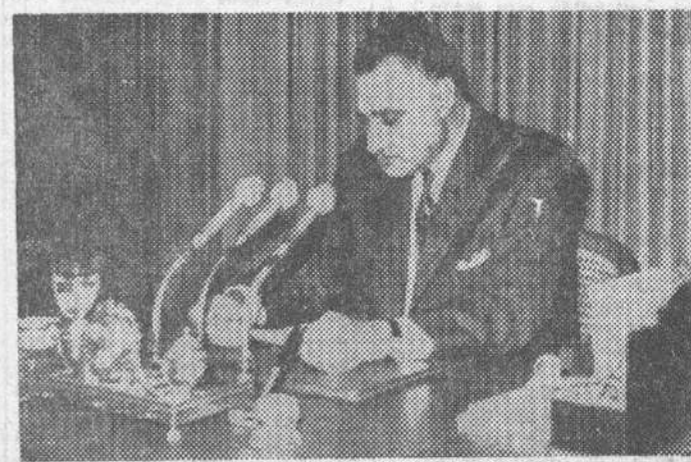
El Cairo. — El presidente de la RAU, Nasser, dirigiéndose a la nación egipcia, en su alocución televisada, ofreciendo su dimisión — que luego retiró — tras aceptar la responsabilidad por la derrota de la RAU en el conflicto bélico israelí.