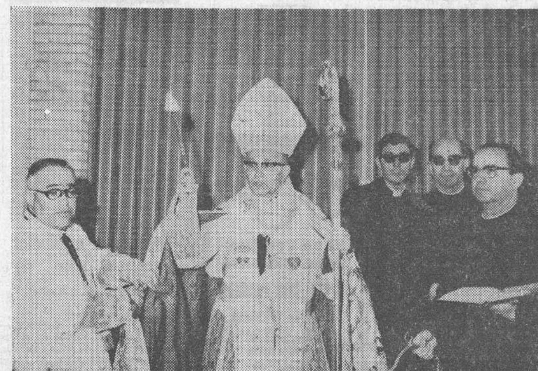
El domingo tuvo lugar en nuestra ciudad la inauguración del Colegio Menor «Santa María». En la fotografía un momento de la bendición, efectuada por el Prelado de la diócesis. (Información, en sexta página).