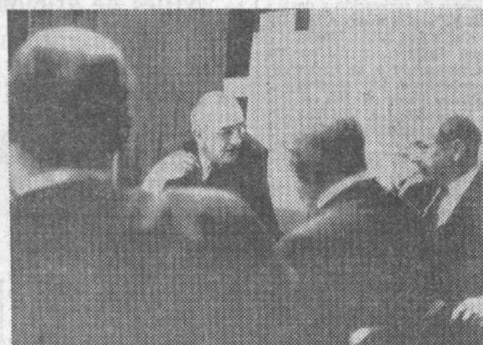
Washington. — El presidente Johnson conferencia con los altos cargos de su Gobierno en la Casa Blanca sobre la crisis de Oriente Medio. — (Telefoto UPI-CIFRA)