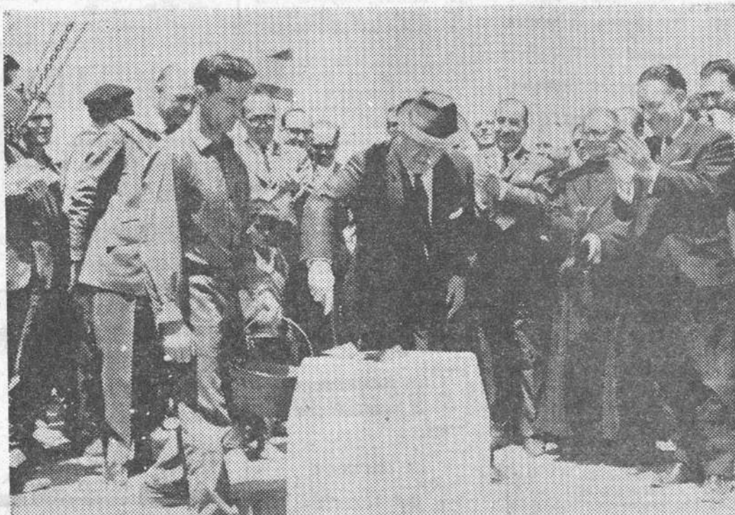
El Polígono de Villalonquejar empieza a adquirir fisonomía industrial. A una fábrica ya en avanzado período de construcción, le sucedió otra que se anuncia como importante. Trátase de «Hispanagar», cuya primera piedra fue colocada por el director general de Pesca Marítima, a quien se le ve en la fotografía de «Fede» que reproducimos. — (Información en sexta página).