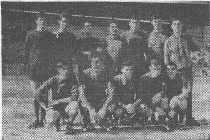
Equipo del C. D. San Juan, que con su holgada victoria del domingo en «El Plantío» sobre el Arsenal O. J. de Salamanca, se sitúa a un paso del ascenso a la Tercera División.

En el primer partido de su eliminatoria con el Arsenal O. J. E. de Salamanca venció por 6-0