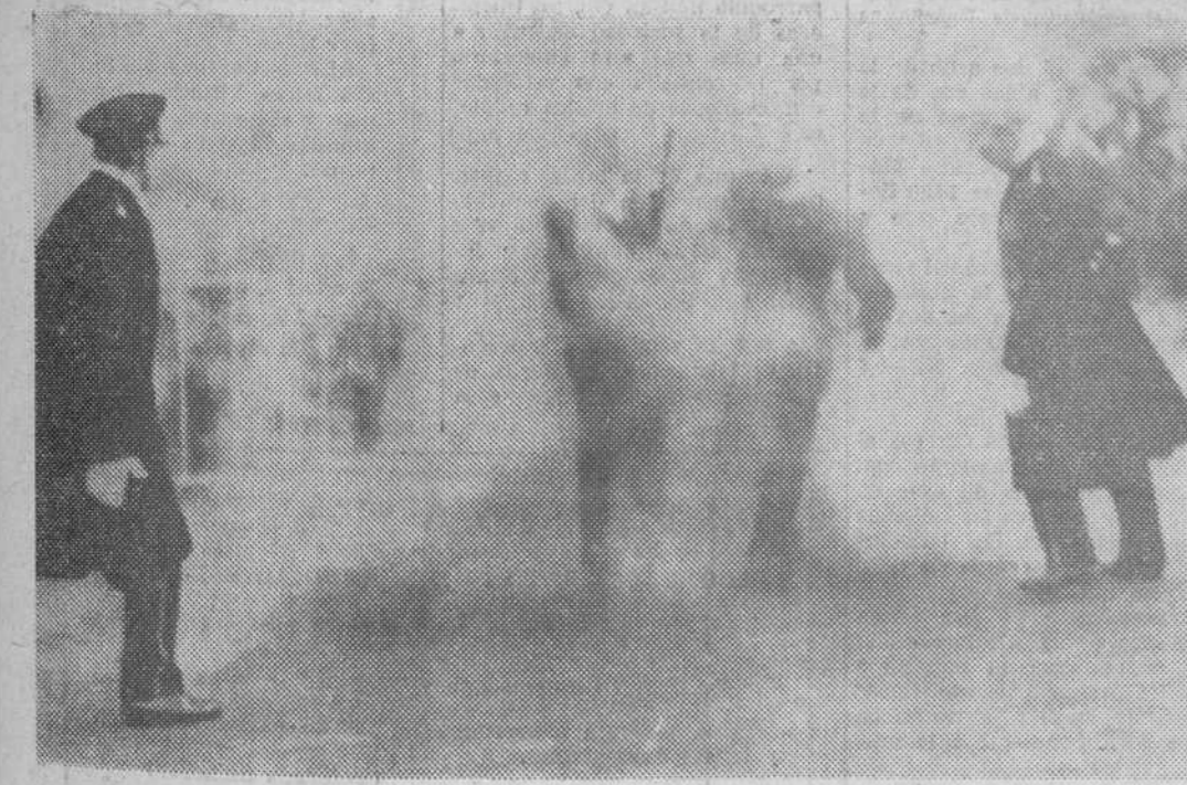
En el grabado superior, la Princesa Margarita de Holanda y su esposo, Peter Van Vollenhoven, saliendo del palacio Huis Ten Bosch, hacia el Ayuntamiento de La Haya, donde se celebró su boda civil. En el grabado inferior, un marinero presenta armas rodeado de humo procedente de una bomba lanzada por un "provo" contra el cortejo, a su paso por las calles de la capital holandesa.