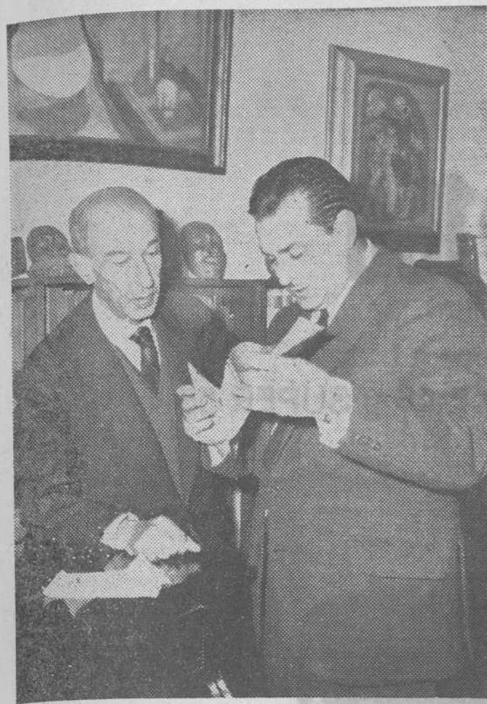
El poeta muestra al autor de este reportaje los recortes periódicos de alguno de sus trabajos literarios.

Treinta y siete títulos de poemas darán forma a la obra sublime de sus cuarenta años poéticos