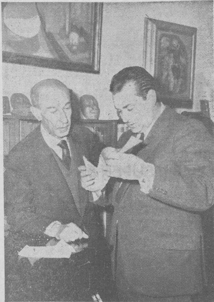
El poeta muestra al autor de este reportaje los recortes periodísticos de alguno de sus trabajos literarios.

Treinta y siete títulos de poemas darán forma a la obra sublime de sus cuarenta años poéticos