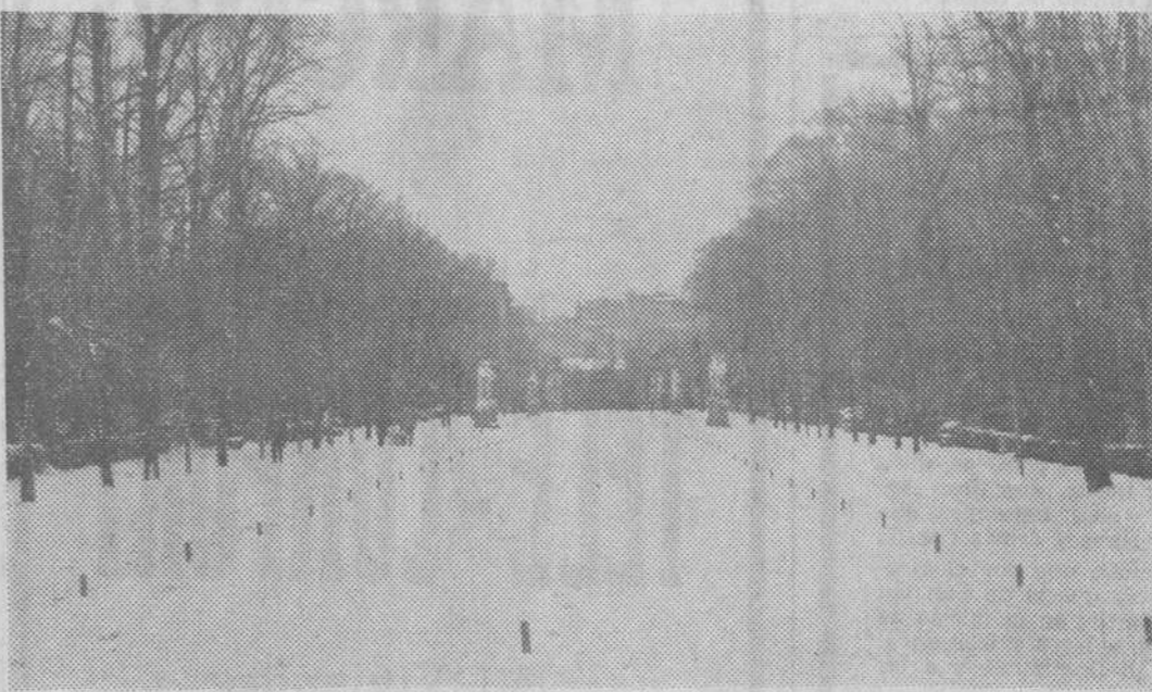
Tras varios días de intenso frío ha caído sobre Madrid una copiosa nevada. Las calles, plazas, jardines y parques de la capital de España aparecieron ante los ojos de los madrileños bajo la blanca alfombra de la nieve. En la fotografía vemos un aspecto de la nevada en el Parque del Retiro