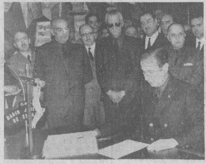
Ante el ministro secretario general del Movimiento, señor Solís y en presencia de numerosas personalidades, ha jurado su cargo el nuevo delegado nacional de Educación Física y Deportes, don Juan Antonio Samaranch. En la fotografía le vemos precisamente en el momento de prestar su juramento.