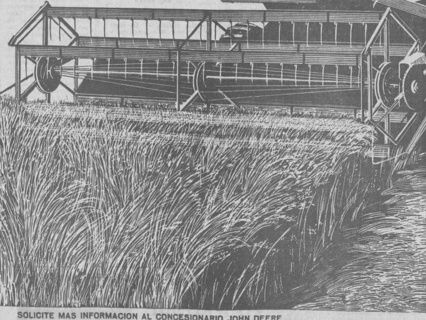
SOLICITE MAS INFORMACION AL CONCESIONARIO JOHN DEERE

PUBLICIDAD Y MARKETING J. FERNANDEZ S. A.