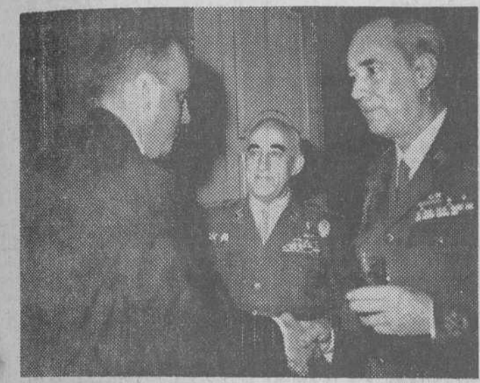
El ministro del Ejército, teniente general don Camilo Menéndez Tolosa, ha impuesto condecoraciones a diversas personalidades, con motivo de la Pascua militar. En la foto, el señor Menéndez Tolosa es saludado por el ministro de Información y Turismo, que fue uno de los condecorados.