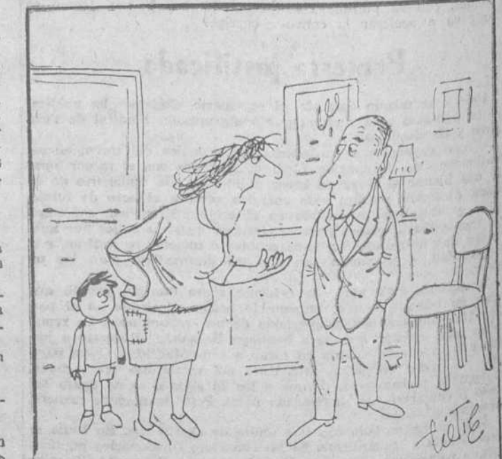
—Bueno! ¿Se puede saber qué has hecho con los seiscientos dólares que me corresponden de la renta nacional?

NOTICIAS BREVES La Asociación española contra el cáncer atiende anualmente a catorce mil personas. —Sol y viento. —Segunda petición de concesión de un depósito franco en Madrid.