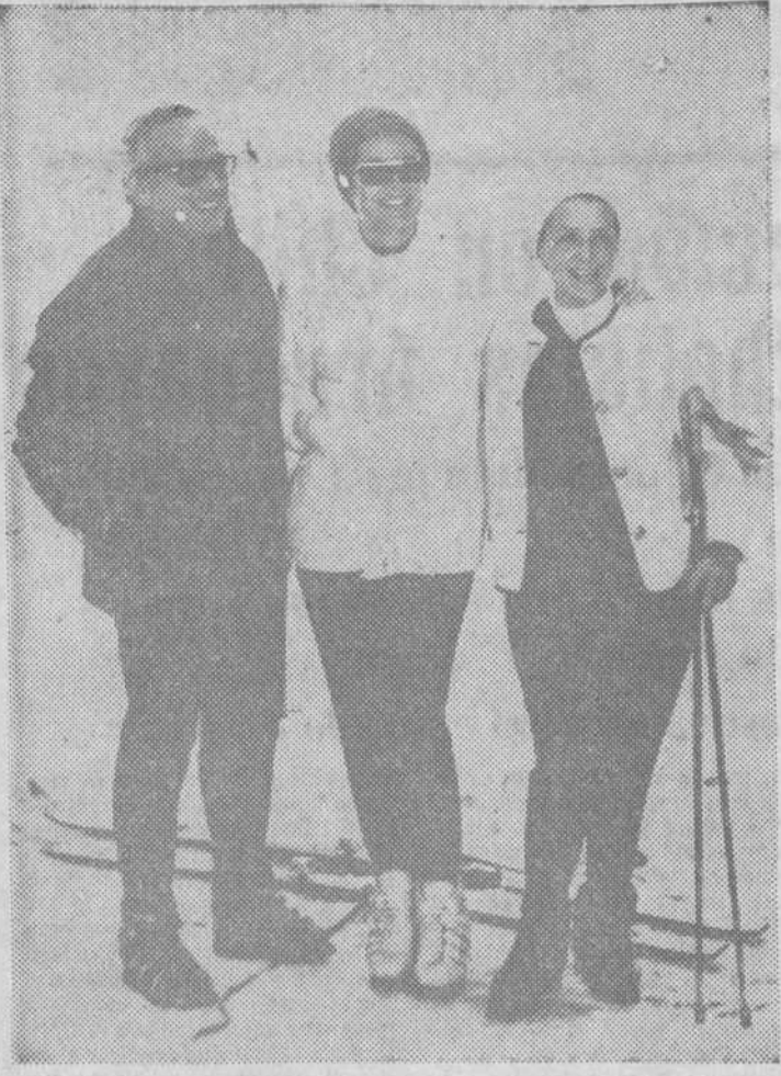
El Príncipe Rainiero de Mónaco y su esposa, la Princesa Grace, se encuentran en Schoeried (Suiza) pasando sus vacaciones invernales.