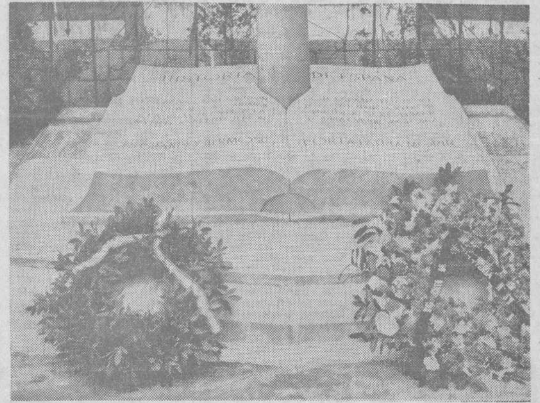
La Coruña. — Se ha celebrado con gran solemnidad el acto conmemorativo del XXVIII aniversario del hundimiento del «Castillo de Olite». En la fotografía, un aspecto del monumento, en el que fueron depositadas varias coronas de flores por los supervivientes.