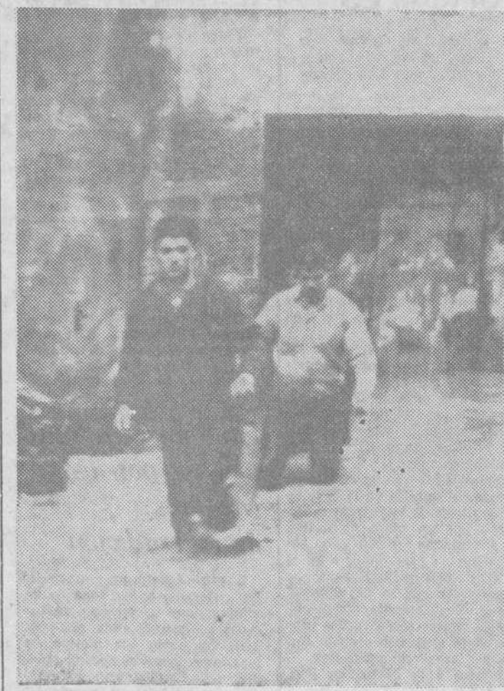
Vigo. — Aspecto de la calle de Santander, en la ciudad viguesa, durante las inundaciones sufridas el pasado día ocho.