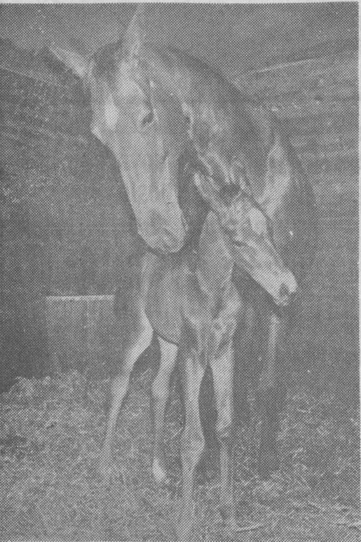
Darmstadt (Impresiones de Alemania). — Tiene hoy 21 años y resultó triunfadora en 125 pruebas de la clase «S», entre ellas 60 veces en concursos hípicas internacionales. Ha tenido cinco hijos «Halle», «Hatto», «Halme», «Haakon» y «Haladine», que podrán heredar las facultades hípicas de su madre. Aquí vemos a «Halla» con su hija más joven.