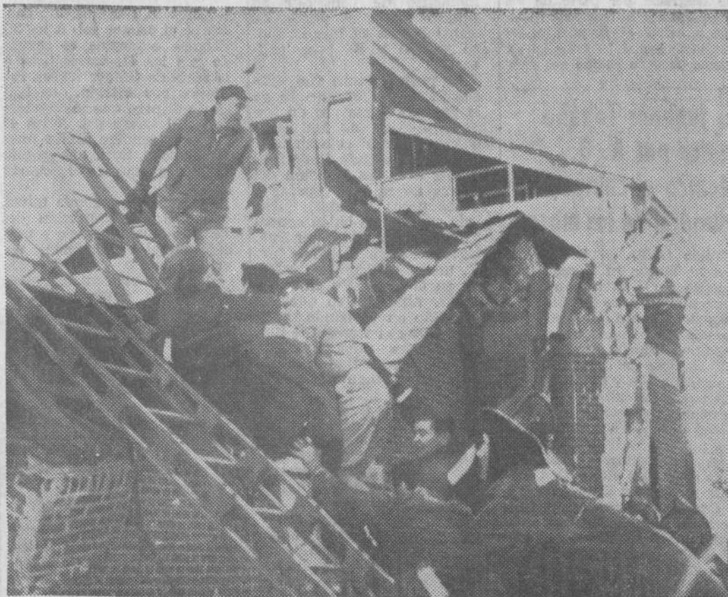
Baltimore. — Los bomberos ayudan al rescate de las víctimas del hundimiento del techo en el templo de Santa Rosa de Lima, que cayó sobre más de cien personas.