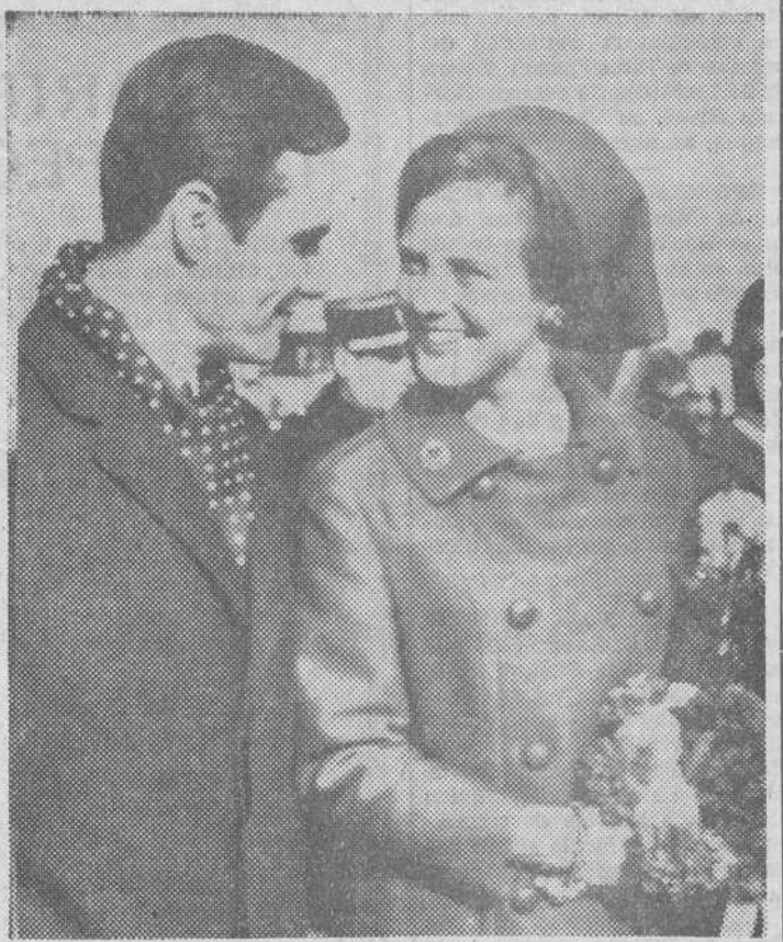
París. — La Princesa Margarita de Dinamarca ha aprovechado el «Día de San Valentín» para reunirse con su prometido, el conde de Monpezat, con el que aparece en la foto a su llegada al aeropuerto de Bourget. La razón oficial del encuentro es la de que la Princesa asistirá a la inauguración del nuevo edificio de la Embajada de Dinamarca en París.