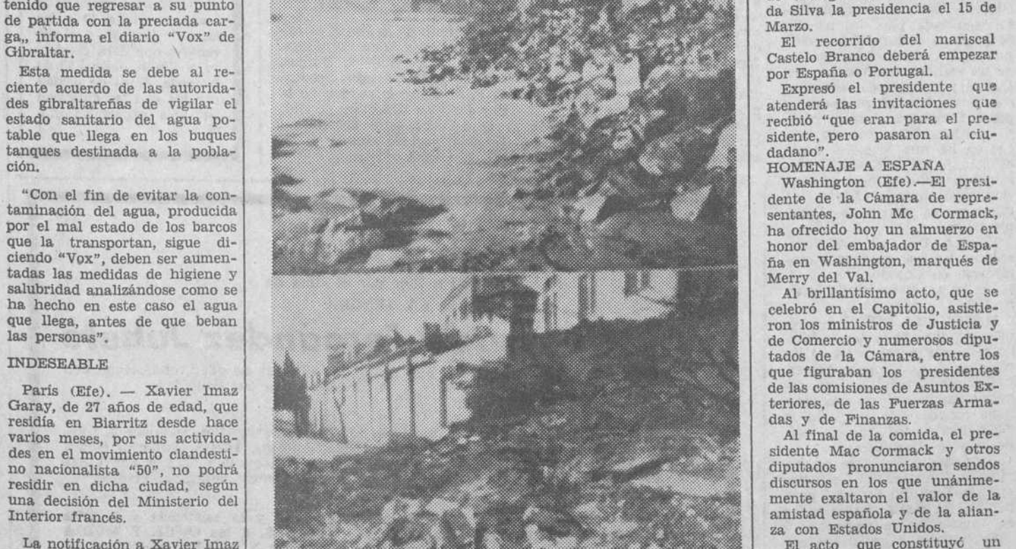
Blanes. — Se han producido inundaciones debido a la fuerte tromba de agua caída en esta zona. En la composición gráfica (en la parte superior) el muro de la playa totalmente destruido y en la parte inferior, el Hospital de San Jaime, cuyo muro quedó destruido igualmente.