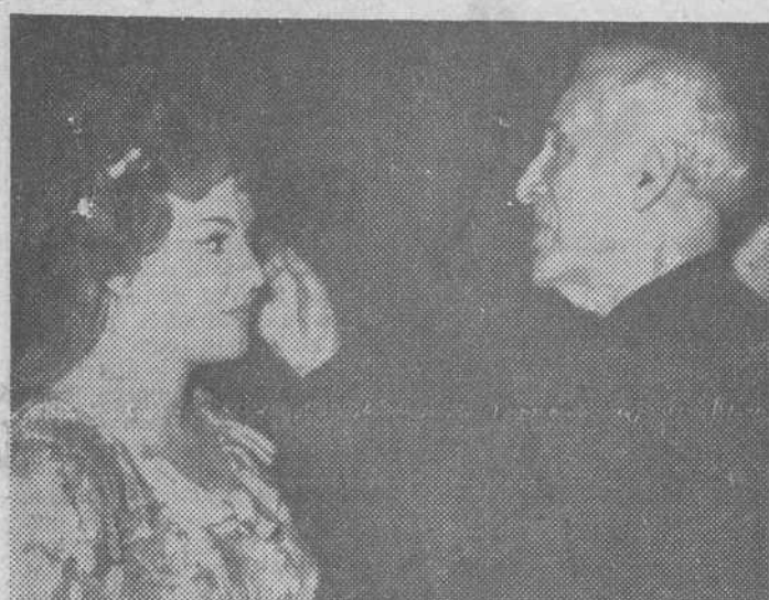
Nueva York. — El mundialmente famoso artista Marc Chacall, que ha diseñado los decorados y vestuario de la nueva producción del Metropolitan Opera «La flauta mágica», de Mozart, durante un ensayo da unas instrucciones a la soprano Pilar Lorengar.