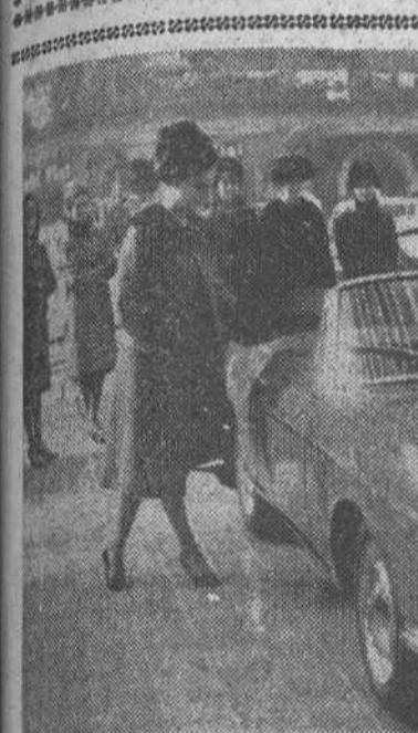
La Feria del Automóvil en Turín

Moscú. — Astrónomos rusos han recogido señales de radio, procedentes de Venus, en una longitud de onda de tres centímetros.