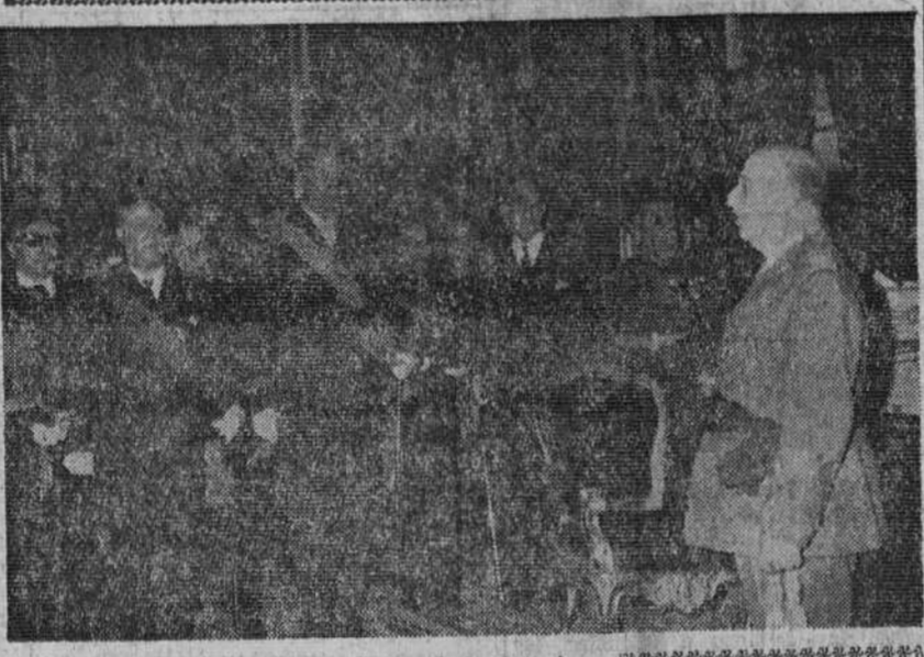
Audiencia de S. E. el Jefe del Estado

Derrota de la moción contra el Gobierno francés