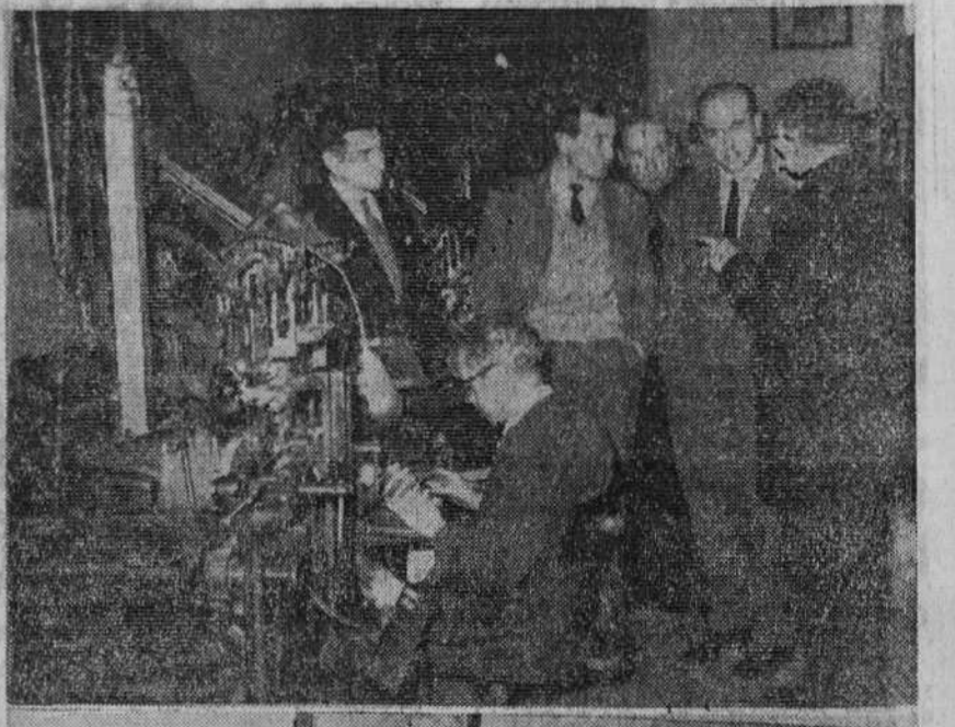
A última hora de la noche de ayer, el gobernador civil y jefe provincial del Movimiento, don José Utrera Molina nos hizo el honor de efectuar una visita a DIARIO DE BURGOS.

Durante largo rato departió con el cuerpo de Redacción, saludando asimismo a todo el personal de nuestros talleres