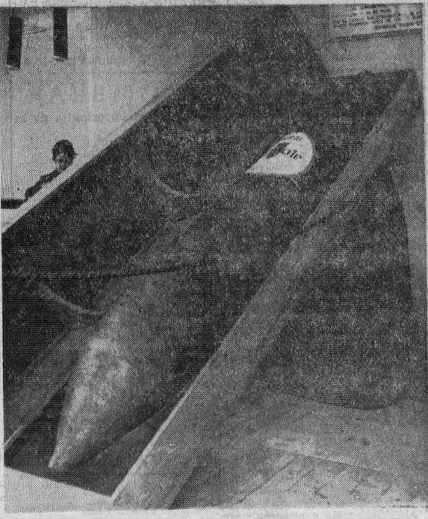
El puro más grande del mundo