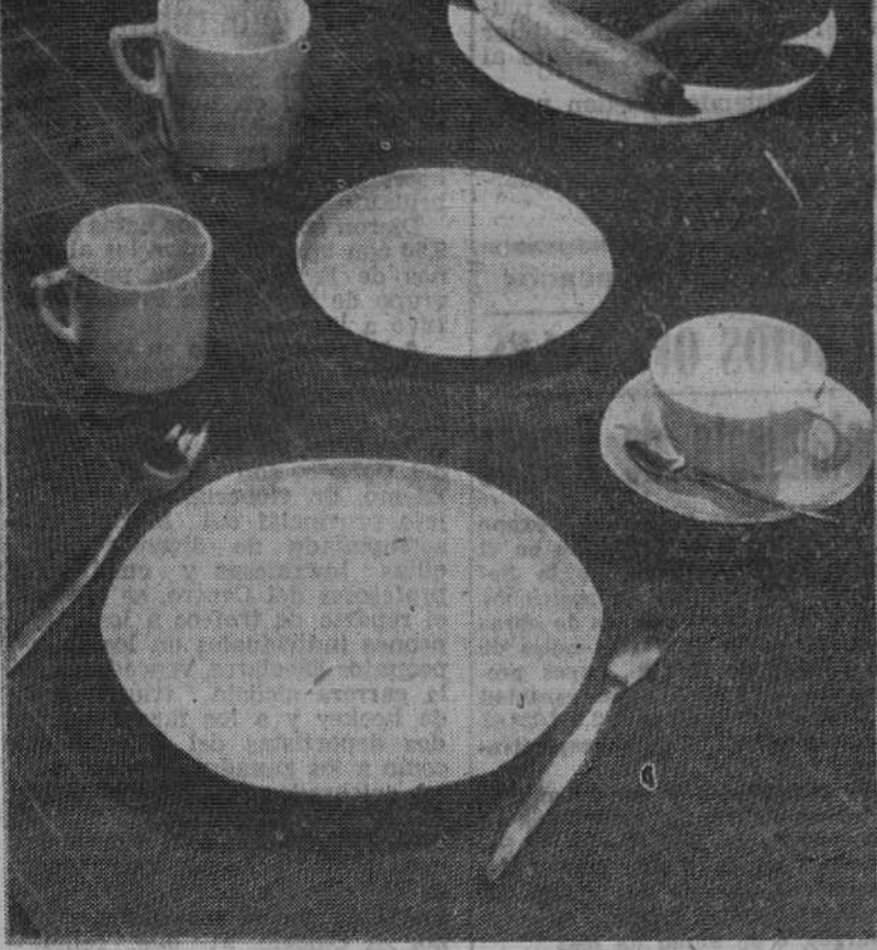
Reproducción de algo especial en plásticos; una "Fiesta" de melamina, grupo de servicio de mesa proyectado por Ronald E. Brookes P. L. S. A. Estos artículos se adaptan a las nuevas normas para la melamina roscadas por un Comité Técnico de Gran Bretaña. El servicio de mesa puede suministrarse en blanco, negro, amarillo lima, morado y tonalidades de azul y verde oliva. Es de gran duración y resistente a las roturas y a las manchas.

mera exposición de su clase y alcance en el mundo. Destinada a influir en los fabricantes británicos y en los compradores y vendedores nacionales y extranjeros, fue visitada por más de cuatro millones de personas, hasta finales del año pasado. Los premios del Centro del Diseño han constituido un acontecimiento anual desde 1957. Cada año se nombra un jurado independiente para seleccionar un máximo de 20 productos de destacado diseño, de los 2.000 que aproximadamente se muestran en el Centro durante el año anterior. El Duque de Edimburgo entrega certificados cada mes de Mayo a los fabricantes de los artículos premiados. En 1959 instituyó además un premio anual con su nombre, para el Diseño más Elegante, y desde entonces ha sido presidente de su propio comité de selección para elegir un diseño único que se distinga por su elegancia. El premio, en este caso, se entrega al diseñador del producto premiado.