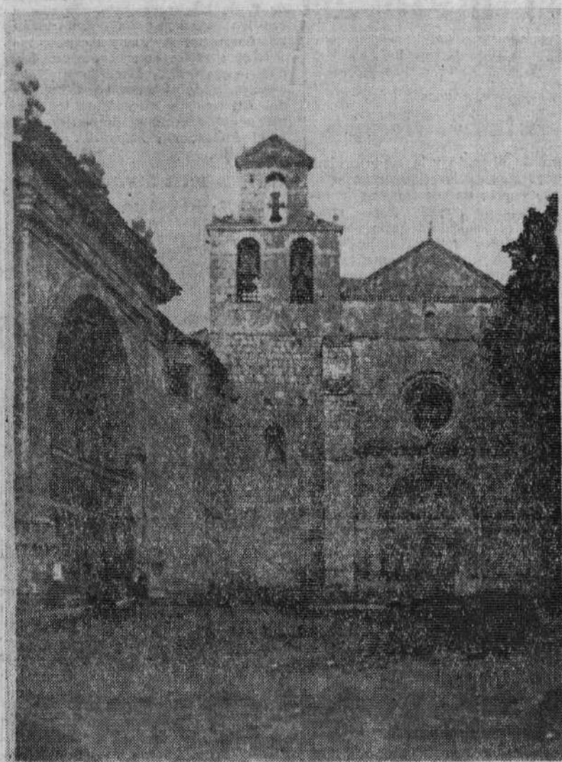
Iglesia del Monasterio y capilla (a la izquierda) donde se encuentra el sepulcro del Santo.

Por Manuel AYALA LOPEZ Canónigo Penitenciario de la S. I. C. B. M.