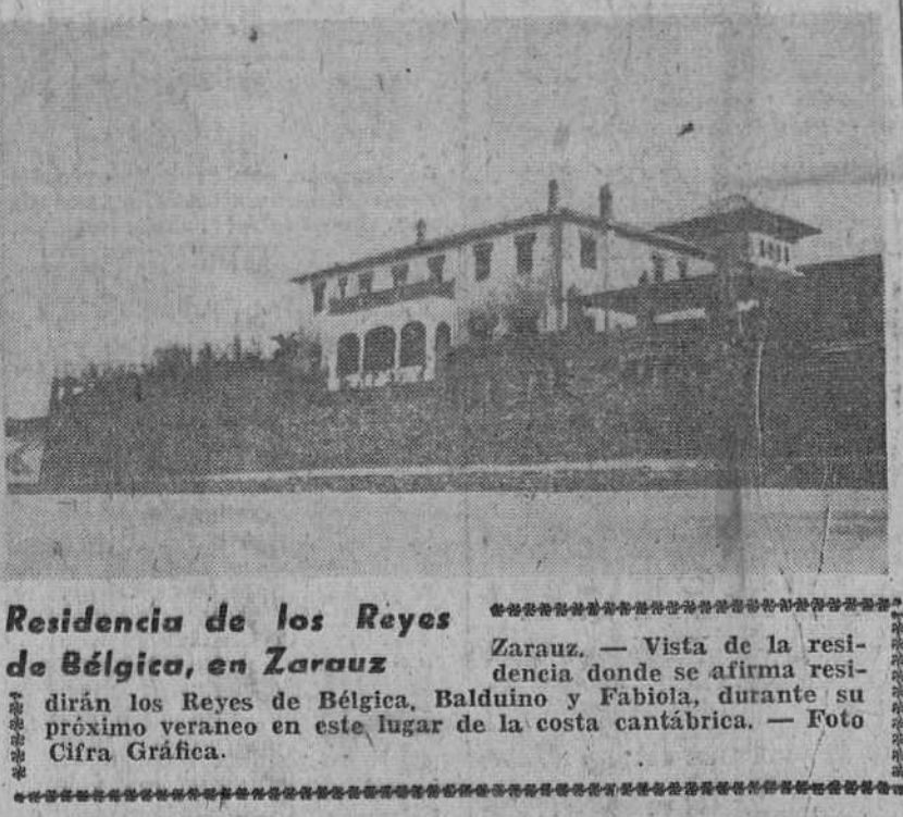
Residencia de los Reyes de Bélgica, en Zarauz. Zarauz. - Vista de la residencia donde se afirma vivirán los Reyes de Bélgica, Balduino y Fabiola, durante su próximo verano en este lugar de la costa cantábrica. - Foto Cifra Gráfica.

La Coruña. - Su Excelencia el Jefe del Estado, acompañado de su esposa, doña Carmen Polo de Franco, y de su hija, marquesa de Villaverde, llegó al Pazo de Meirás, su residencia de verano, poco antes de las ocho de la noche. Le acompañaban los jefes de sus Casas civil y militar.