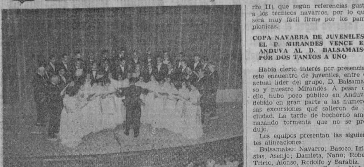
El Orfeon Mirandés, durante su brillante actuación.

BANDO El próximo martes, día 8 del actual, visitará nuestra ciudad, por primera vez el Excmo. Sr. D. José Utrera Molina, gobernador civil y jefe provincial del Movimiento, quien tiene gran interés por conocer Miranda y los más importantes problemas que afectan a la población, para con conocimiento exacto de los mismos, apoyar nuestras aspiraciones y lograr la efectiva solución de aquellos.