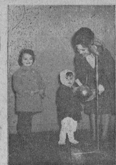
Del admirable ejemplo de caritativa solicitud que Burgos está dando en favor de los niños inválidos pobres, he aquí una estampa conmovedora: este pequeño entregando su donativo en los estudios de "Radio Popular".

Luego hablaron el alcalde de Madrid y don Rodrigo Vivar Téllez, presidente del Sindicato Nacional Textil.