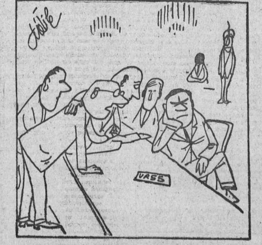
—¡A ver si podemos las cosas claras! Lo que a ustedes les gustaria es que nos desarmásemos nosotros, ¿no?