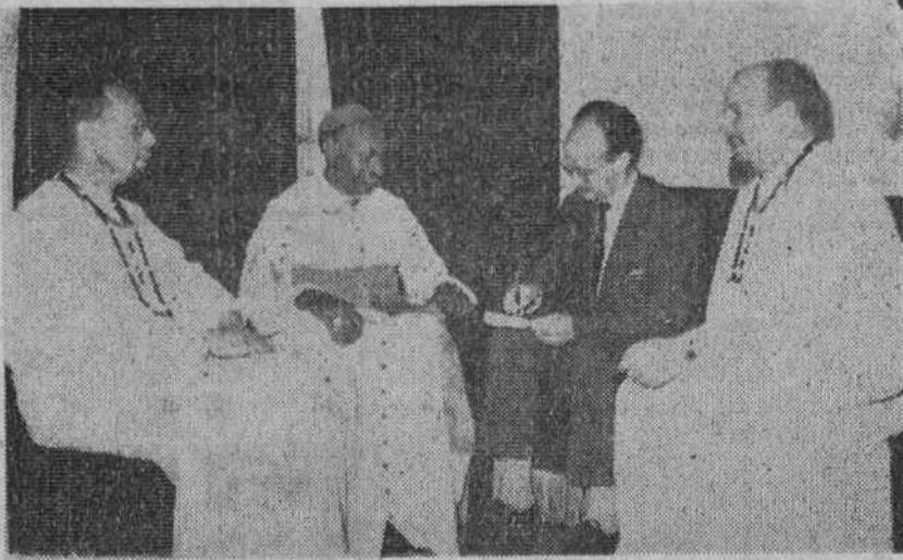
EL OBISPO AFRICANO CONVERSANDO CON NUESTRO REDACTOR «CALLE», EN PRESENCIA DE OTROS DOS PADRES BLANCOS

Fue bautizado a los diez años y consagrado obispo hace pocos meses.- Ochenta misioneros para 800.000 hombres.- Después de los sucesos del Congo, la Iglesia africana aparece más pura a la vista del pueblo.- «El Papa me levantó del suelo, exclamando: ¡Somos hermanos!»