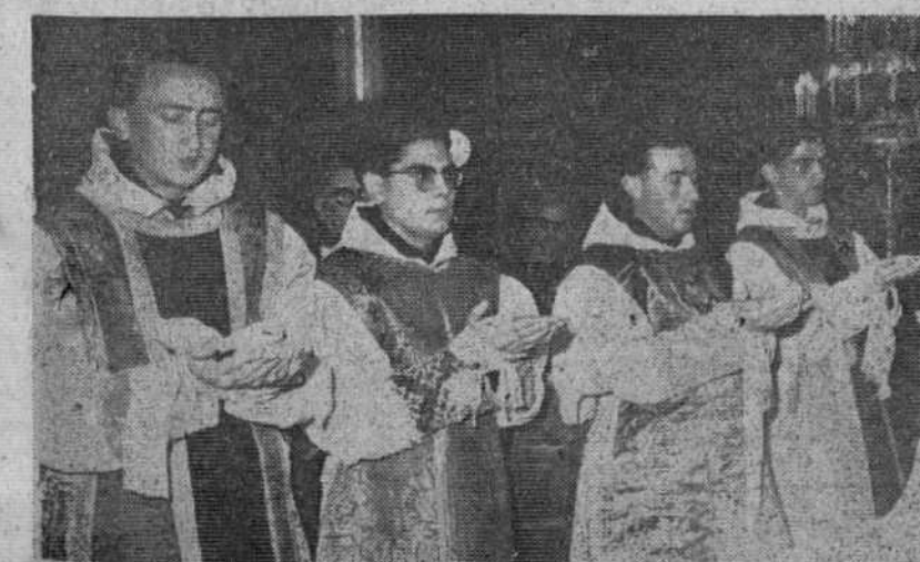
Han subido por vez primera las gradas del altar cuatro Padres Carmelitas que recibieron la ordenación sacerdotal el sábado último, de manos del obispo auxiliar de la diócesis. En nuestra foto, los misacantanos.