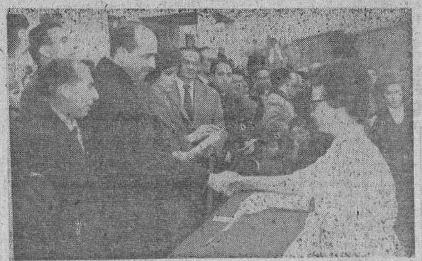
Bajo la presidencia del gobernador civil y jefe provincial del Movimiento, se efectuó ayer tarde, en Salas de los Infantes, la clausura de la Cátedra de la Sección Femenina, acto de que damos cuenta en páginas interiores. En nuestro grabado, el señor Utrera Molina, felicitando a una de las alumnas de la citada Cátedra.