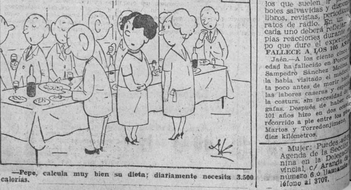
—Pepe, calcula muy bien su dieta; diariamente necesita 3.500 calorías.