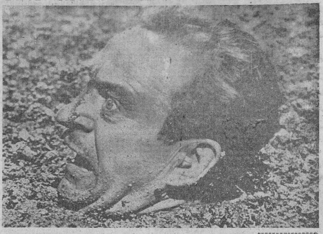
Londres. — En los estudios Elstree, David Niven se hunde dramáticamente en el barro, en compañía de Leslie Caron. Se trata de una terrible escena correspondiente a una película, cuyos exteriores han sido rodados en Milaga.