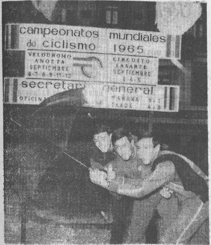
Las primeras pruebas celebradas en los Campeonatos mundiales de ciclismo que se celebran en San Sebastián han estado "pasadas" por agua. En la foto vemos a unos componentes de los equipos inglés y australiano protegiéndose, humorísticamente, de la lluvia, ante el cartel que anuncia las pruebas a celebrar.