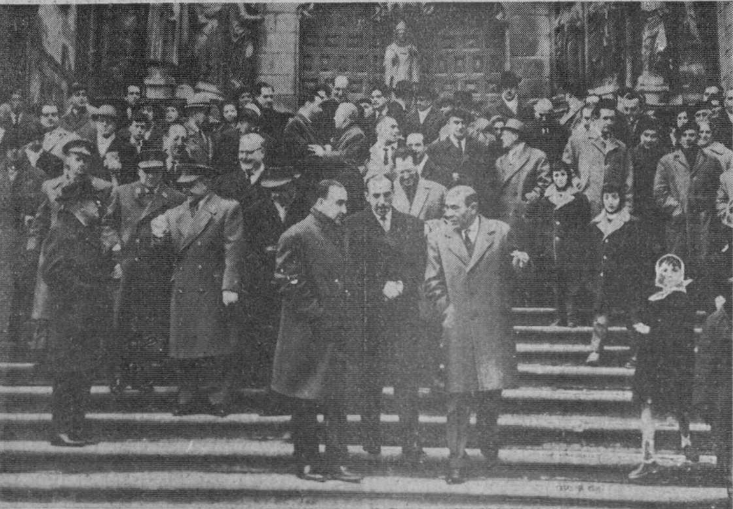
El domingo, a mediodía, se celebró en la Catedral un solemne Te Deum en acción de gracias por las recientes resoluciones del Gobierno, otorgando a nuestra ciudad un Polo de Promoción Industrial y a Aranda de Duero un Polígono de Descongestión de Madrid. — A la salida del acto, de que damos cuenta en quinta página, obtuvo Fedica la precedente placa.