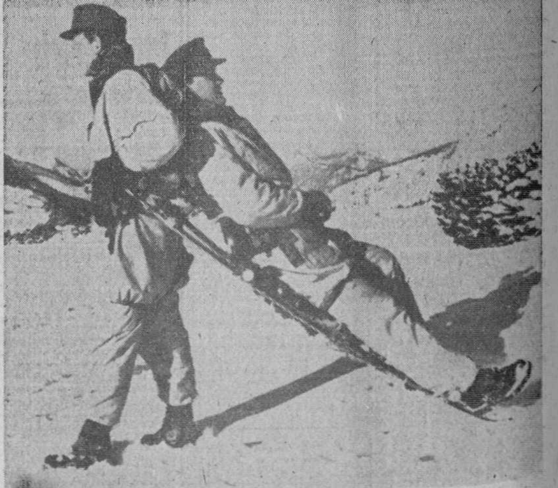
Las tropas alpinas del ejército austriaco han realizado en las montañas cubiertas de nieve unos ejercicios de rescate y transporte de heridos. En la fotografía vemos un simulacro de transporte de un herido sobre esquiés.