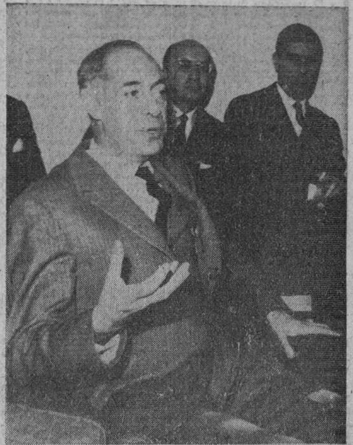
En la foto, el comisario don Laureano López Rodó durante la rueda de Prensa.