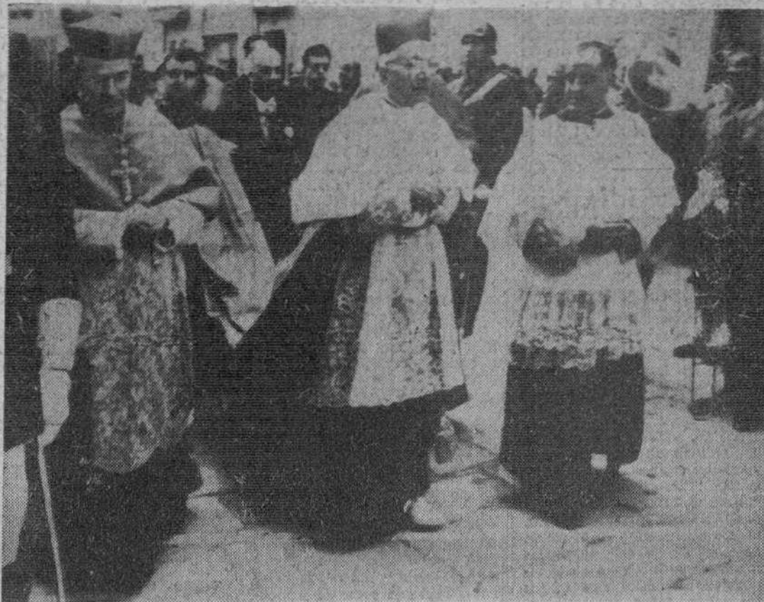
Tarragona. — Acompañado del Cardenal Arriba y Castro, a la izquierda, el Legado Pontificio de S. S. el Papa, monseñor Amleto Cicognani (centro) llega a la catedral tarragonense para officiar el pontifical de clausura del Año Jubilar Paulino.

Finalizado el solemne momento pontifical se permaneció unos minutos a la espera del radio-mensaje que había de dirigir el Santo Padre desde Roma, dedicado a los españoles, pero de un modo preferente a Tarragona. Cuando las palabras del Santo Padre empezaron a oírse, en un reposado y per-