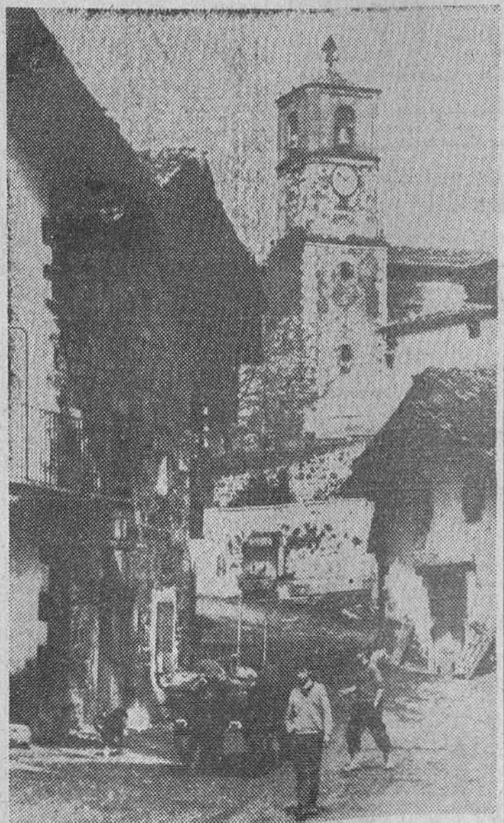
Pamplona.—El pueblo de Lizaso uno de los más pintorescos del Valle de la Urzama, va a ser puesto a la venta. Sus dieciséis vecinos han llegado a un acuerdo de gestiones para evitar derse del poblado. Se están realizando gestiones para evitar que Lizaso se despueble. La Diputacion Agraria en el citado pueblo.