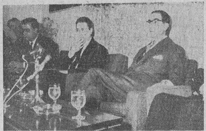
El ministro de Comercio, don Alberto Ullastres, durante la entrevista celebrada con los periodistas nacionales y extranjeros en el Club Internacional de Prensa de Madrid y durante la cual habló de su reciente viaje por varios Estados del Oeste de Africa, así como del interés que en los mismos se siente por España.