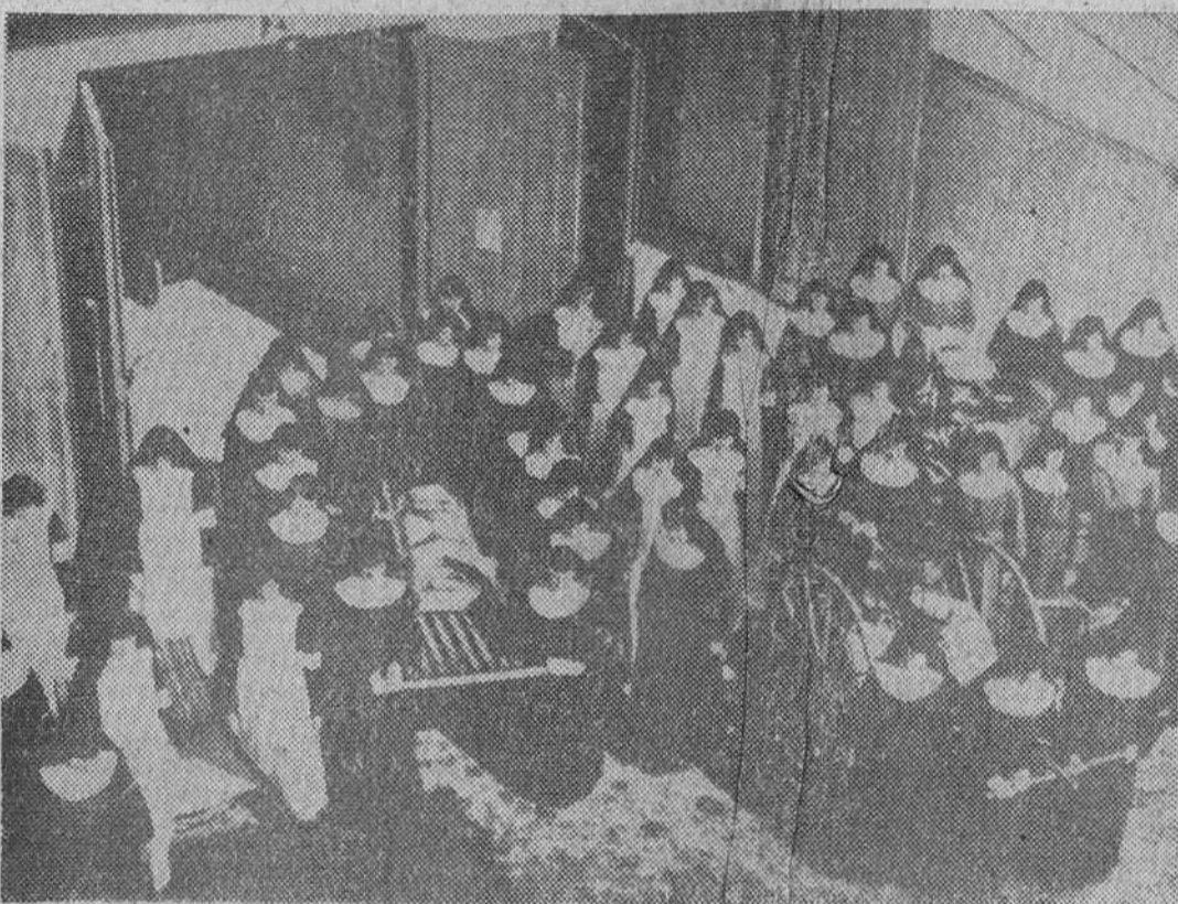
El convento alemán de Ursberg, donde son atendidos 1.500 niños deficientes mentales, cuenta con su propio servicio contra incendios y de primera ayuda. En la foto se ven las bomberas del equipo contra incendios durante un ejercicio. Las sanitarias se distinguen de las demás por sus delantales blancos.

El Gobierno chipriota ha rechazado el ultimatum turco por inaceptable declarándose dispuesto a la defensa. Reunion de urgencia del Consejo de Seguridad en la que U Thant anunció que la fuerza de la ONU ha quedado ya constituida.