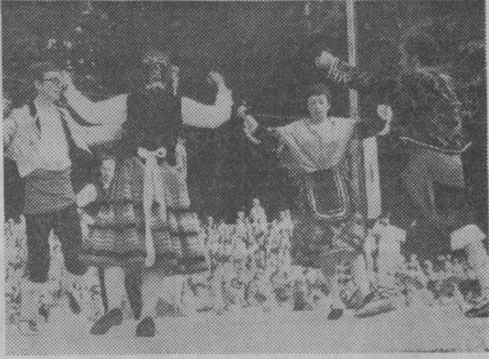
Parte del Grupo de Danzas «Justo del Río» en uno de sus brillantes recitales, de Schoten.

Para definir la suma belleza del folklore europeo en la alborozada cita del festival internacional de Schoten, necesitaríamos presentar delante del lector, como en luminosa pantalla panorámica, toda una cromática gama de colores, capaz de brillar en la fantasía o sobriedad típica de los trajes regionales como el diáfano fulgor de un arco iris, y ofrecer al paladar de sus sentidos, la embriagadora y extraña sintonía de una potente banda sonora, rica en contrastes musicales.