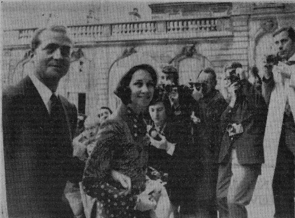
Paris. — Los Príncipes de España don Juan Carlos y doña Sofía, que se encuentran en Francia desde el pasado día 23, fueron invitados por el presidente francés Georges Pompidou a un almuerzo. En la fotografía, los Príncipes de España, a su llegada al Palacio del Eliseo.

Amplio eco en los medios de información sobre el viaje de D. Juan Carlos