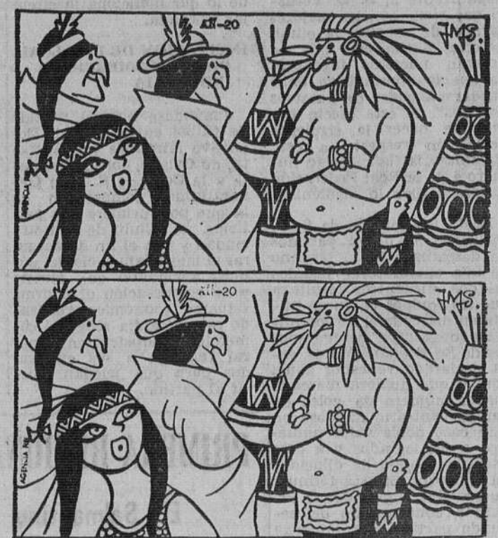
Estos dos dibujos son aparentemente iguales. Siete diferencias les separan. Si es usted buen observador debe descubrir las antes de cinco minutos.