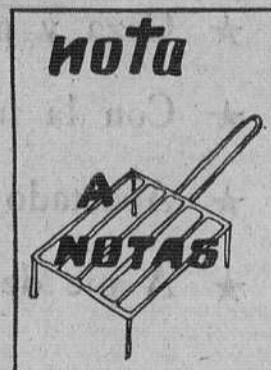
¿Qué vas a hacer?

—Tiempo espléndido y ni rastro de lluvia, por desgracia.