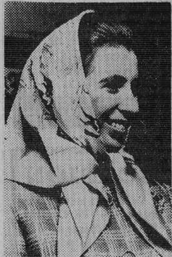
La Princesa Ana de Inglaterra luce una sonrisa radiante cuando es fotografiada llevando un pañuelo estampado con caballos de carrera jamosos, durante una visita al Centro de Juegos Infantiles de Notting Hill, en Telford Road, Londres.

Los diarios ilustran con fotos sus informaciones sobre el almuerzo ofrecido a mediodía de ayer en el palacio del Eliseo por el presidente de la República Francesa. Recoge hoy el diario independiente «Le Parisien Libéré» la visita a París del Príncipe de España y su esposa, en primera página y publica una foto en la que aparece el presidente Pompidou y el Príncipe de España con sus respectivas esposas en el momento de despedirse después del almuerzo del Eliseo.