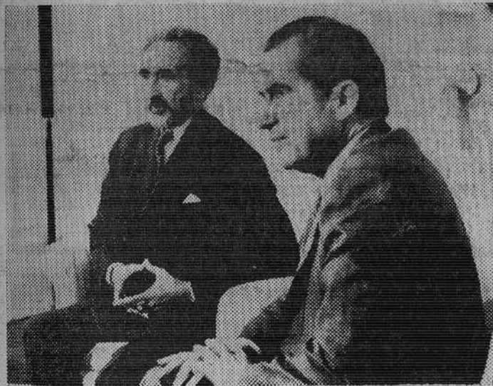
Washington. — El Emperador Haile Selassie I de Etiopía aparece junto al presidente Nixon durante su entrevista en la Casa Blanca. Selassie estaba entre los invitados a un banquete de Nixon, conmemorando el 25 aniversario de las Naciones Unidas.