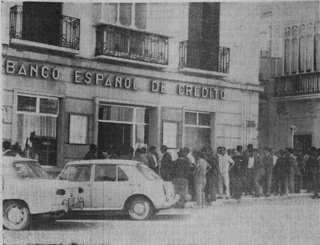
Todas las semanas los trabajadores españoles que prestaban servicios en Gibraltar cobran normalmente sus salarios en las entidades bancarias o Cajas de Ahorro de las diferentes localidades de la región. Las promesas hechas por el Gobierno se cumplen mientras poco a poco van encontrando nuevos trabajos y ocupaciones, o especializándose en las diferentes escuelas de formación profesional, maestría industrial u hostelería. En esta fotografía vemos la «cola» formada ante un Banco de Algeiras por los citados trabajadores para percibir sus jornales.

Los españoles -subraya un periódico de Dublin- han tratado este asunto como una broma