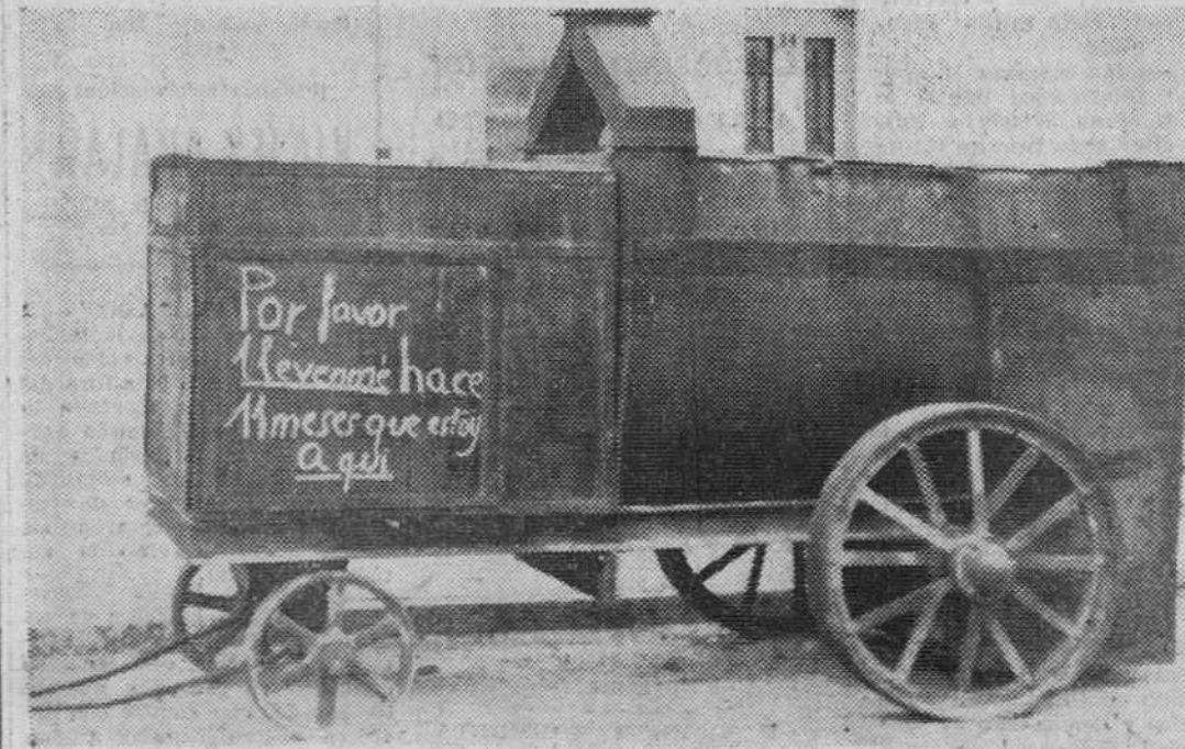
Hace nada menos que 126 y 200 años conforme señala el precedente grabado, está abandonado, en la calle de Petronilla Casado, este remolque de asfalto. No es preciso comentario alguno. ¡Para qué!