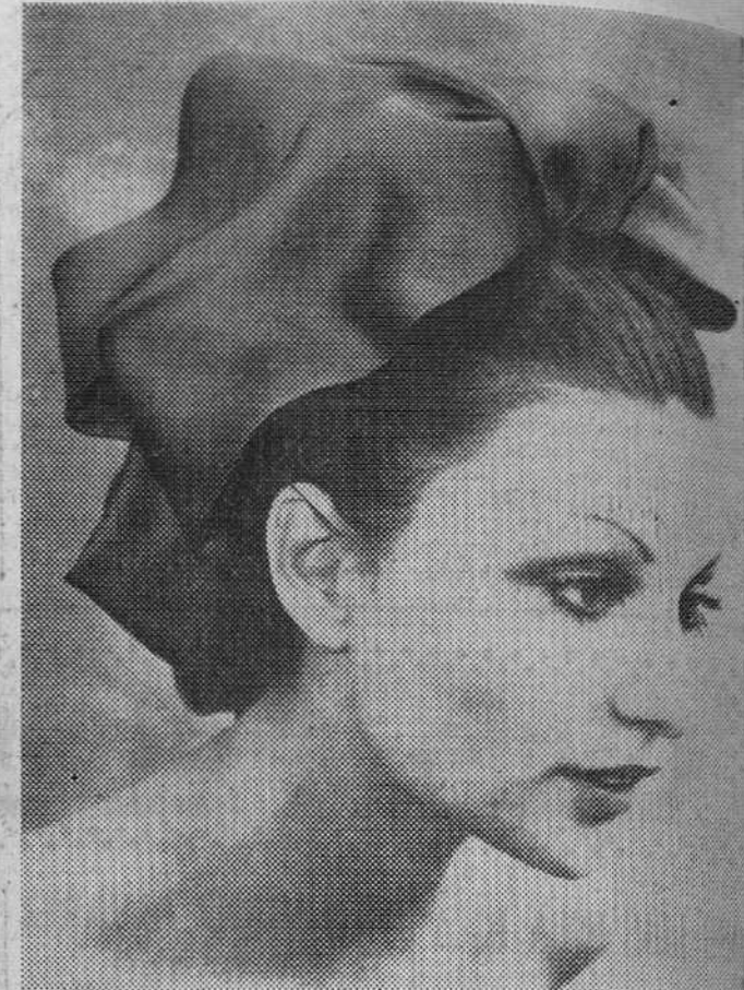
Esta creación de Orceel, en gasa color caramelo, muy propia para estos calores.