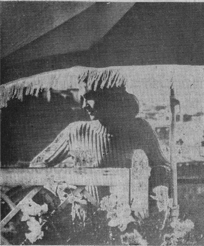
El ama de casa es el miembro de la familia, que más descanso necesita durante el periodo de vacaciones.

Para limpiar los atuendos, se puede emplear un cepillo «adhésivo» que recoge todo el polvo, hilos y pelos de animales. Para