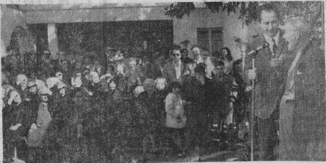
En el asilo de ancianos de las Hermanitas de los Pobres de Cádiz, ha tenido lugar un alegre festejo en honor de todos los ancianos que viven en él. Muchos de ellos se animaron y se sumaron al espectáculo. También colaboraron en la fiesta los estudiantes sudamericanos que viven en Cádiz. En la foto vemos un momento de ella.