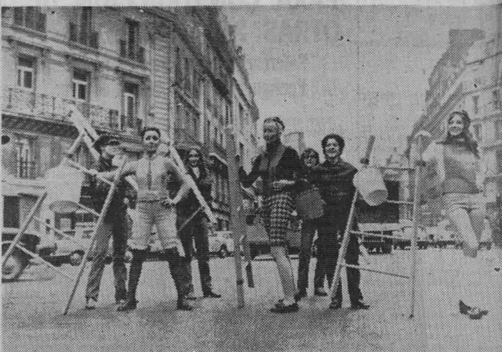
Ha hecho su debut oficial en París un nuevo servicio para limpieza de los cristales de los escaparates, que está a disposición de todos los comerciantes que lo soliciten.