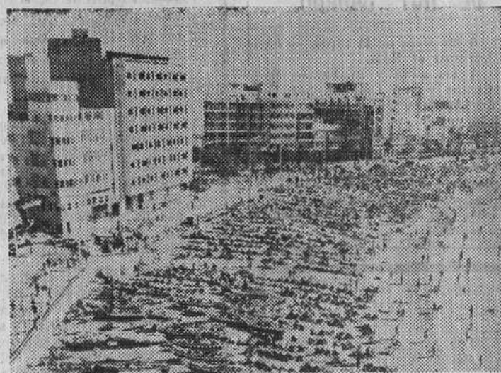
Las Palmas. — Impresionante fotografía de la playa de Las Canteras, obtenida el día de Navidad, cuando miles de personas gozaban al sol y al aire de la excelente temperatura reinante. En el paseo de dicha playa, un tradicional árbol navideño preside los juegos y paseos de los bañistas.