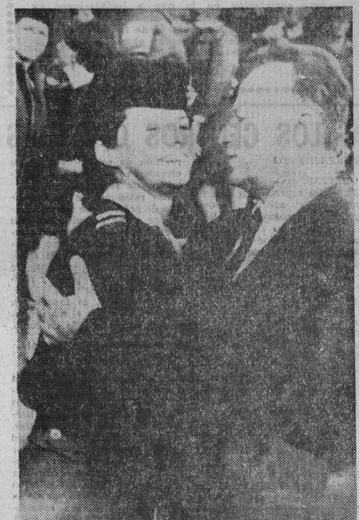
Tel Aviv (Israel). — El embajador de Israel en Washington, general Itzhak Rabin abraza a su hija, la teniente Dalia Rabin, de 18 años, durante la visita realizada a las unidades del Ejército israelí de posición en la línea de demarcación del alto el fuego.