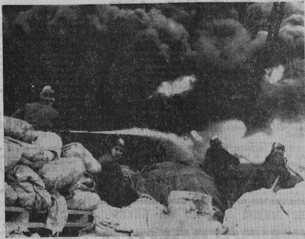
Barcelona. — Un aspecto del gigantesco incendio producido en una explanada cerca del muelle adosado, en el puerto de Barcelona, al arder la mercadería allí existente.