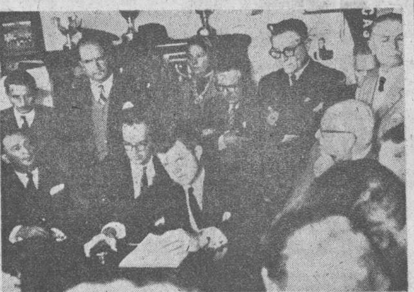
Buenos Aires. — Durante su gira por Hispanoamérica, el hermano menor del presidente Kennedy se entrevistó en la Argentina con dirigentes sindicales del país, los que le expusieron el punto de vista laboral argentino en relación con la política norteamericana. En la foto: Edward Kennedy con los dirigentes, en la cordial reunión.