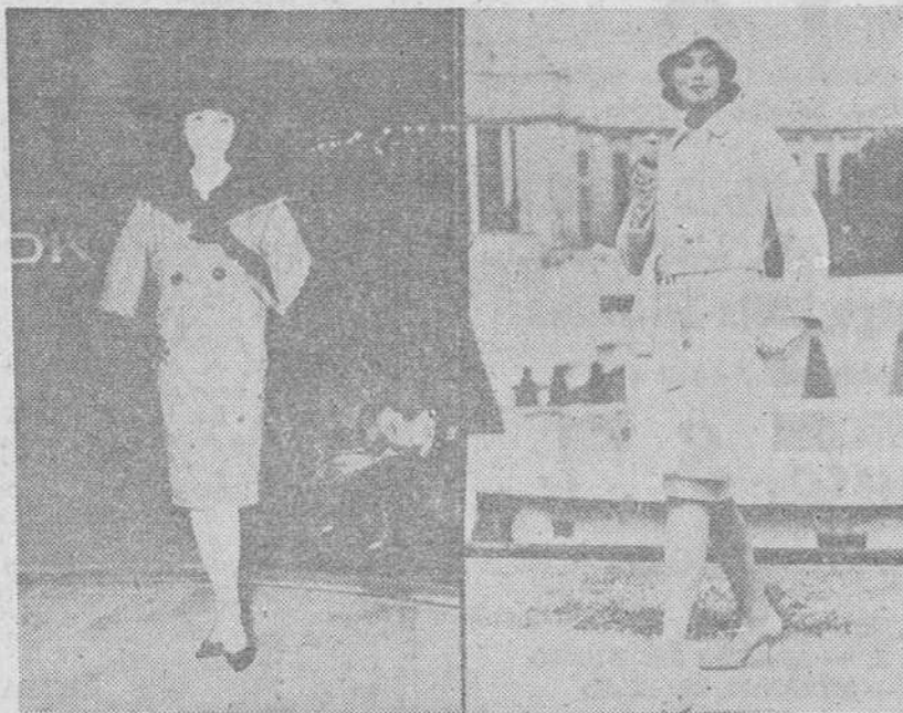
Ofrecemos a Vds. dos fotografías de muy distinta procedencia. Una viene del Japón. La otra de París. Sin embargo, no resulta fácil adivinar a simple vista cuál es una y otra porque ambas tienen un gran parecido. Hasta los rostros de las dos modelos ofrecen cierta semejanza. Y es que la moda actual es universal y llega a todos los países. No obstante, para sacarlas de dudas les diremos que el modelo de la derecha es francesa y luce un abrigo de paño beige claro, muy deportivo. La de la izquierda es una bella japonesa que luce con garbo un traje «tweed» compuesto de falda y chaqueta con cuello de piel de zorro como el sombrero.

ROMA Pronunciar esta palabra, Roma, es llenar la mente con un mundo aparte de todos los demás, un mundo donde de pronto surgen los pálidos amarillentos palacios repletos de los máximos esplendores, entre laberintos de callejuelas insólitas y plazas infinitamente pequeñas para la belleza exuberante de las fontanas barrocas; es un mundo curvado por las siete colinas y las basílicas fantásticas; es el mundo de Santa Maria de Trastevere, engritico por las