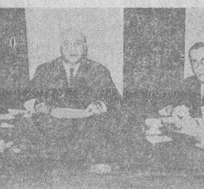
Primera reunión del nuevo Gobierno sirio