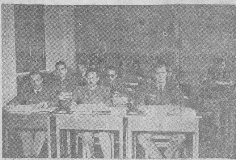
El Príncipe Juan Carlos, alumno del curso informativo de cooperación aeroterrestre

Sede de las Naciones Unidas.—La Alemania occidental ha hecho una donación de tres millones de dólares al fondo de las Naciones Unidas para el Congo. ADVERTENCIA A LOS EUROPEOS EXPULSADOS Leopoldville.—El Gobierno central congolés ha dado a conocer una advertencia dirigida a los europeos que hayan recibido una orden de expulsión que deberán abandonar el Congo inmediatamente. En el anuncio del ministro del Interior se dice que si estos extranjeros no obedeciesen estas órdenes, serán castigados con penas de prisión antes de ser expulsados definitivamente por el Gobierno congolés.—Efe. FRACASA UN COMLOT PARA ASESINAR A NKUMAH Accra.—Adversarios del presiden-