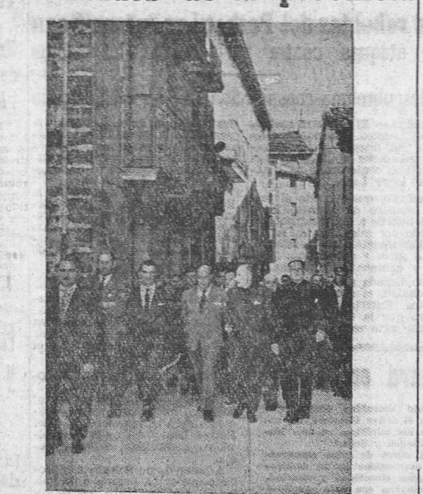
El gobernador civil durante su visita a Pradoluengo, en la tarde de ayer