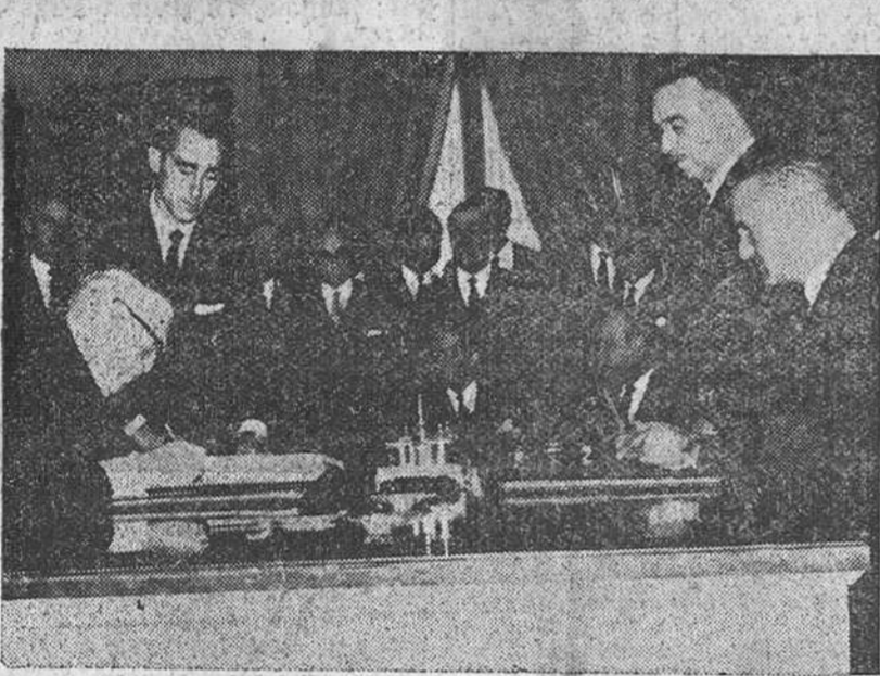
Las notas señaladas de la estancia del ministro alemán, doctor Erhard, en la capital de España. En primer término, el ilustre economista durante su entrevista con Su Excelencia el Jefe del Estado. — En la segunda placa, un momento del acto de firma del convenio hispano-alemán de cooperación económica.