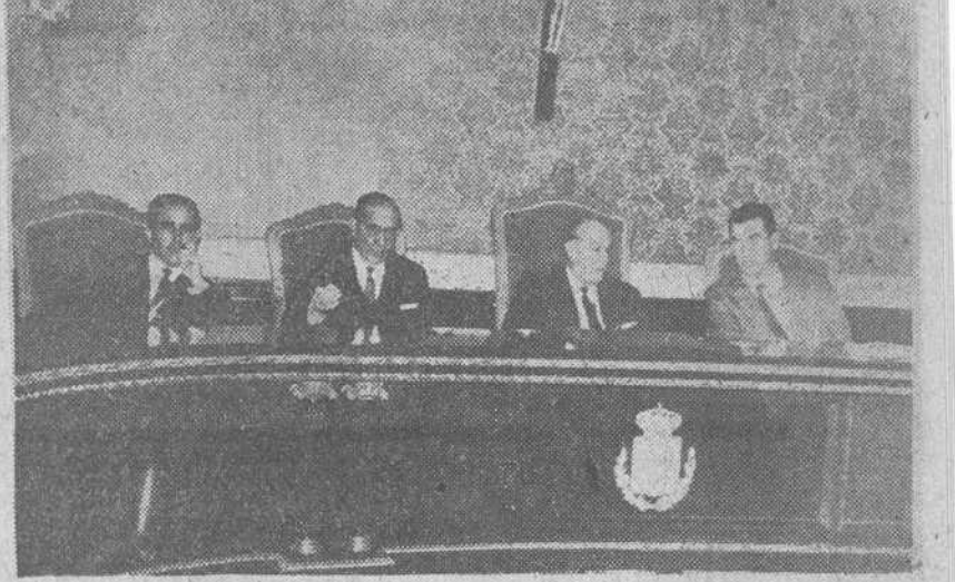
He aquí un momento de la reunión celebrada ayer por el pleno de la Comisión provincial de Servicios Técnicos de Burgos y en la que se aprobó el plan de "urgencia social", que importa cuarenta y un millones de pesetas.

Afecta a 108 pueblos burgaleses y su realización dará comienzo en breve, esperándose que a primeros de año llegue la subvención estatal, de 17 millones y medio