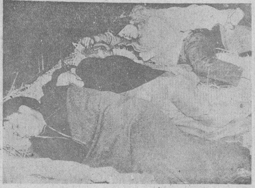
Decazeville. — Continúa la huelga de mineros en la región de Decazeville, y las hulleras de Aveyron. Con tal motivo los mineros pasaron la Nochebuena en el fondo de la mina.