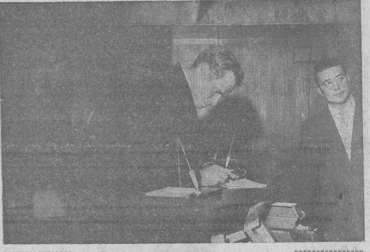
Madrid. — Para asistir al estreno de la película «El Cid», ha llegado a Madrid el protagonista de la misma, Charlton Heston, que aparece en la foto poco después de arribar al hotel donde se hospeda.