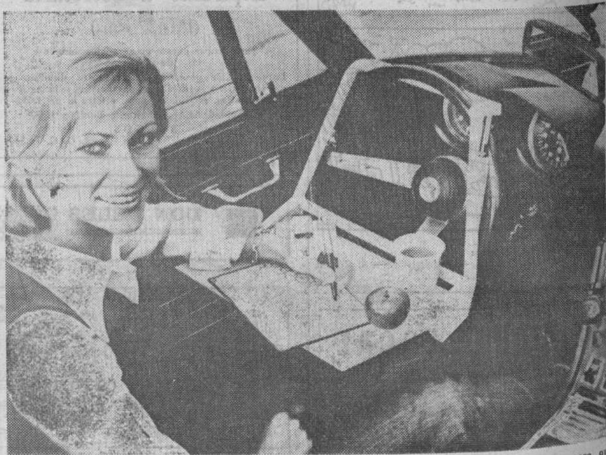
Para aquellos conductores que pasan la mayor parte de su tiempo en la carretera he aquí una mesa que puede ser de su interés. Es fácilmente ajustable a cualquier tipo de coche y lo mismo sirve para comer que para beber.