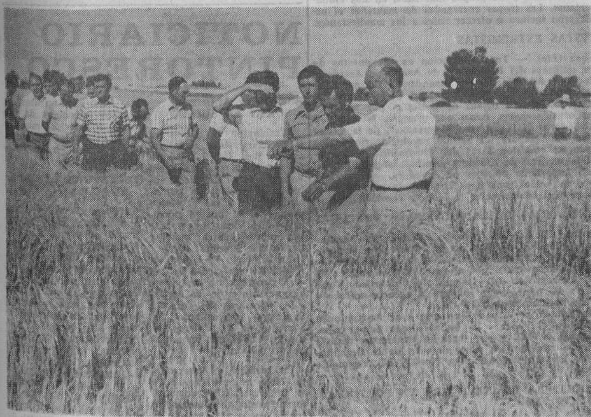
Los agricultores observan con interés y comentan animadamente los favorables resultados de las variedades de cebadas cerveceras promocionadas por SAN MIGUEL.

tre cebadas cerveceras y orientando al cultivador español en las modernas prácticas de su cultivo, todo ello a cargo de experimentados técnicos de dicha Empresa especializados en la materia.