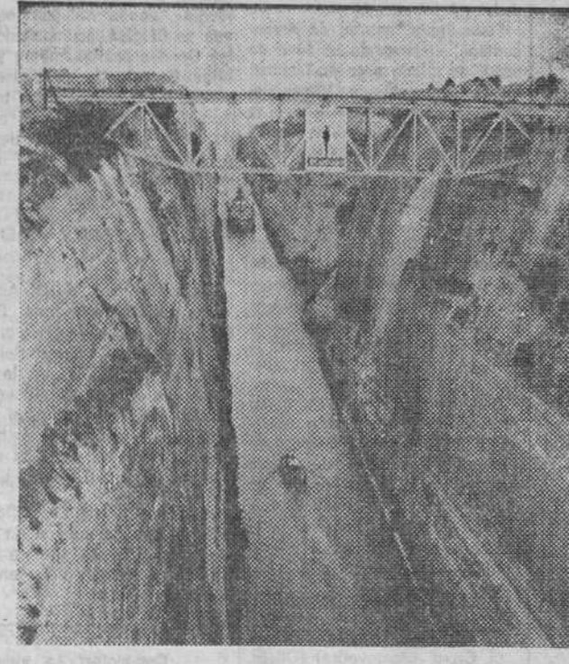
El emblema de la revolución del 21 de Abril, la de los Coroneles, campea sobre el Canal de Corinto.

En la cárcel de Korydalos en el Pireo, Atenas, el pasado día 28 el llamado «Nuremberg griego». Están en el banquillo de los coroneles y responsables del golpe militar de 21 de Abril de 1967, que derribó al rey Panayoyis Canelopulos. Como es sabido Papadópulos, Pattakos y Makarezos, cuando la defensa para encastillarse en el silencio e incluso en la ironía, secundados por otros veinte acusados. Papadópulos, cerebro del «putsch» de 1967, ha afirmado que se trató de un golpe de Estado sino de una «revolución». Tanto Makarezos como Pattakos afirman que su adhesión a la «revolución» fue total. En el espacio de los días más, que puede durar el proceso de Atenas, saldrán a la luz revelaciones que van a clarificar sin duda el período de más de siete años que Grecia vivió coroneles. ¿Qué sucedió durante esos siete años? MANUEL LEGUINECHE, que estaba en Chipre hace un año cuando cayó la Junta Militar, recibió de los coroneles en Nicosia la noticia transmitada por Radio Ankara. Pocos días antes de su llegada a Atenas, ciudad que había visitado repetidas veces desde 1962. En esta serie de artículos Leguineche, describe el «tiempo de los coroneles», desde la noche del 20 al 21 de 1967 hasta su caída hace ahora poco más de un año.