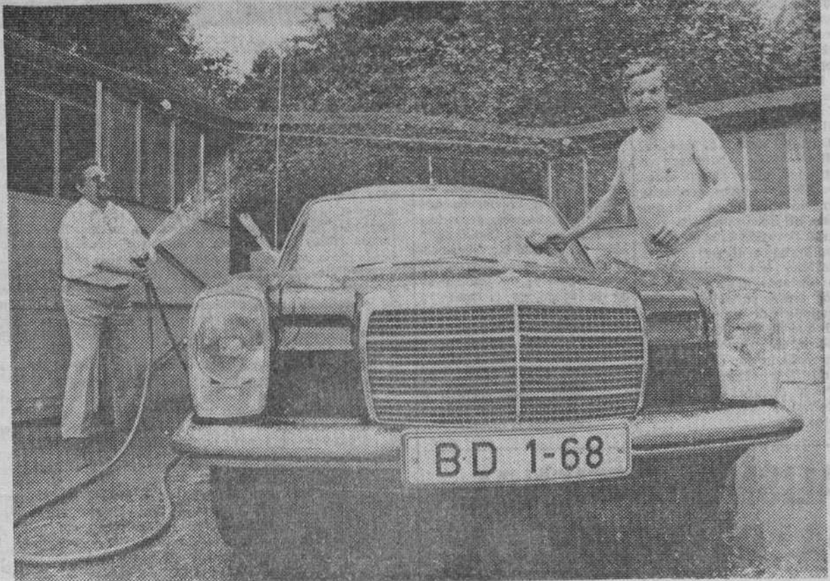
Bonn. — El Gobierno de la República Federal de Alemania acaba de adoptar una medida de ahorro que espera tenga repercusiones favorables: El parque de coches oficiales, de 420 vehículos, se reducirá a 70 antes de finales de 1976. El Ministerio Federal del Interior estima que los ahorros así obtenidos se elevarán a unos cuatro millones de marcos anuales. En el futuro serán sólo el canciller, sus ministros y sus subsecretarios los que dispondrán de "auto para su servicio exclusivo". Todos los otros altos funcionarios, como directores de departamento o generales del Ministerio de Defensa, dependerán en el futuro del parque móvil central y, posiblemente, utilizarán su coche privado con mayor frecuencia. La fotografía muestra a conductores y coche oficial en un caluroso día de verano en Bonn. — (Foto DAD).