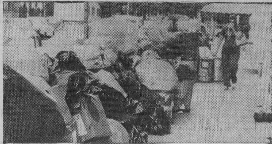
Nueva York en bancarrota. Una atribulada neoyorquina se tapa la nariz con un pañuelo para circular entre los enormes montones de basura abandonados en las calles como consecuencia de una huelga de empleados de los servicios de limpieza que valió a la ciudad de los rascacielos el nombre de «ciudad pestilente».

Estados Unidos debe mucho de su imagen más favorable, de su perfil de los breves años de luna de miel con el Mundo, a Nueva York, la ex «ciudad alegre y confiada». Los rascacielos de Manhattan, los puentes sobre el Hudson y el East River, el edificio de las Naciones Unidas, no son sino algunos de los elementos notables de la ciudad que resultan familiares en todo el Mundo. Es una de las pocas ciudades norteamericanas con ambiente cosmopolita, que debe tanto a su reciente pasado de puerta de entrada al paraíso estado.