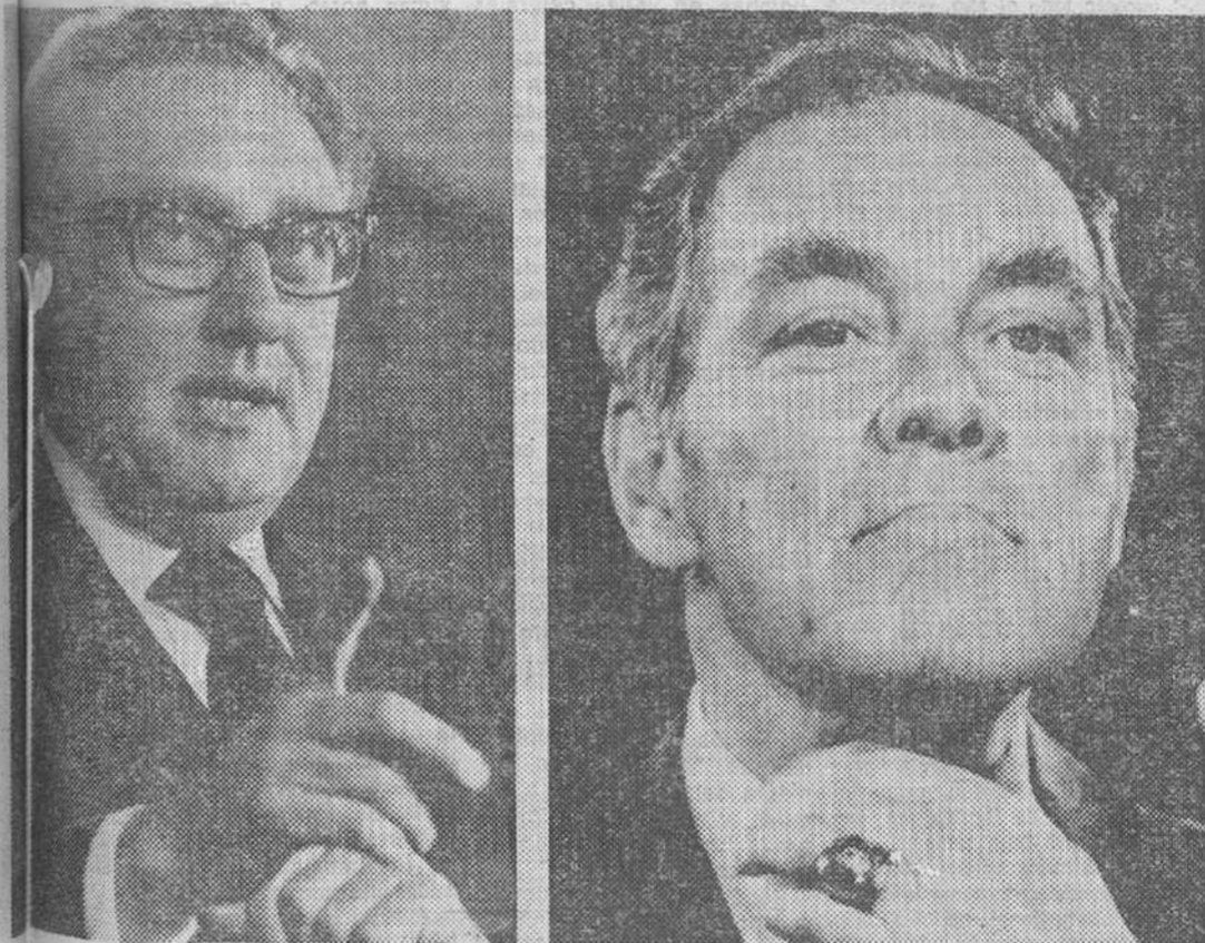
Kissinger y Haig, dos políticos de arrolladora personalidad.