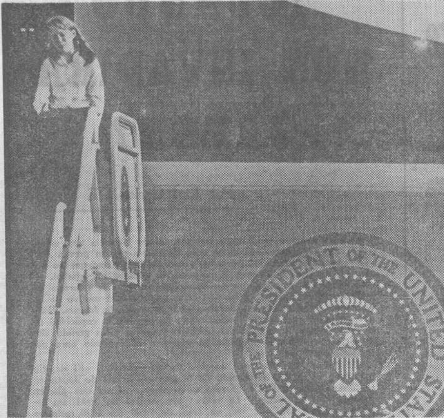
Washington. — Mientras el nieto del presidente Ronald W. Reagan jugueteaba después de la confirmación presidencial de su abuelo, Amy, la más pequeña de los hijos de Jimmy Carter, llora desconsoladamente desde la escalera del avión de las Fuerzas Aéreas norteamericanas que les llevaría de regreso a su antiguo hogar de Georgia.