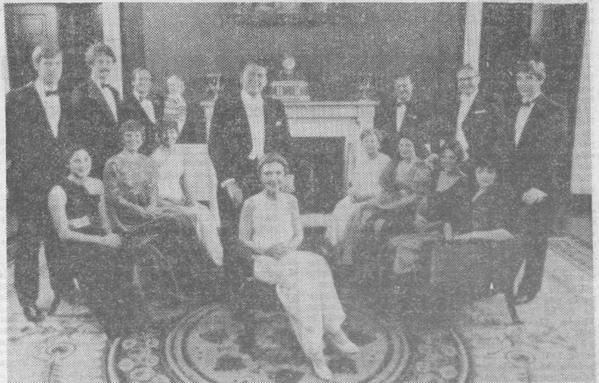
Washington. — El presidente Ronald Reagan y su esposa Nancy, aparecen en este retrato oficial, tomado junto a toda la familia en la Casa Blanca.