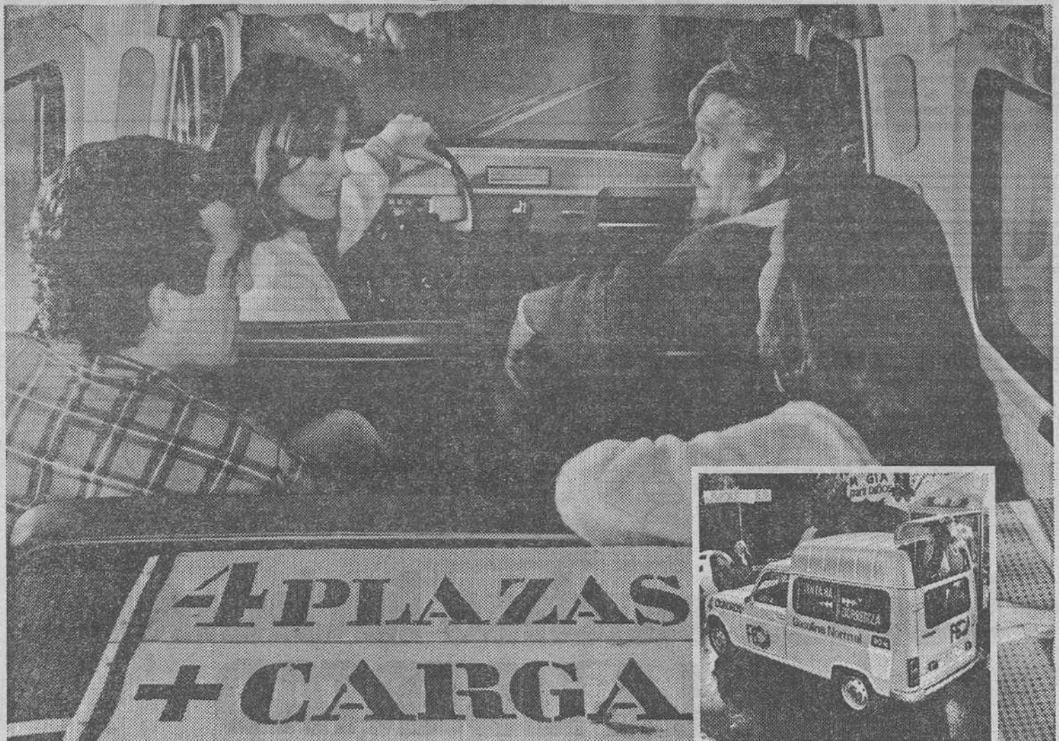
Renault 4 F6 Acristalada. 2 ó 4 plazas.