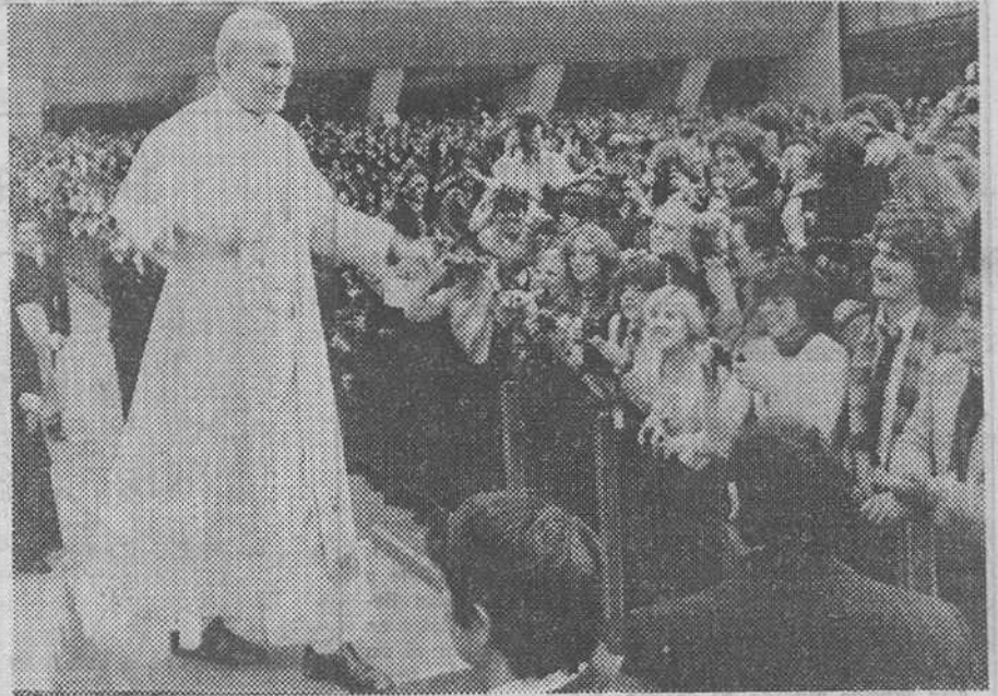
Ciudad del Vaticano (Italia). — El Papa Juan Pablo II saluda a los peregrinos y visitantes que acudieron a la audiencia general que se celebró el pasado día 21 en la Ciudad del Vaticano. El Pontífice, durante su discurso dirigido a una multitud de cerca de 7.000 personas, aludió su satisfacción por la liberación de los rehenes norteamericanos.