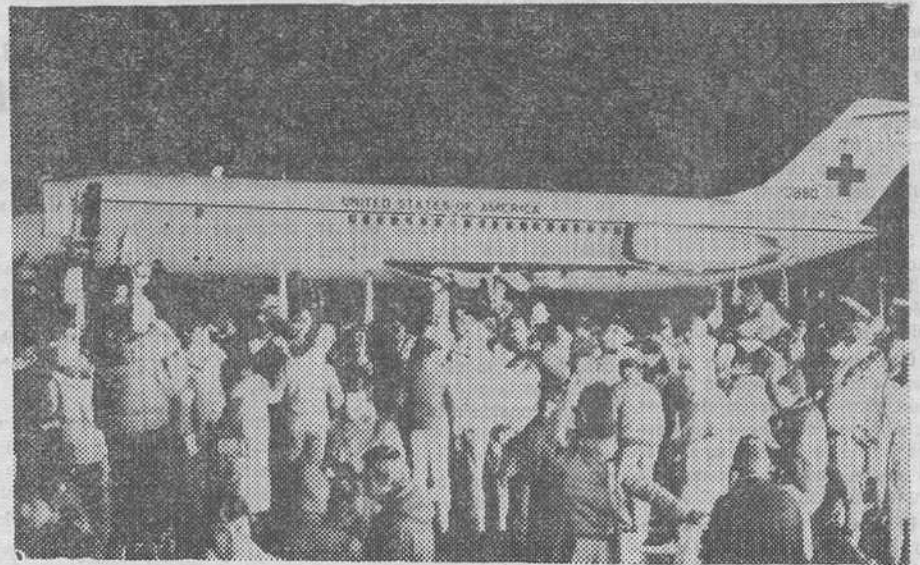
Wiesbaden (Alemania Federal). — Los dos aviones procedentes de Argel que transportaban a los 52 ex-rehenes norteamericanos, liberados tras 444 días de cautiverio, llegaron a la base aérea estadounidense de Rhein-Main, en Wiesbaden, desde donde fueron trasladados al hospital militar norteamericano de esta localidad. En la foto, uno de los «DC-9» de las Fuerzas Aéreas norteamericanas que transportó a los ex-rehenes.