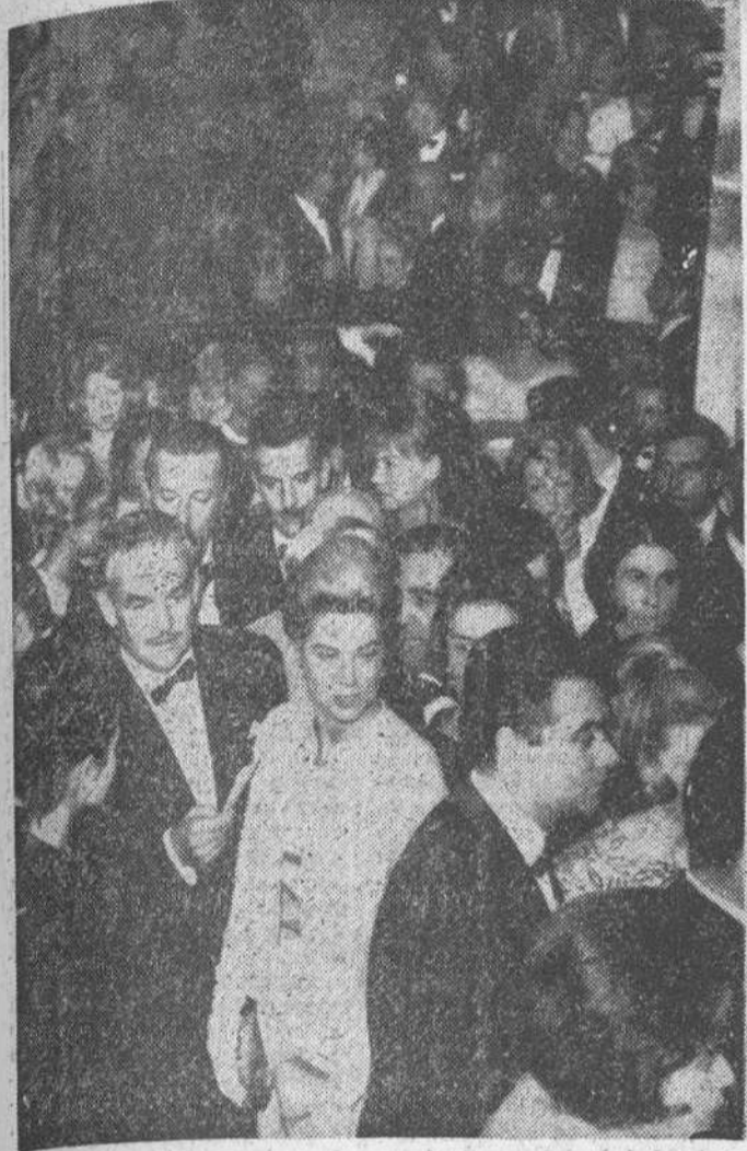
París.—Elegantes caballeros y bellas damas aparecen saliendo de la estación de los Inválidos del «Metro» parisiense. Destino: Normandie Cinema, para asistir al estreno de la película «Cleopatra». Entre la multitud vemos a los Príncipes Raniery y Gracia de Mónaco. La razón es que, para evitar los embotellamientos de tráfico, los distribuidores de la película alquilan un tren de ferrocarril subterráneo, para el transporte de sus invitados.