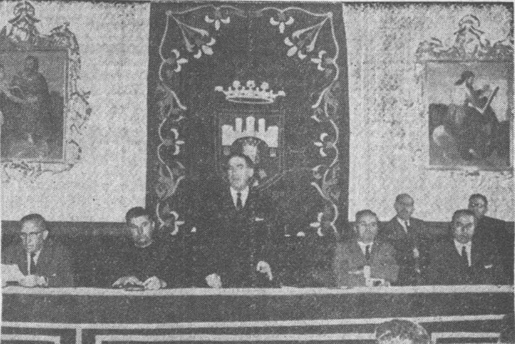
Con la acostumbrada solemnidad conmemoraron ayer el "Día Universal del Ahorro" las entidades de ahorro benéficas de nuestra ciudad, con actos de que damos cuenta en otro lugar del presente número. En el precedente grabado, dos placas de "Fede", obtenidas, respectivamente, durante la distribución de premios por la Caja de Ahorros del Circolo Católico y la apertura de curso en la Escuela de Agricultura de Saldanueva, de la Caja de Ahorros Municipal.