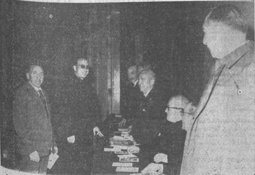
Con la acostumbrada solemnidad conmemoraron ayer el "Día Universal del Ahorro" las entidades de ahorro benéficas de nuestra ciudad, con actos de que damos cuenta en otro lugar del presente número. En el precedente grabado, dos placas de "Fede", obtenidas, respectivamente, durante la distribución de premios por la Caja de Ahorros del Circolo Católico y la apertura de curso en la Escuela de Agricultura de Saldanueva, de la Caja de Ahorros Municipal.