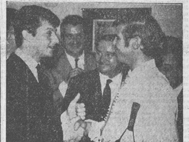
Tony Renis, saludando al más famoso de los toreros españoles del momento, «El Cordobés», en una tarde de actuación del diestro.

(De la Redacción de Hispania Press. En exclusiva para DIARIO DE BURGOS). — De nuevo está en Barcelona Tony Renis, el triunfador de San Remo 1962. Ha venido a actuar en la TV por segunda vez. Y las que volverán... Su juventud y simpatía lo arrojan todo. No en balde está en centil de la fama, en Italia, y así lleva ya 10 años. —¿Ha triunfado el premio de San Remo en el Mundo? —Yo creo que sí. —¿Cuántas veces has participado en el famoso Festival? —Tres. —¿Cuál fue tu clasificación el primer año que te presentaste? —Ni me clasificó. Pero al año siguiente, mi canción «¿Cuándo, cuándo, cuándo?», obtuvo el cuarto lugar y, el año pasado, quedé por aquellos tantos éxitos. —¿Está ya el número preparado? —Completamente. —¿Puedes adelantarme algo de la melodía? —Imposible, lo prohíbe el Reglamento del Festival. —¿Cómo te inspiras? —Como siempre... una mujer tuvo la culpa... —Tengo entendido que vas a rodar una película en España, ¿es cierto? —Pues sí. Creo que esta vez va de veras. Anteriormente, ya había tenido algunas ofertas, pero ninguna llegó a cuajar. En esta ocasión, las negociaciones ya están muy adelantadas. —¿Quién será ella? —Pues no lo sé aún. —¿No será Carmen Sevilla? —Yo sé que en este viaje ha almorzado un día con el matrimonio Algueró. —De verdad... No lo sé aún. —¿Para cuándo está previsto el rodaje?