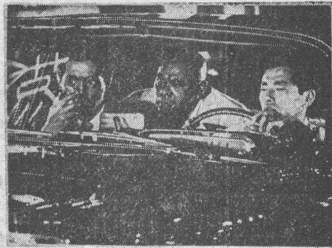
...cesas, choca curiosamente con el amaneramiento de las películas presentadas por Roma y los países del León de acero.

VENEZIA se ha hecho también eco de los problemas racistas que atormentan a Norteamérica, y ha sido una película norteamericana la que los ha planteado: «The Cool World», de la directora Shirley Clark. A pesar de estar basada en una obra de teatro, no hay graves reparos para considerarla como ejemplo de «cinema-verité». Es una visión dura y tremenda de la vida de los negros de Harlem a través de la de un muchacho de catorce años, jefe de una banda de jóvenes delincuentes y verdadero gánster. La película recoge, «documentalmente», la angustiada situación humana de los negros, condenados a una situación real y a un complejo de inferioridad que crea en ellos una especie de desesperación psicológica que es origen de continuos desastres individuales y sociales. La película es, pues, un documento más que una ficción, y un documento dramático de enorme actualidad.