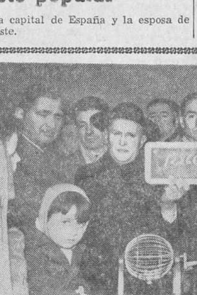
La fiesta de "San Antón"